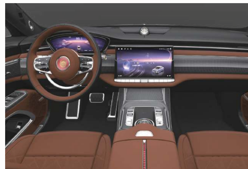
赤陶棕 + 石墨黑