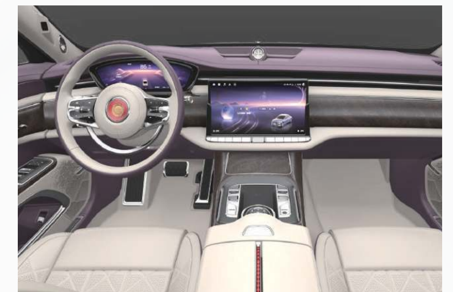
华章紫 + 亚麻米 4