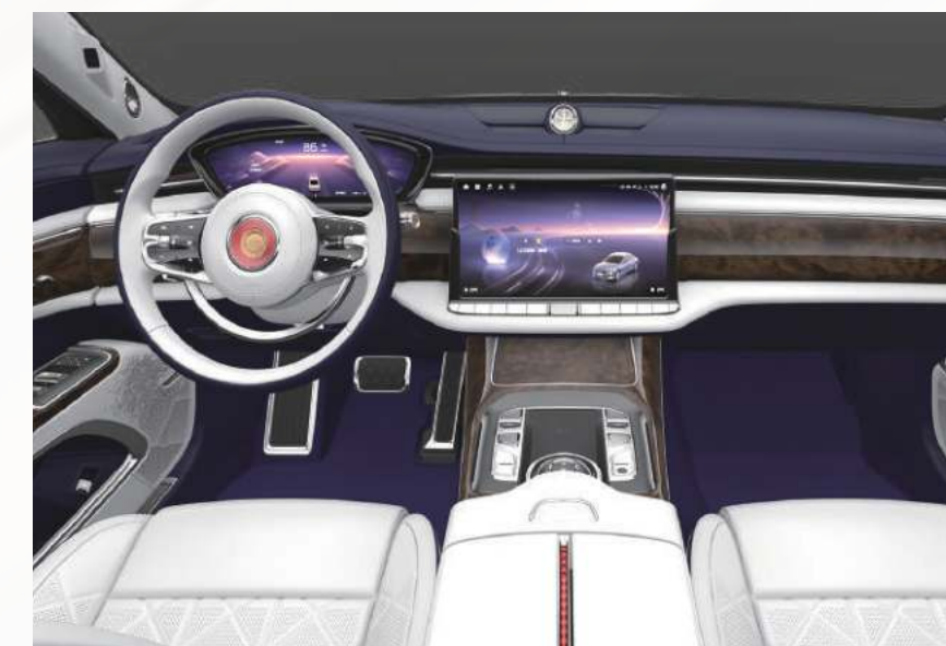
紫罗兰 + 超白