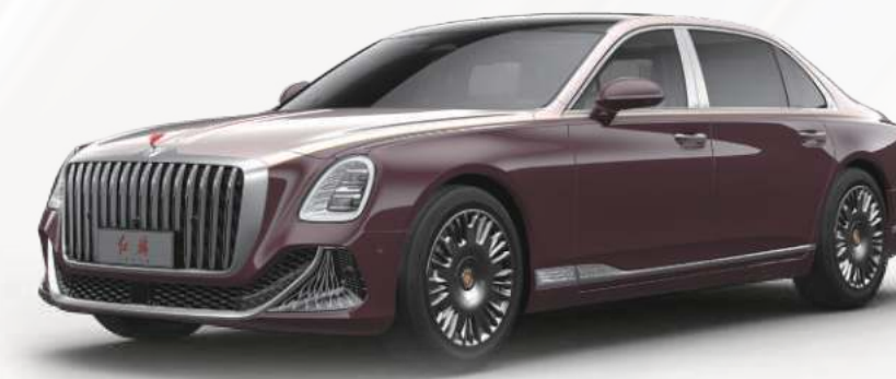
桃蹊蝶舞 + 阿卡金 1