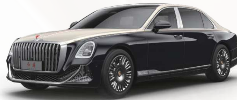
魅夜黑 + 香槟金 1