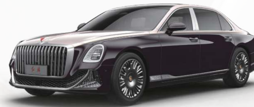
龙胆紫 + 阿卡金 1