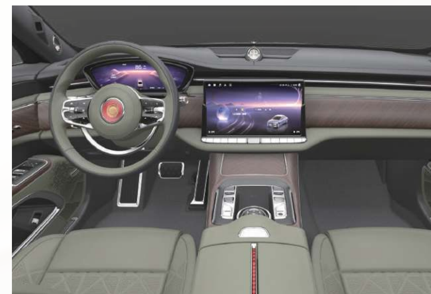
春野绿 + 及雨灰