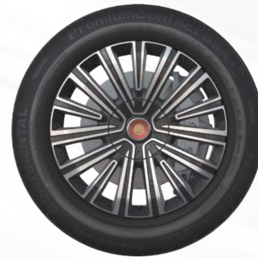
19 英寸 朝晖轮毂 2