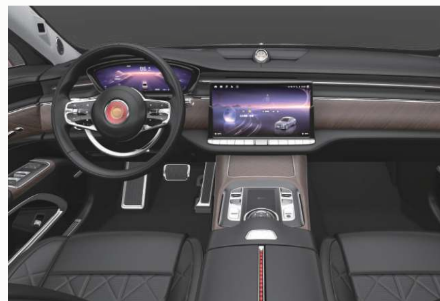
石墨黑 + 超白