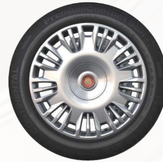
20 英寸 俊山轮毂 3