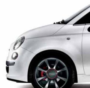
Línea de accesorios (16")*