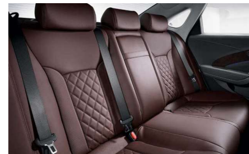
G330 익스클루시브 풀옵션 [버건디 투톤 인테리어]