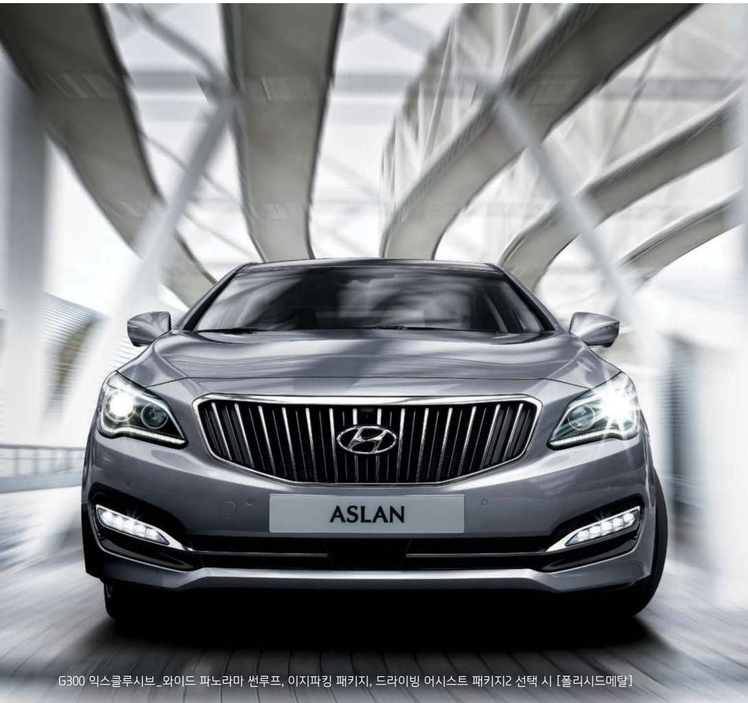
G300 익스클루시브_와이드 파노라마 썬루프, 이지파킹 패키지, 드라이빙 어시스트 패키지2 선택 시 [폴리시드메탈]