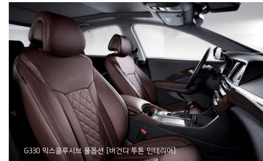
G330 익스클루시브 풀옵션 [버건디 투톤 인테리어]