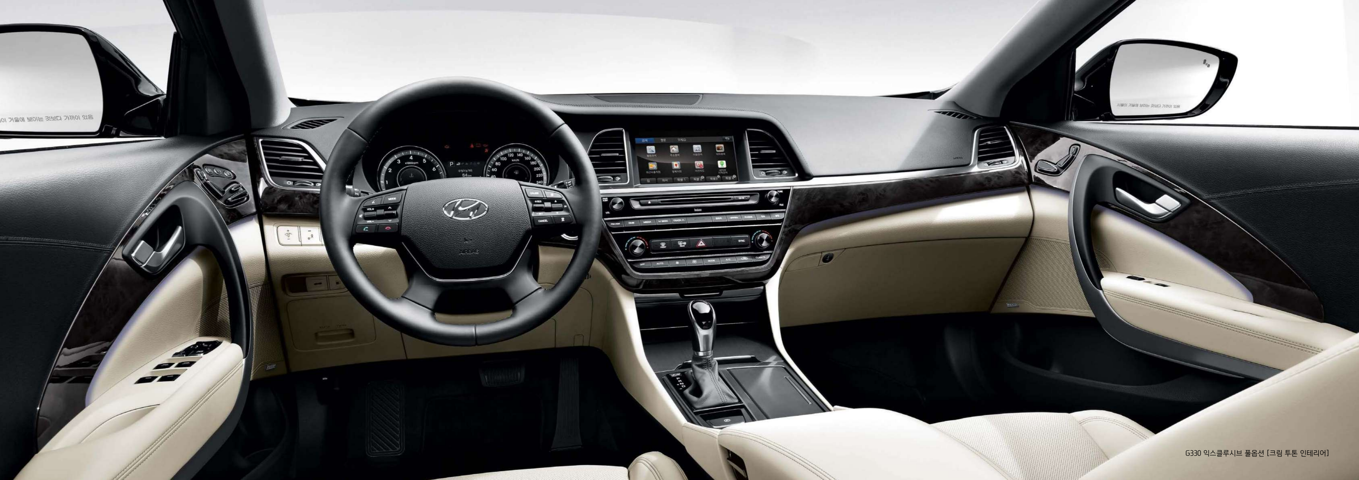
G330 익스클루시브 풀옵션 [크림 투톤 인테리어]