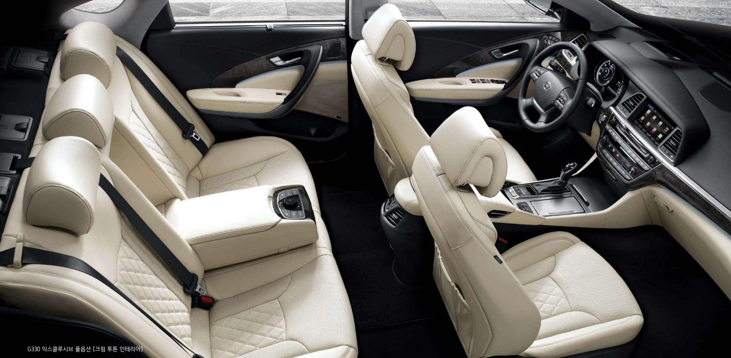
G330 익스클루시브 풀옵션 [크림 투톤 인테리어]