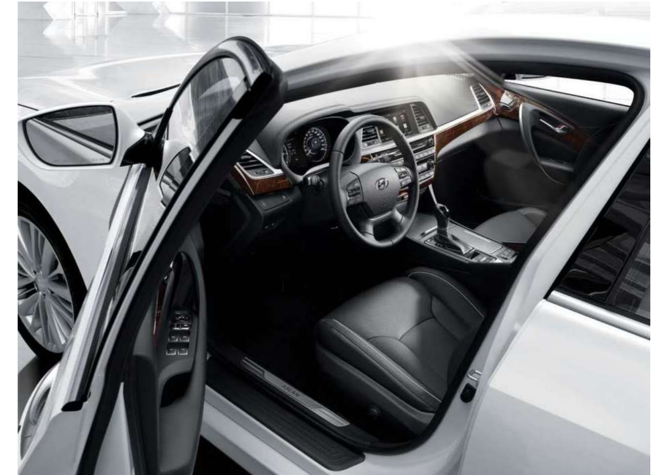
G300 모던_프리미엄 패키지 선택 시 [아이스화이트 / 블랙모노 인테리어]

편안하고 안정적인 주행감과 최상의 정숙함을 동시에 누리는 즐거움, 컴포트 드라이빙을 재정의하다.