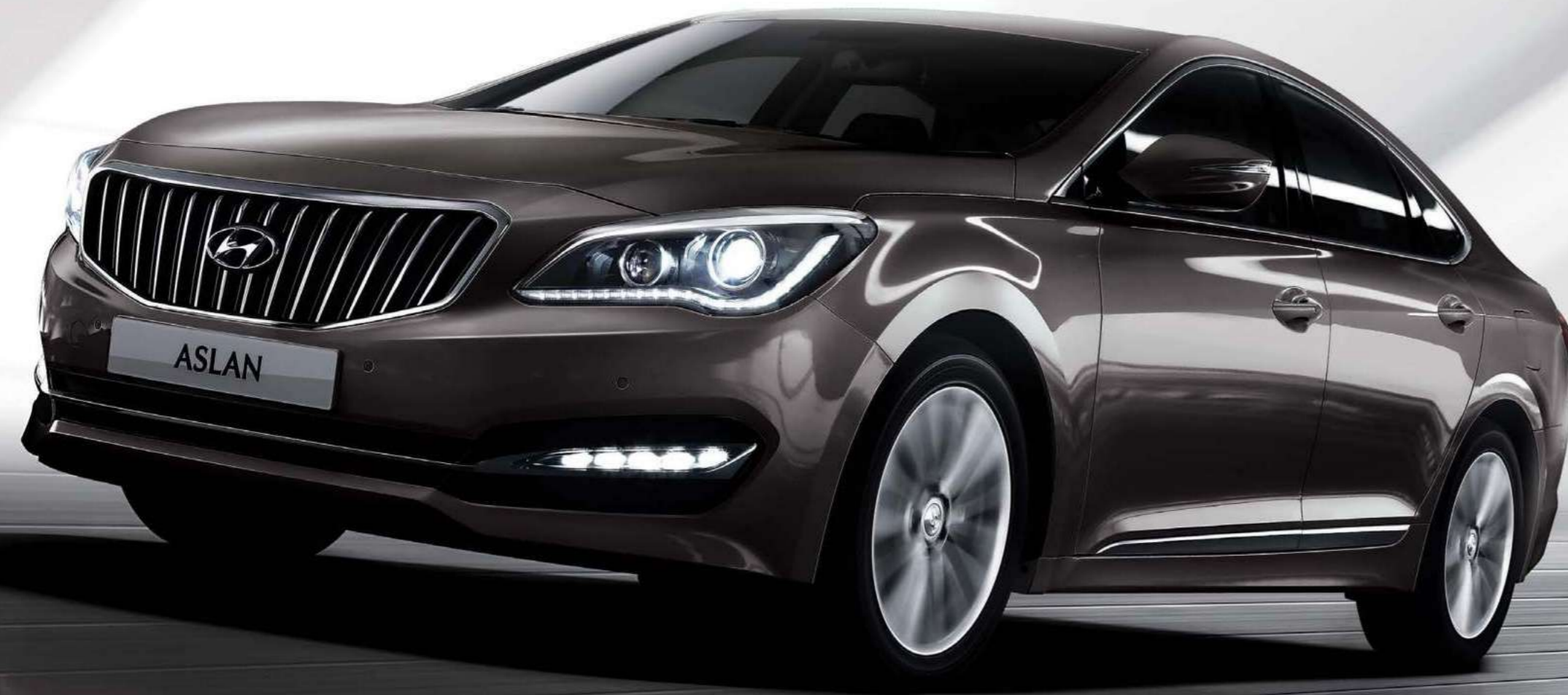
G300 모던 [다크호스]

최첨단 기술이 집약된 V6 GDi 엔진으로 구현한 탁월한 성능, 소음과 진동의 최소화로 구현한 정숙성과 정교한 주행감