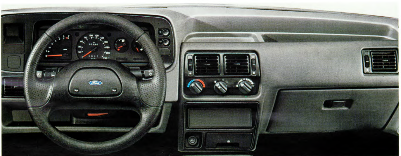
Ergonomisch ontworpen instrumentenpaneel. Radio-cassette speler (ESRT 32 PS) als extra leverbaar.