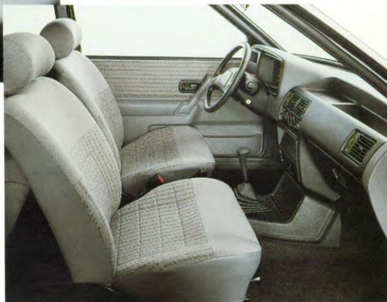
Ruimtelijk, elegant van binnen