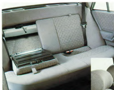
Veelzijdige en flexibele combinaties van de passagiers-/bagageruimte

De ruime bagageruimte kan nog groter worden gemaakt voor het vervoeren van lange of grote dingen. Gemakkelijk kan de achterbankleuning neergeklapt worden (60/40%) waardoor veelzijdige en flexibele combinaties van de bagage-/passagiersruimte gecreëerd kunnen worden.