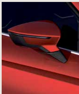
DESIRE RED 2