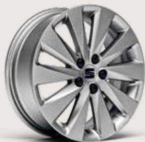
DESIGN 16" LÄTTMETALLFÄLGAR, BRILLIANT SILVER