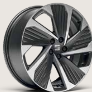
PERFORMANCE 18" MASKINBEARBETADE LÄTTMETALLFÄLGAR, COSMO GREY MATTE PUK