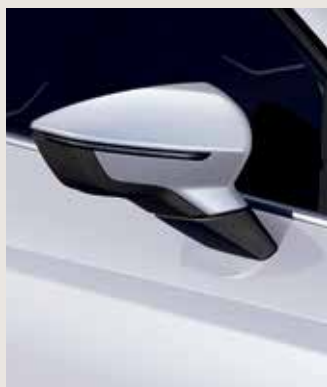
NEVADA WHITE 2