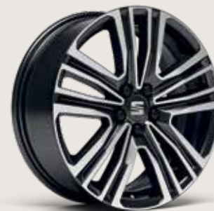
DYNAMIC 17" MASKINBEARBETADE LÄTTMETALLFÄLGAR, NUCLEAR GREY PUD