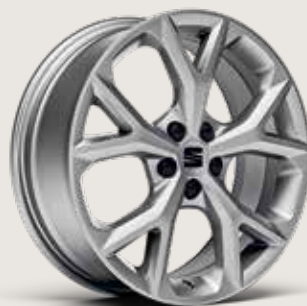
DYNAMIC 17" LÄTTMETALLFÄLGAR, SPORT BRILLIANT SILVER