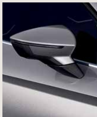
URBAN SILVER 2