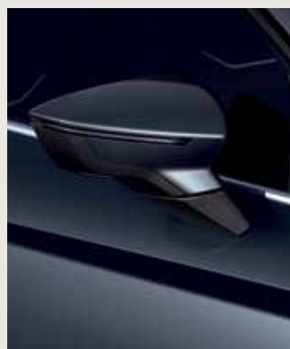
MAGNETIC TECH 2