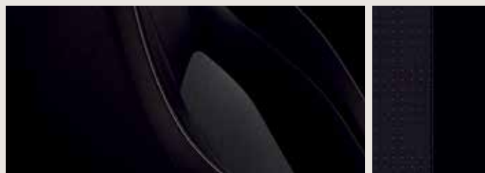
COMO TYG KOMFORTSÄTEN