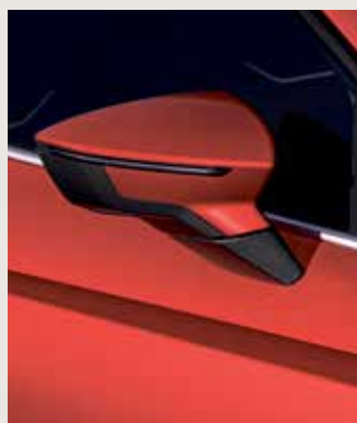
PURE RED 1