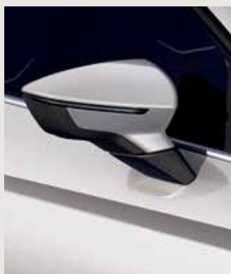
CANDY WHITE 1

1 Solid. 2 Metallic. FR har ytterbackspeglar samma färg som taket. För ST är ytterbackspeglarna i karossfärgen.