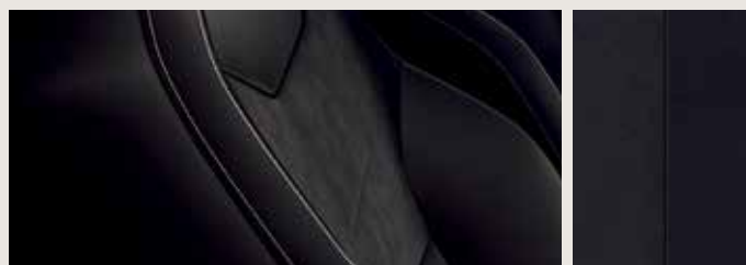
DINAMICA® BLACK SPORTSTOLAR