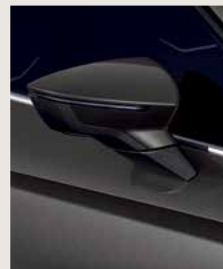
CLIFF GREY 2