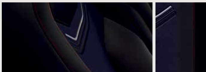
LE MANS TYG SPORTSTOLAR