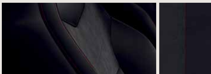
DINAMICA® BLACK SPORTSTOLAR