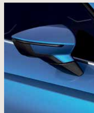
SAPPHIRE BLUE 2