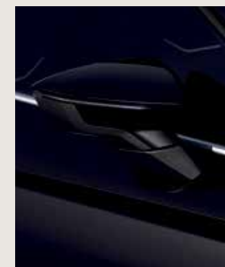
MIDNIGHT BLACK 2