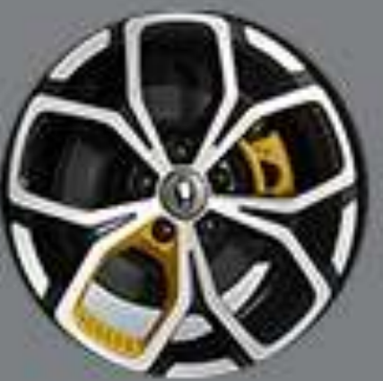
ล้ออัลลอย 18" พร้อมคาลิปเปอร์สีเหลือง