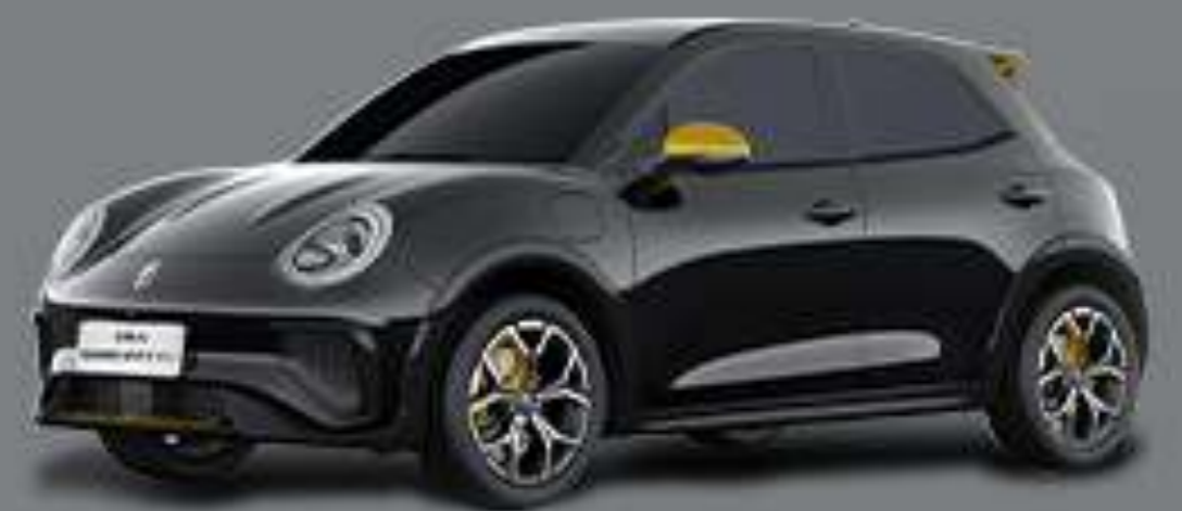
สี Sun Black