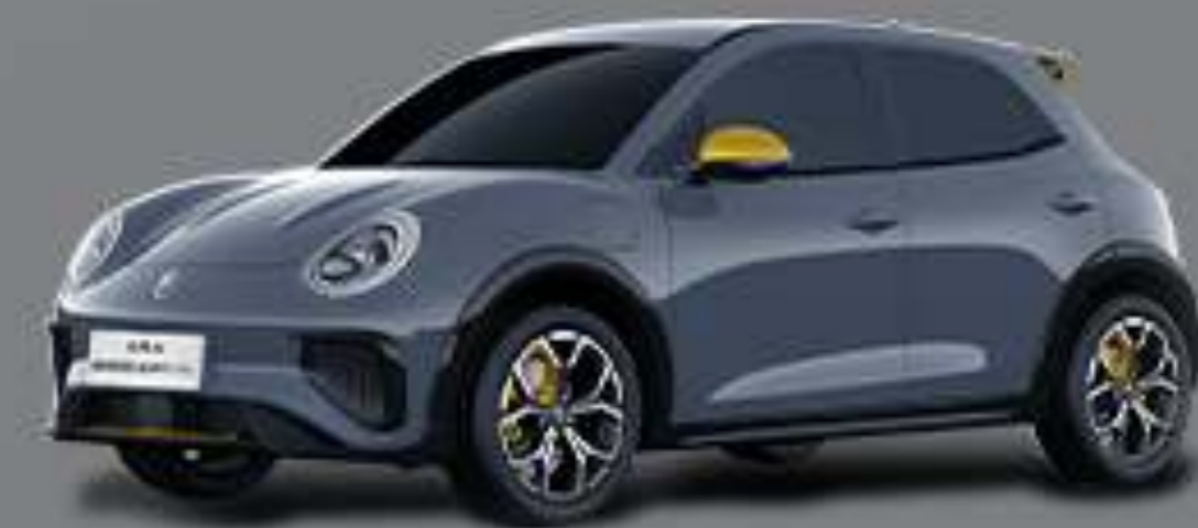
สี Aqua Grey