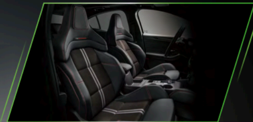
FORD PERFORMANCE 性能跑車電動座椅 (14 向調整 / 座椅加熱功能)

全新世代科技性能座艙設計，搭載 FORD PERFORMANCE 性能跑車電動座椅，榮獲德國背脊健康組織 (AGR) 認證，在享受性能駕馭的同時，也能擁有細膩舒適的乘坐感受。座艙科技升級搭載全新世代無線連接技術 13.2 吋 SYNC®4 娛樂通訊整合系統，以最先進的人性化數位技術，輕鬆掌握整體駕駛資訊，這，就是新世代的座艙魅力！