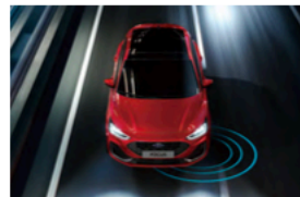
BSA 視覺盲點偵測與輔助系統