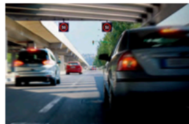
ISA 智慧型速限輔助系統 TSR 道路標誌識別輔助系統