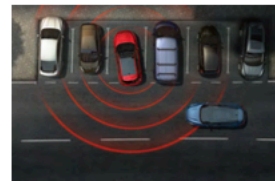
CTA 倒車警示與輔助煞停系統

*SYNC®4 娛樂通訊整合系統功能所提供的各項內容，可能依你使用的手機型號、作業系統版本及所在的國家/地區不同而受限，詳細說明請參照各項功能手冊。*原廠中文衛星導航系統為 SYNC®4 內建導航系統，詳情請參見車主手冊。*Android Auto™ 與大部分搭載 Android 5.0 以上之裝置相容，建議至 Google Play 下載 Android Auto™ 最新版本。*Apple CarPlay® 需搭載 iOS 7.1 以上之 iPhone 機型，建議更新至最新 iOS 版本。*Apple CarPlay® 為 Apple Inc. 的商標。*Apple CarPlay® 與 Android Auto™ 啟動時，會停用部分 SYNC®4 娛樂通訊整合系統功能。*Ford Co-Pilot360™ 全方位智駕科技輔助系統 (Level 2 駕駛輔助系統)，為輔助駕駛科技非全自動駕駛科技，各項功能均有作動條件限制，請勿仰賴此系統取代駕駛判斷，其限制請參見車主手冊。Level 2 駕駛輔助系統係為依據 SAE International 所發布的標準而定，其符合標準功能包含 ACC Stop & Go 全速域定速巡航調節系統及 LCA 車道導正輔助功能。IACC 智慧型定速巡航調節系統與 ACC Stop & Go 結合 LCA 車道導正輔助功能。IACC 智慧型定速巡航調節系統與 ACC Stop & Go 結合 TSR 道路標誌識別輔助系統與導航圖資之系統 (手排車型無 Stop & Go 功能)；系統功能均有作動條件限制，亦有可能出現判斷落差，請勿仰賴此系統取代駕駛判斷，其限制請參見車主手冊。*ACC Stop & Go 全速域定速巡航調節系統及 LCA 車道導正輔助系統：透過系統輔助控制車輛油門、轉向和煞車，並依據前車動態狀況調整駕駛跟車狀態，並使車輛在特定的狀況下保持於車道中線。請勿於包括但不限於以下情境使用：上下高速公路、十字路口、過度彎曲道路、上下坡或滑溜路面等複雜路況或能見度不良時使用該系統，駕駛仍有責任依據實際路況採取不同的駕駛反應。ACC Stop & Go 於作動區域內輔助駕駛定速並跟隨前向動態車流跟車至停 (Stop) 及停車再開 (Go)，其跟車至停功能並非 AEB 功能，駕駛務必依據需求踩踏煞車。LCA 輔助功能必須啟動 ACC Stop & Go 功能後才可開啟。LCA 輔助功能於無道路標線/過度彎曲道路/陡坡/過寬或過窄的道路等特殊路況下，將會影響其作動狀態，駕駛仍有責任依據實際路況採取不同的駕駛反應。*AEB 於偵測區域範圍內輔助煞車力減緩碰撞傷害，並非完全避免所有碰撞，複雜路段、胎面型式、急加速、速差等變因將影響煞車力道。十字路口無序輔助系統，僅能偵測車輛，不得為車、車、大貨車或特殊車輛可能至過寬、過寬、形體不規則，讓系統無法判斷無法作動系統。若對向車輛行駛速度大於 50km/h 或行駛速度高於 30km/h 時，系統將無法作動，駕駛仍須與前車與車保持適當距離，切勿依賴系統取代人為判斷。*手排車型無搭載 Stop & Go 功能，其定速巡航系統需於時速 30km/h 以上啟用且檔位不得置於一檔。當系統判斷需升降檔時，將會透過檔位指示燈提示駕駛者。*此為展示車型，外觀樣式及內裝配備與實際上市車型有所差異，請以實際販售之車型及規格配置表為準。