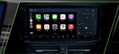
13.2 吋 SYNC®4 娛樂通訊整合系統內建原廠導航 (支援無線 Apple CarPlay® 與 Android Auto™)