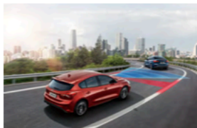
IACC 智慧型定速巡航調節系統 (附低速跟車) LCA 車道導正輔助系統

NEW FOCUS ST X 採用最新升級的 Ford Co-Pilot360™ 全方位智駕科技輔助系統，整合多項傲視同級的駕駛輔助科技，打造前向、側邊、後向全方位智能安全。全新導入的進階駕駛輔助科技，替已臻頂尖的主動安全，強上加強，打造最稱心的行駛路程，和最雄心的熱血里程。