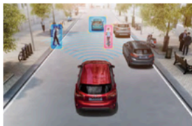
PCA 前向碰撞預警系統 (附 AEB 全速域輔助煞停系統)