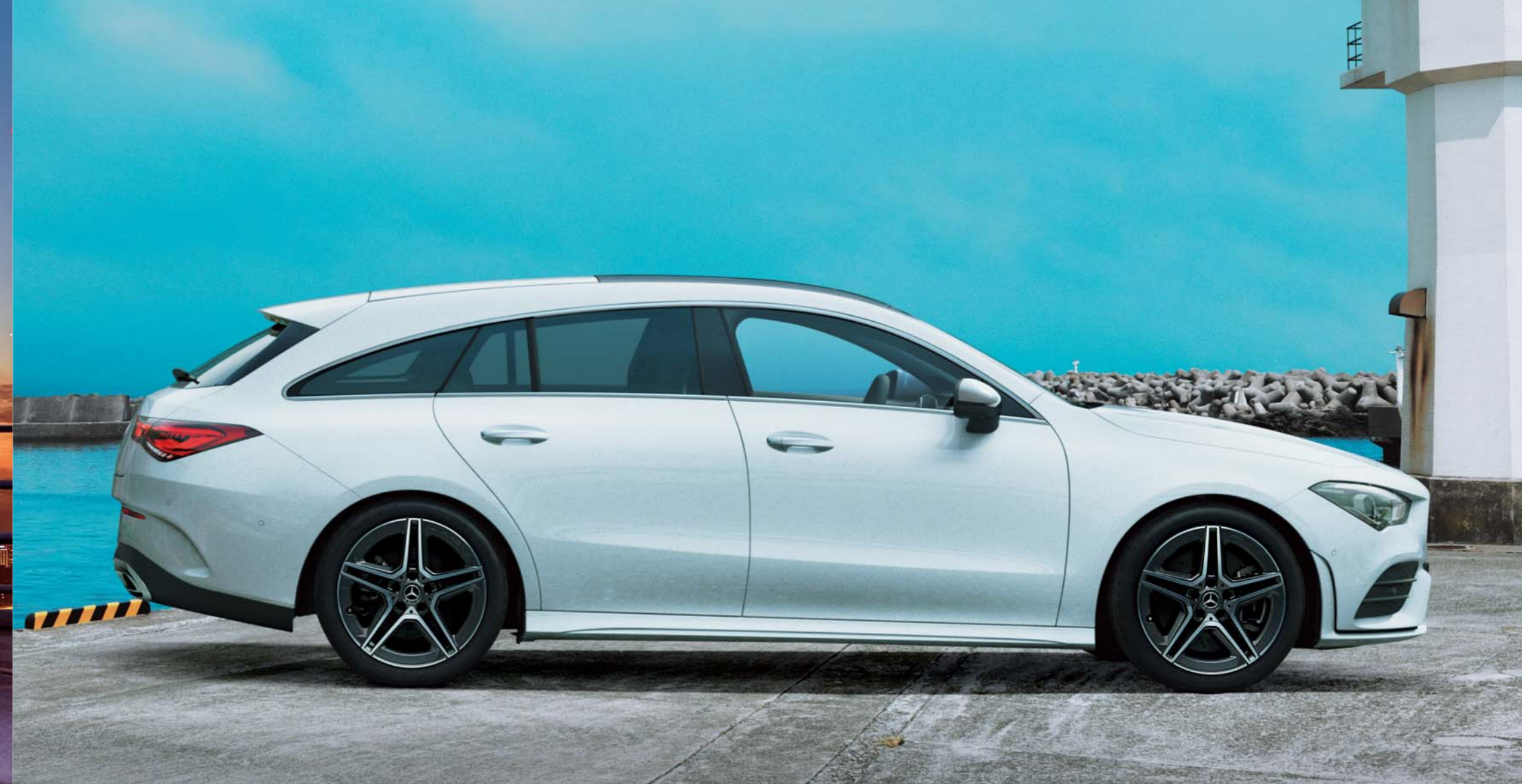
CLA 200 d Shooting Brake

ボディカラー:ポーラーホワイト(ソリッドペイント) 主要オプション:AMGラインパッケージ(有償オプション)、パノラミックスライディングルーフ(有償オプション)