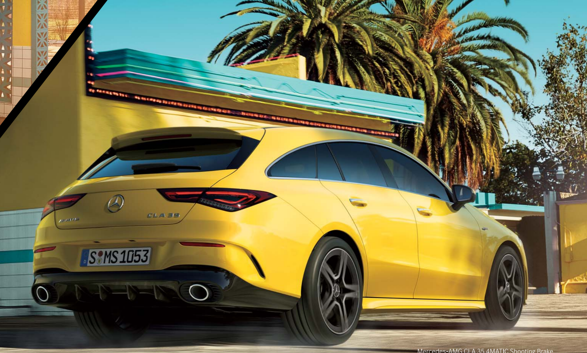
Mercedes-AMG CLA 35 4MATIC Shooting Brake ボディカラーサンイエロー(ソリッドペイント) (有償オプション) 主要オプションパノラミックスライディングルーフ (有償オプション)

※日本仕様のハンドル位置は右ハンドルとなります。写真の仕様・装備は、日本仕様と異なる場合があります。また、半導体供給不足に伴う生産制約によって、仕様・装備・メーカー希望小売価格が変更になる場合があります。選択できるオプションにつきましては、事前にメルセデス・ベンツ正規販売店にお問い合わせください。