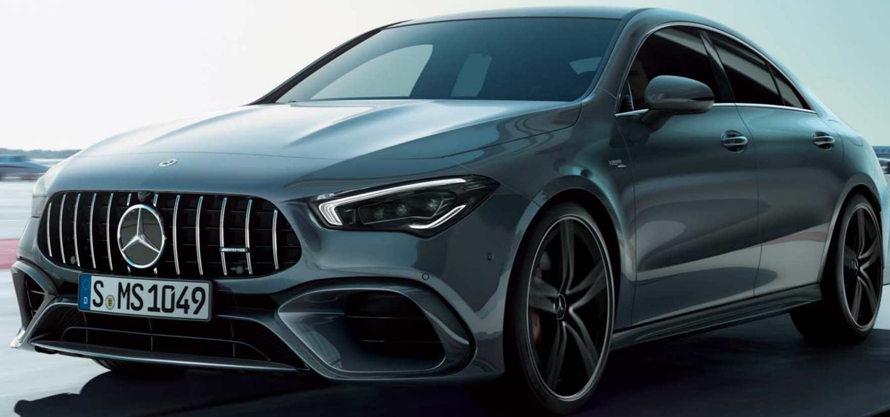
Mercedes-AMG CLA 45 S 4MATIC+

ボディカラー:マウンテングレー(メタリックペイント) 主要オプション:アドバンスドパッケージ(有償オプション)