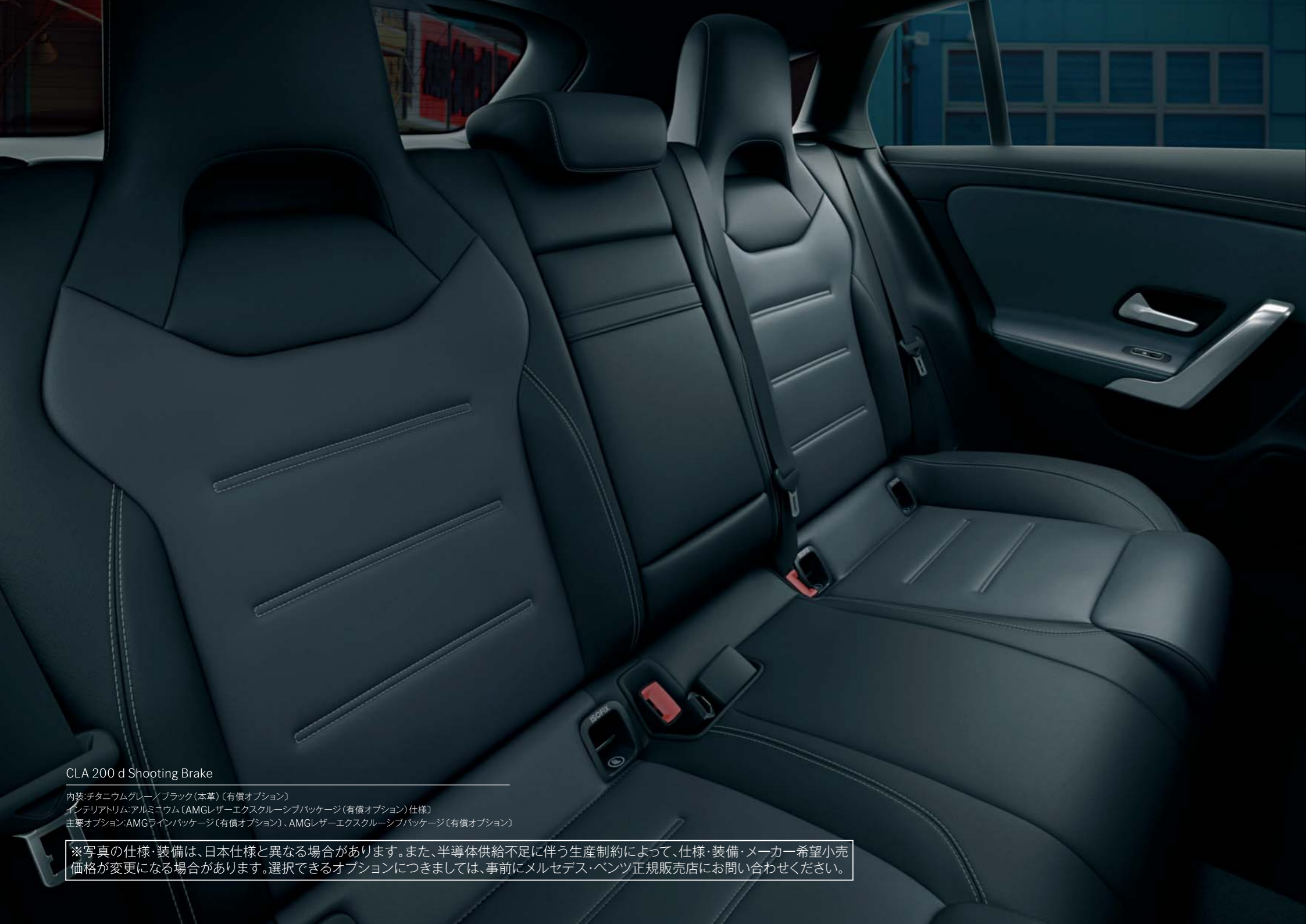
CLA 200 d Shooting Brake

内装:チタニウムグレー/ブラック(本革) (有償オプション) インテリアトリム:アルミニウム (AMGレザーエクスクルーシブパッケージ (有償オプション) 仕様) 主要オプション:AMGラインパッケージ (有償オプション)、AMGレザーエクスクルーシブパッケージ (有償オプション)