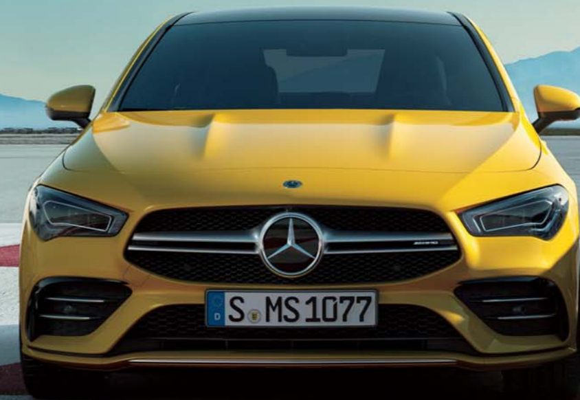
Mercedes-AMG CLA 35 4MATIC

ボディカラー:サンイエロー(ソリッドペイント)(有償オプション) 主要オプション:アドバンスドパッケージ(有償オプション)、パノラミックスライディングルーフ(有償オプション)