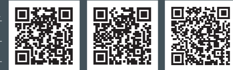
公式サイト データインフォメーション 見積シミュレーション

CLA シューティングブレーク Mercedes-AMGモデルの詳細は、全てWebサイトでご覧いただけます。