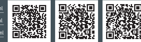
公式サイト データインフォメーション 見積シミュレーション