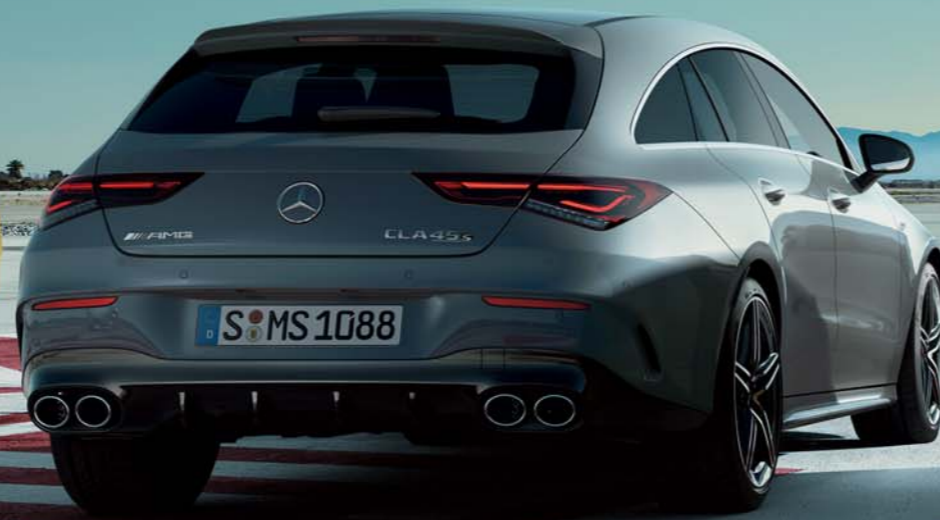
Mercedes-AMG CLA 45 S 4MATIC+ Shooting Brake

ボディカラー:サンイエロー(ソリッドペイント)(有償オプション) 主要オプション:パノラミックスライディングルーフ(有償オプション)