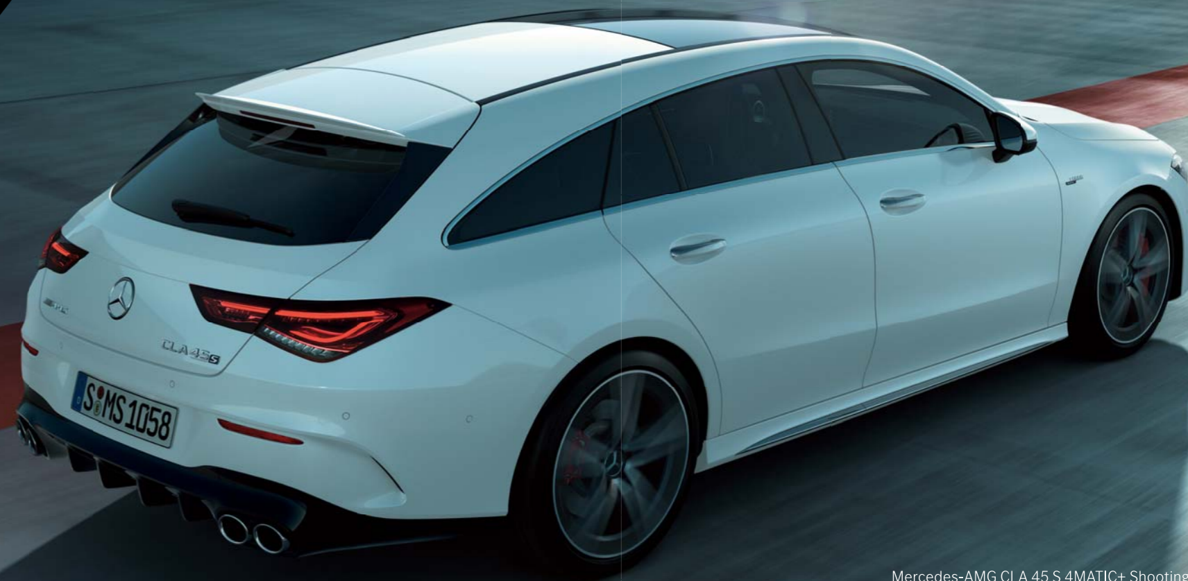
Mercedes-AMG CLA 45 S 4MATIC+ Shooting Brake

ボディカラー:ポーラーホワイト(ソリッドペイント) 主要オプション:パノラミックスライディングルーフ(有償オプション)