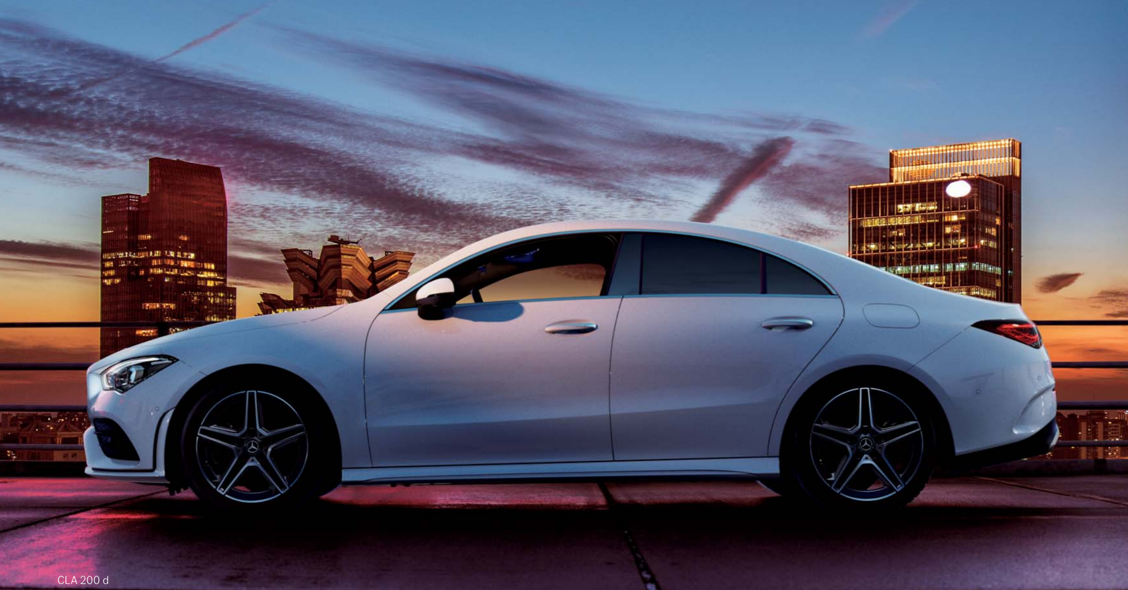
CLA 200 d

ボディカラー:ポーラーホワイト(ソリッドペイント) 主要オプション:AMGラインパッケージ(有償オプション)