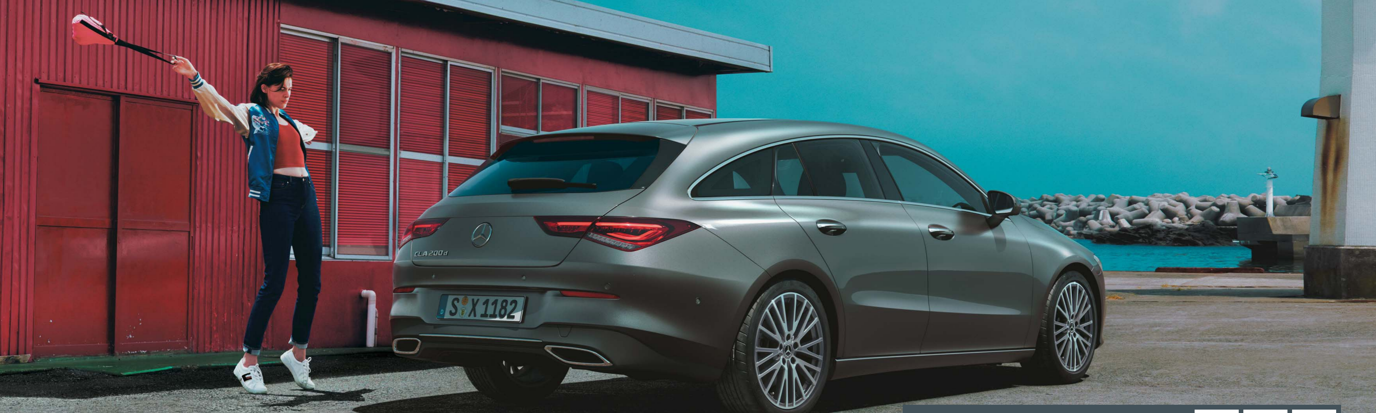
CLA 200 d Shooting Brake