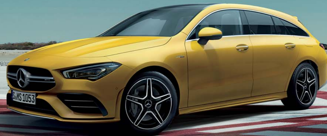
Mercedes-AMG CLA 35 4MATIC Shooting Brake

ボディカラー:サンイエロー(ソリッドペイント)(有償オプション) 主要オプション:パノラミックスライディングルーフ(有償オプション)