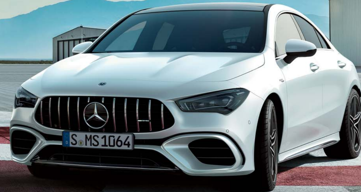
Mercedes-AMG CLA 45 S 4MATIC+

ボディカラー:サンイエロー(ソリッドペイント)(有償オプション) 主要オプション:アドバンスドパッケージ(有償オプション)、パノラミックスライディングルーフ(有償オプション)