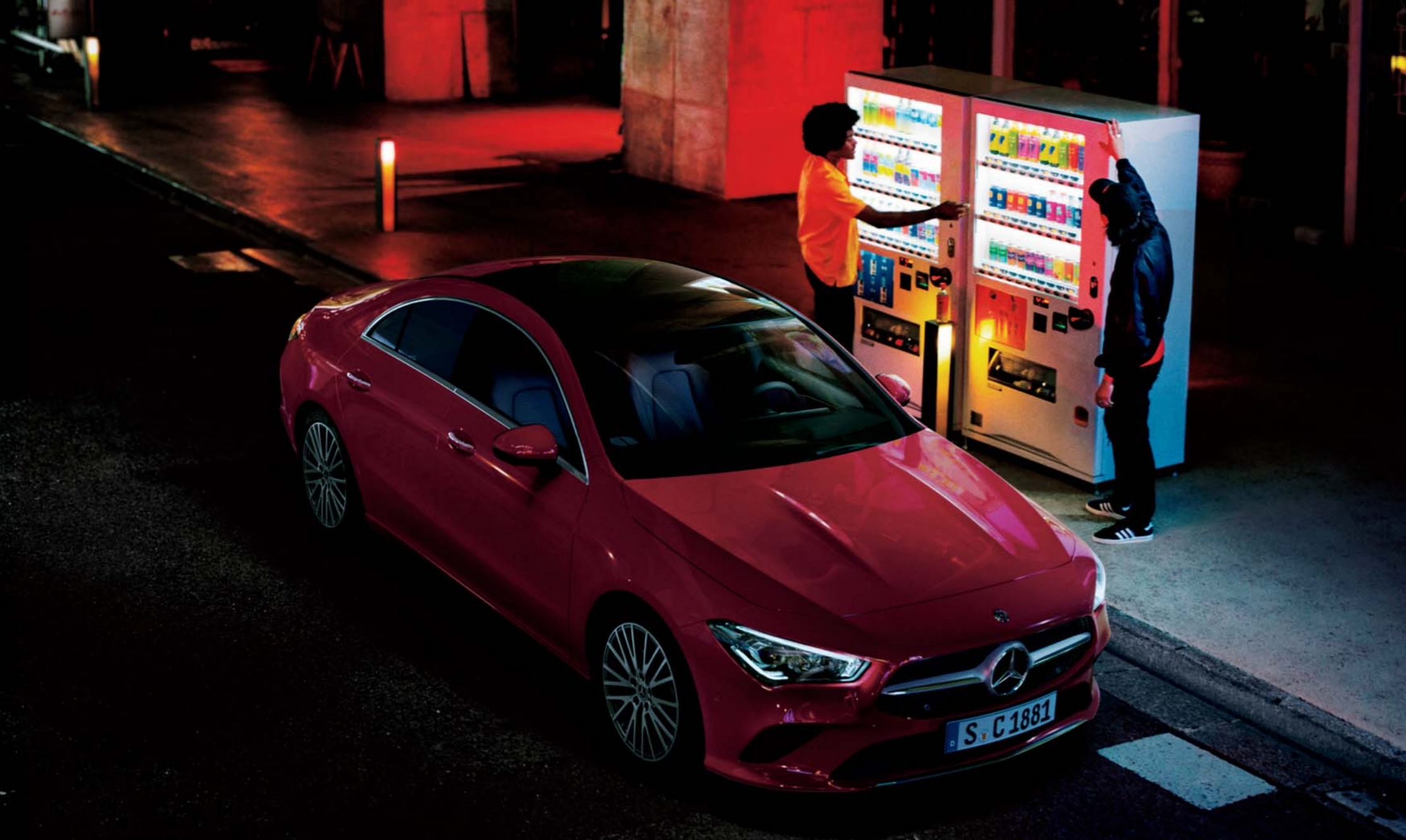
CLA 200 d

ボディカラー:パタゴニアレッド(メタリックペイント)〔有償オプション〕 主要オプション:パノラミックスライディングルーフ〔有償オプション〕