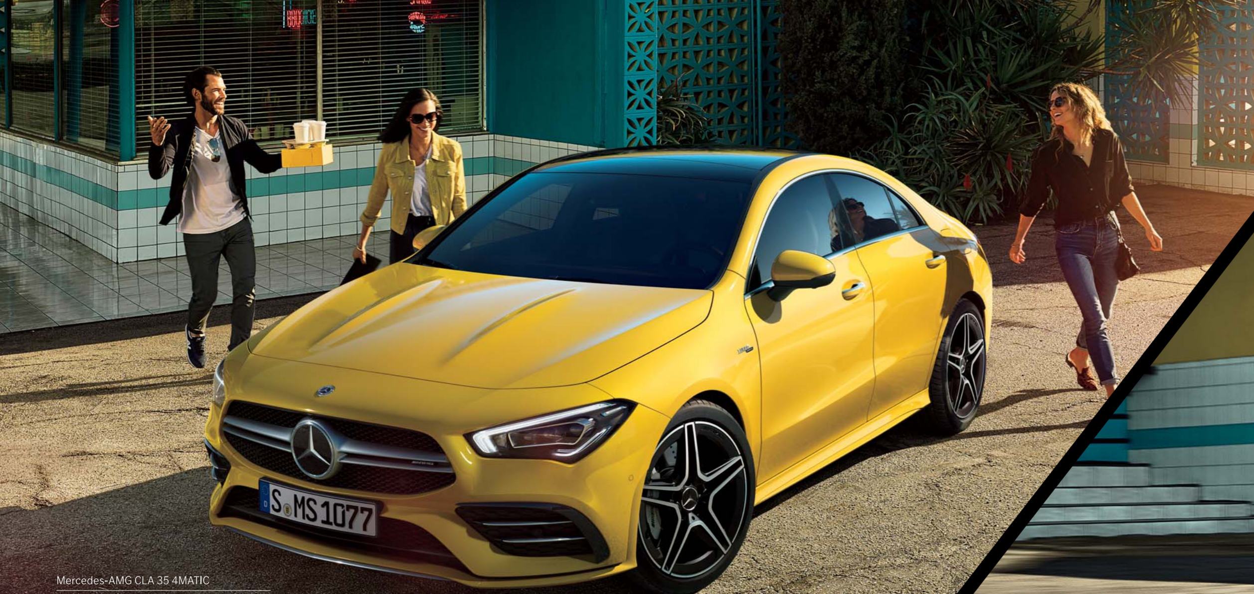
Mercedes-AMG CLA 35 4MATIC ボディカラーサンイエロー(ソリッドペイント) (有償オプション) 主要オプションアドバンスパッケージ (有償オプション) パノラミックスライディングルーフ (有償オプション)