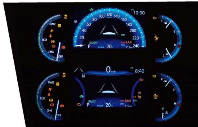
|| 數位式儀錶板附7吋MID (HYBRID車型、GR SPORT車型、汽油旗艦)