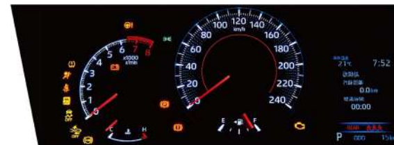
|| 高反差雙環式儀錶板附4.2吋MID (汽油尊爵、汽油豪華、汽油經典)