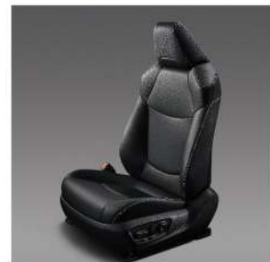
電動8向調整駕駛座椅附電動腰靠 (HYBRID旗艦、汽油旗艦)