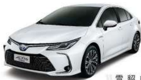
|| 雪 韶 白 (040)