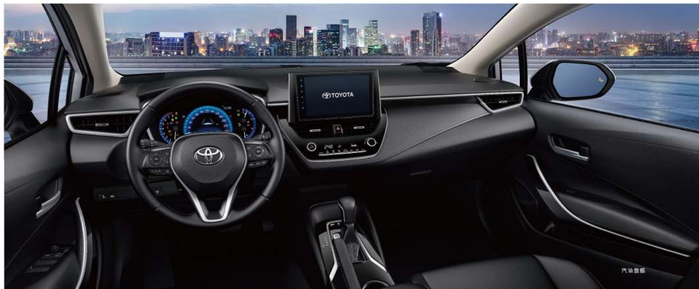
TOYOTA Drive+ Connect 智聯車載系統 4G旗艦版四大核心功能 (TOYOTA正廠選配用品)