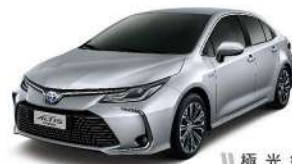
|| 極 光 銀 (1F7)