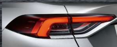
|| LED光條式尾燈 (HYBRID車型、GR SPORT車型、汽油旗艦)