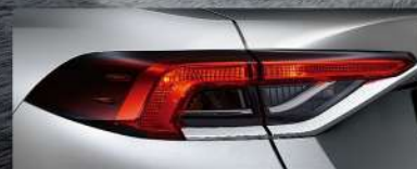
|| LED尾燈 (汽油尊爵、汽油豪華、汽油經典)