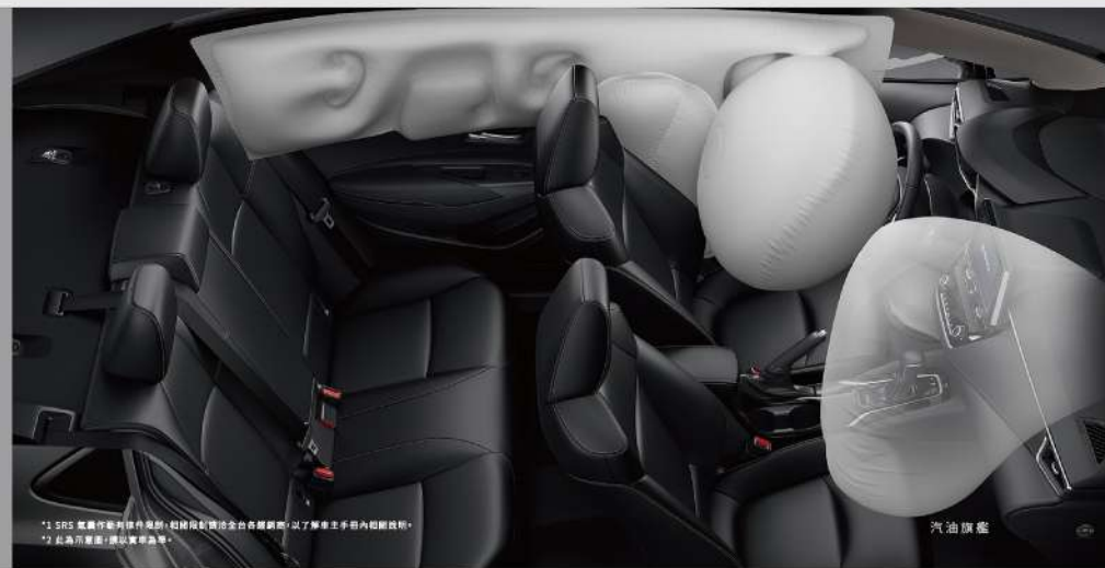
*1 SRS 氣囊作動條件複雜，包括偵測偵測全車各種訊號，以了解車主手冊內相關說明。 *2 此為示意圖，請以實際為準。