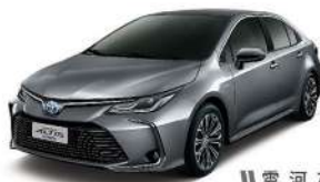
|| 雲 河 灰 (1G3)