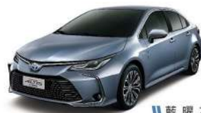
|| 藍 曜 灰 (1K3)