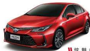
|| 炫 魅 紅 (3R3)