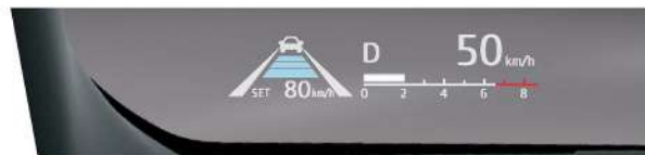
|| 全彩HUD抬頭顯示器 (HYBRID旗艦)