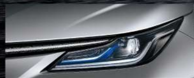
|| LED Bi-Beam投射式頭燈* (HYBRID旗艦、GR SPORT車型、汽油旗艦專屬選配套件)