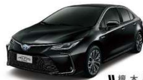
|| 檀 木 黑 (209)