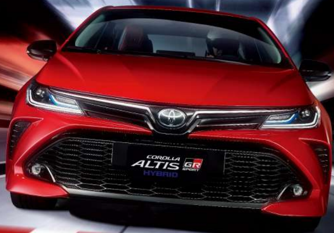
GR SPORT HYBRID

GR SPORT 高性能車款，旨在提升駕駛樂趣 從專屬外觀、內裝設計到汲取賽道經驗精準調校的懸吊系統 由內到外的熱血跑格，釋放挑戰極限的靈魂！