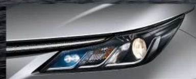
|| 鹵素Bi-Beam投射式頭燈* (HYBRID尊爵、汽油旗艦、汽油尊爵、汽油豪華、汽油經典)