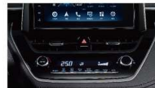
S-FLOW 智慧型恆溫空調系統 (HYBRID車型、GR SPORT車型、汽油旗艦、汽油尊爵、汽油豪華)