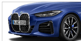
430i M Sport