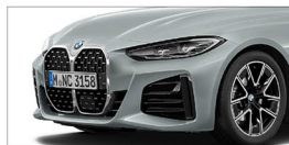
420i M Sport