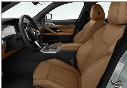
Sensatec 透氣皮質 / 跑車座椅 420i M Sport