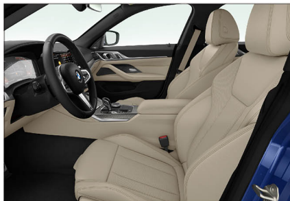
Sensatec 透氣皮質 / 跑車座椅 430i M Sport