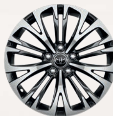
Jantes alliage 18" métal (10 doubles-branches) Yaris Cross Collection