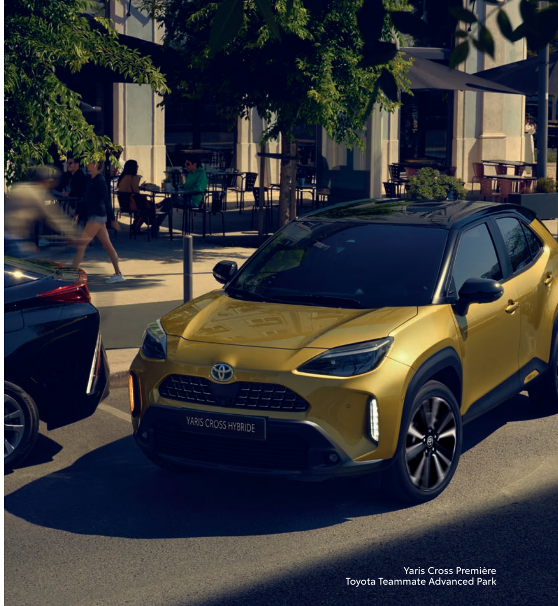
Yaris Cross Première Toyota Teammate Advanced Park