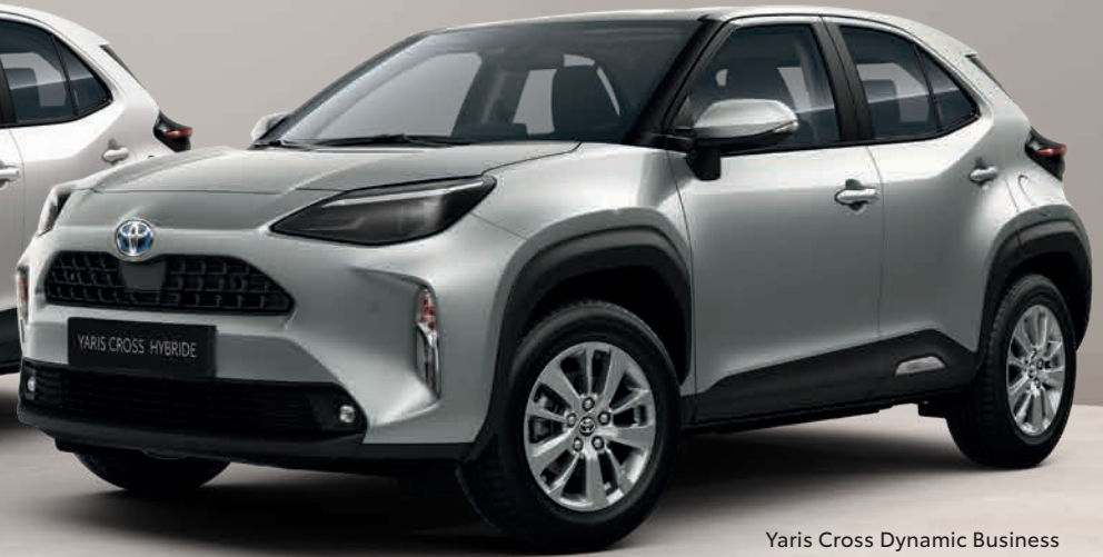
Yaris Cross Dynamic Business