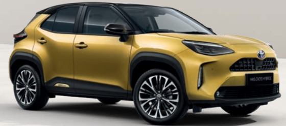
Yaris Cross Collection Or Pur