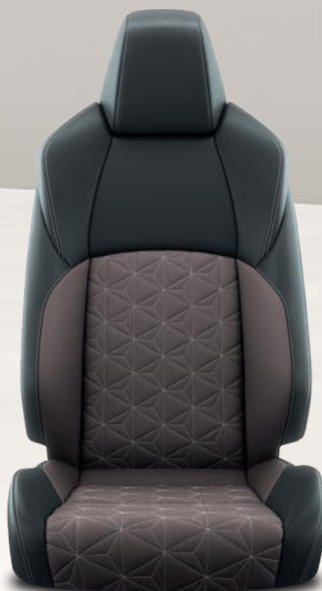
Yaris Cross Collection Sièges avant chauffants