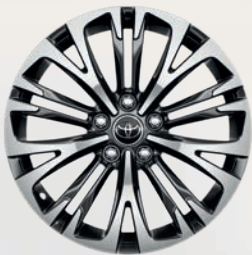
Jantes alliage 18" métal (10 doubles-branches)