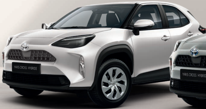
Yaris Cross Dynamic