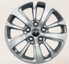
Jantes alliage 16" DYNAMIC BUSINESS