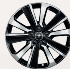
Jantes alliage 18" bi-ton noir et métal Yaris Cross Première