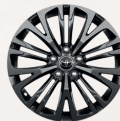
Jantes alliage 18" noires (10 doubles-branches) Yaris Cross Trail