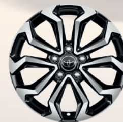
Jantes alliage 17" (5 doubles-branches)