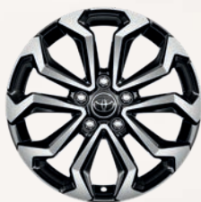
Jantes alliage 17" (5 doubles-branches) Yaris Cross Design