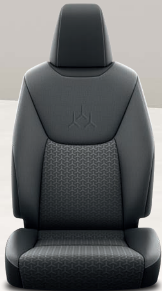
Yaris Cross Dynamic Yaris Cross Dynamic Business Yaris Cross Design