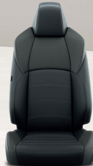
Yaris Cross Première Sièges avant chauffants