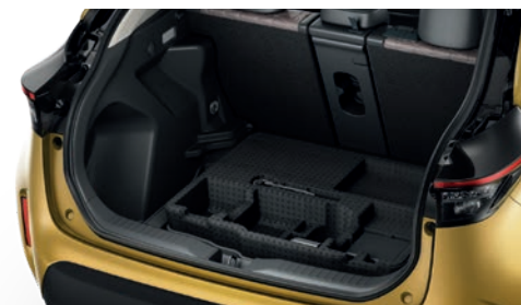
MODULE DE RANGEMENT

(Disponible uniquement pour les versions AWD-i).