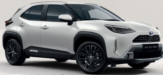
Yaris Cross Trail Blanc Lunaire nacré