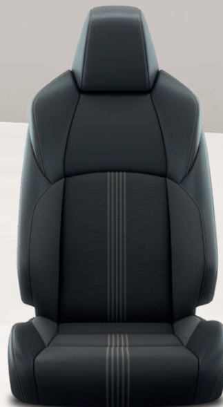
Yaris Cross Trail Sièges avant chauffants