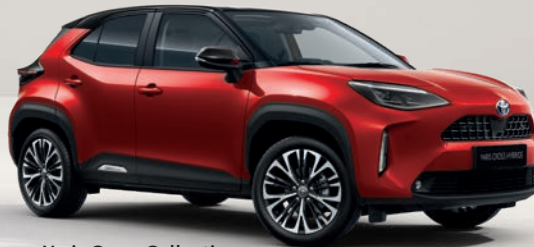
Yaris Cross Collection Rouge Intense