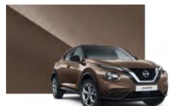
皇家咖 CAN 接訂生產

J-Package 專屬套件係指 J-Box 享樂套件(僅駕趣享樂版)與 J-Luxury 奢華套件(僅駕趣享樂版可加價升級)，詳細套件內含配備請詳見規配表。龐德黑、皇家咖屬於接訂生產車色，皆需等候 6 個月交車。廣告用車非台灣仕様，實際車型配備及車色以實車為準。