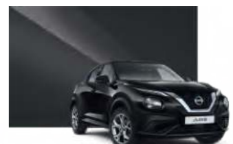
龐德黑 Z11 接訂生產