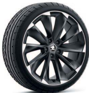
19" SUPERNOVA sort aluminiumsfelg*