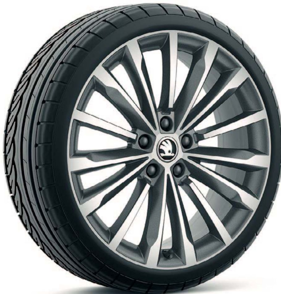
19" TRINITY antracit aluminiumsfelg