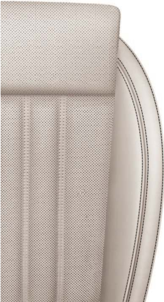
Style/Laurin & Klement beige (perforet skinn/kunstskinn), ventilerte seter foran