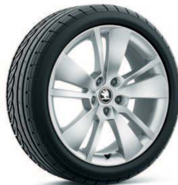
18" ZENITH aluminiumsfelg