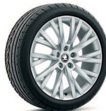
18" ANTARES aluminiumsfelg