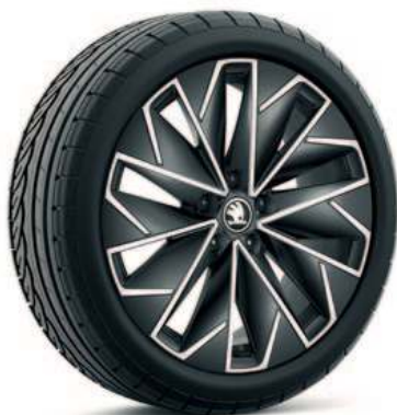
18" PROPUS Aero sort aluminiumsfelg