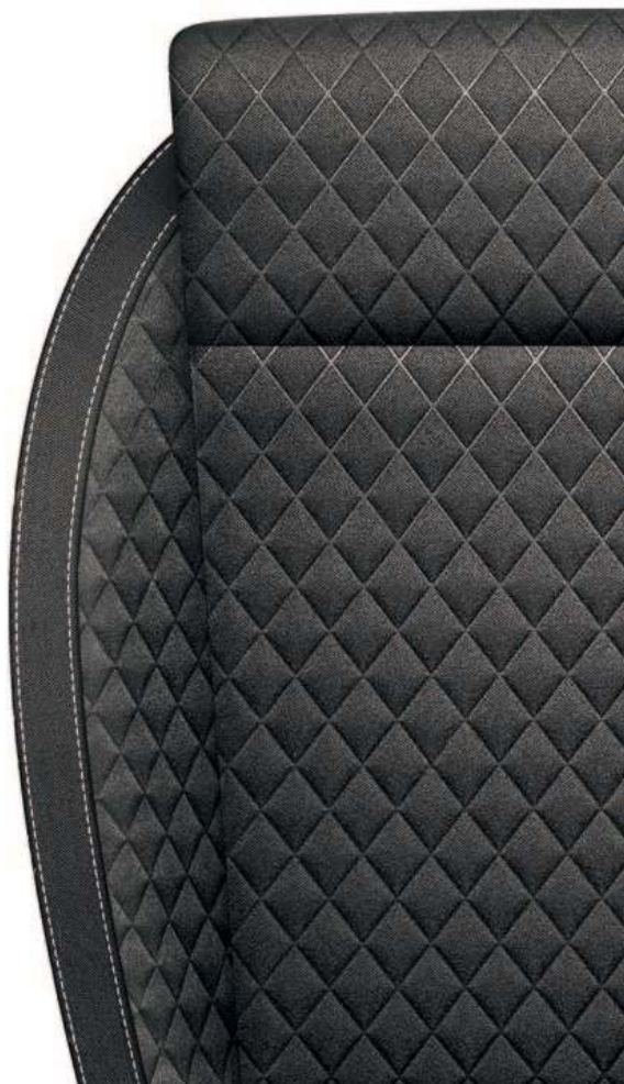
Ambition sort (stoff)