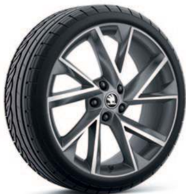
19" VEGA antrasitt aluminiumsfelg*