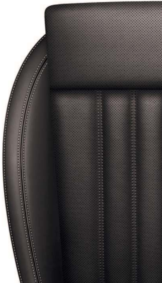
Laurin & Klement brun (perforet skinn/kunstskinn), ventilerte seter foran