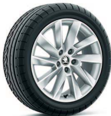
17" STRATOS aluminiumsfelg