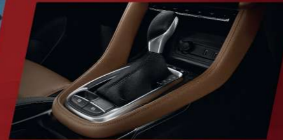
ระบบเกียร์อัตโนมัติแบบ CVT 8 SPEEDS