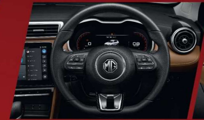
พวงมาลัย MULTI-FUNCTION และหน้าจอแสดงผลอัจฉริยะขนาด 7 นิ้ว