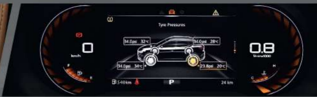
ระบบตรวจสอบความผิดปกติของลมยาง TPMS