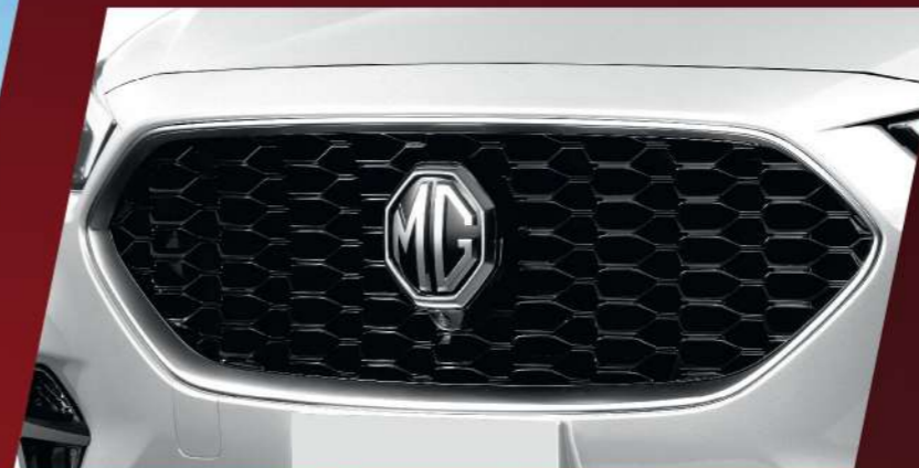
กระจหน้าดีไซน์สปอร์ต

ชั้นกว่าของดีไซน์ล้ำสไตล์อังกฤษ โฉบเฉี่ยว สะท้อนตัวตนกับภาพลักษณ์ในการใช้ชีวิตที่เป็นตัวของตัวเอง NEW MG ZS โดดเด่นในทุกเส้นทาง ด้วยกระจหน้าดีไซน์ใหม่ มาพร้อมการออกแบบเส้นสายที่มีเอกลักษณ์ด้านข้างแบบ BRITISH SHOULDER LINE อัพเกรดความสามารถไปอีกขั้นด้วยไฟหน้าเปิด - ปิดอัตโนมัติที่มาพร้อม DAYTIME RUNNING LIGHTS โดดเด่น แม้ในตอนกลางวัน ไฟท้ายใหม่ดีไซน์สมาร์ทยิ่งขึ้น พร้อมล้ออัลลอยด์ดีไซน์สปอร์ตใหม่ขนาด 17 นิ้ว NEW MG ZS คือนิยามใหม่แห่งสมาร์ต ดีไซน์ที่ตอบทุกชีวิตสมาร์ต ทุกไลฟ์สไตล์อย่างแท้จริง