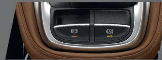
ระบบเบรกมือไฟฟ้า EPB และระบบป้องกันการไหลของรถโดยอัตโนมัติ AVH