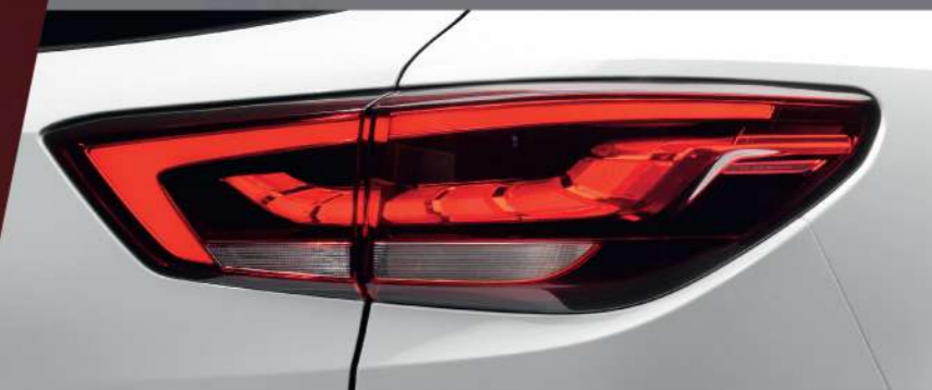
ไฟท้ายแบบ LED