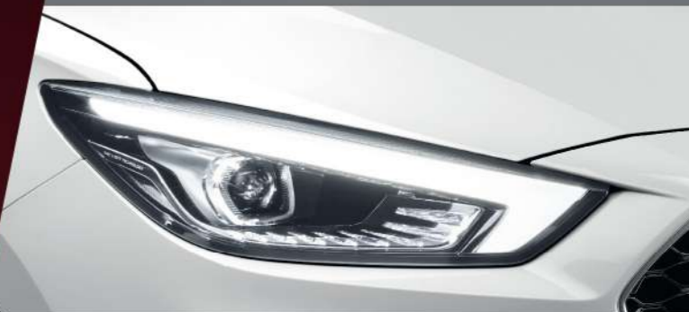
ไฟหน้าแบบ LED PROJECTOR