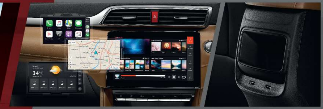
ระบบ ENTERTAINMENT เชื่อมต่อกับจอ TOUCHSCREEN