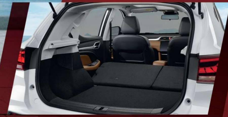
เบาะที่นั่งด้านหลังพับได้แบบ 60:40 เพิ่มพื้นที่เก็บสัมภาระ