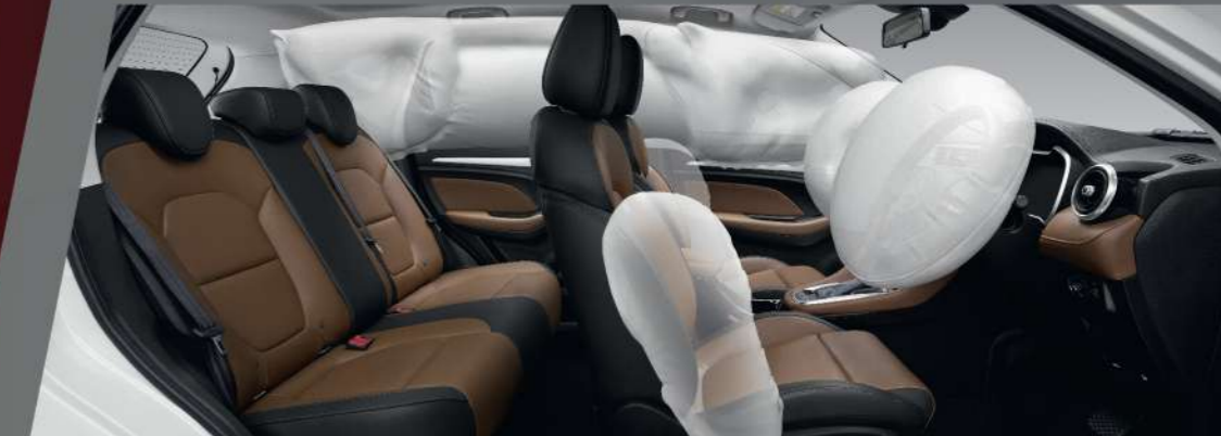
ถุงลมนิรภัย 6 จุด คู่หน้า ด้านข้าง และน่านถุงลมนิรภัย