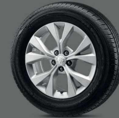
ล้ออัลลอยด์ 16 นิ้ว