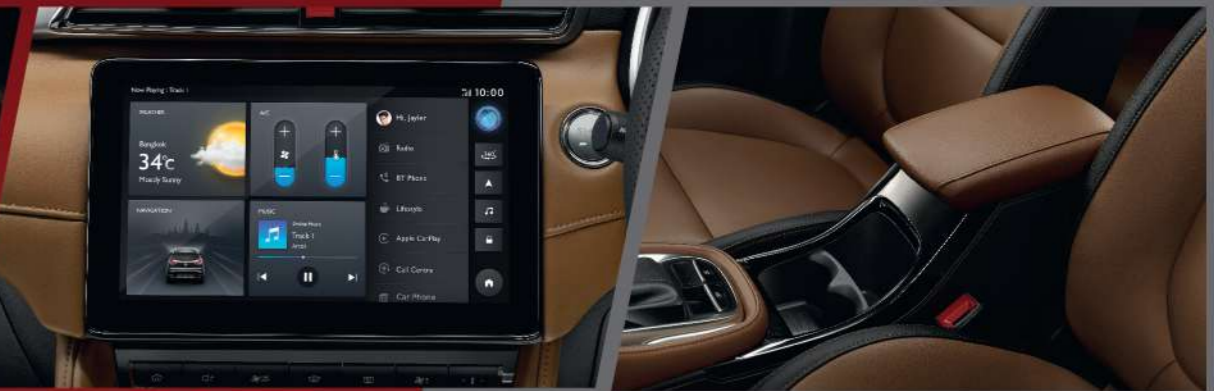
จอ TOUCHSCREEN ขนาด 10 นิ้ว