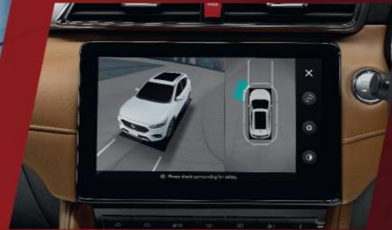
AROUND VIEW MONITOR

ด้วยเครื่องยนต์ 1.5 ลิตร 114 แรงม้า ที่ผสานการทำงานอย่างลงตัวกับเกียร์ CVT ใหม่ ที่มอบประสบการณ์การขับขี่ที่ดีกว่าเดิม ทรงตัวดีเยี่ยม กับช่วงล่าง EURO TUNING SUSPENSION พร้อมถุงลมนิรภัย 6 จุด และระบบความปลอดภัยมาตรฐานยุโรป SYNCHRONIZED PROTECTION SYSTEM มอบความมั่นใจไปอีกขั้นกับกล้อง 360 องศา แสดงผลแบบ 3D มิติใหม่แห่งความปลอดภัย ให้คุณไม่พลาดทุกมุมมอง รอบด้าน NEW MG ZS จึงเหมาะกับทุกการขับขี่ ทุกเส้นทางของคุณเหนือกว่าใคร