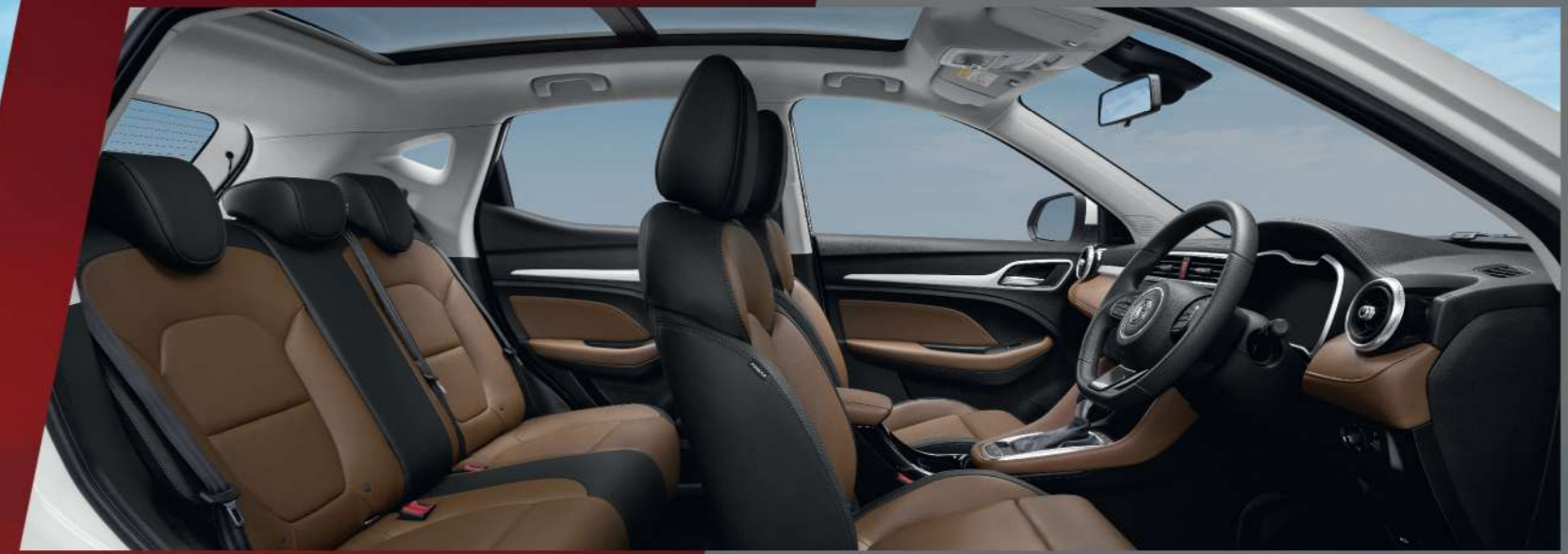
ห้องโดยสารกว้างขวาง นั่งสบาย