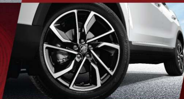
ล้ออัลลอยด์ดีไซน์สปอร์ตขนาด 17 นิ้ว