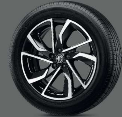
ล้ออัลลอยด์ 17 นิ้ว