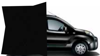
632 ČERNÁ ROCKABILLY