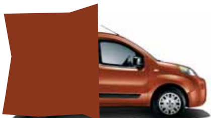
112 ORANŽOVÁ ARAGOSTA