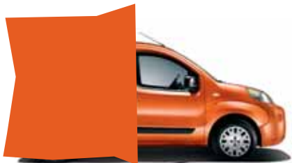
551 ORANŽOVÁ CARIBBEAN