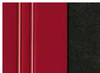
220 ČERVENÁ AXELL