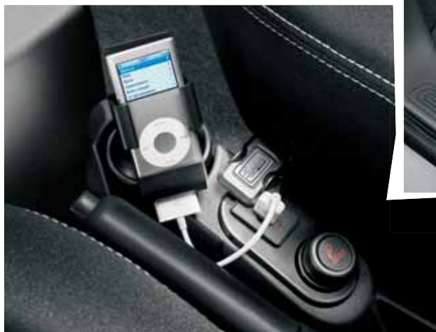
S držákem na iPod® je váš přehrávač uložen šikovně a bezpečně.