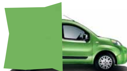
355 ZELENÁ CLOVER