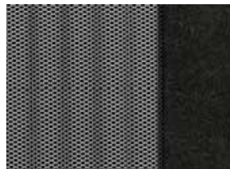
372 ŠEDÁ SAIL