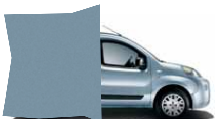
448 AZUROVÁ IDEALISTA