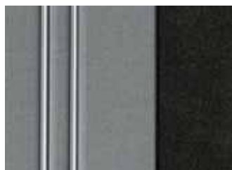
288 ŠEDÁ AXELL