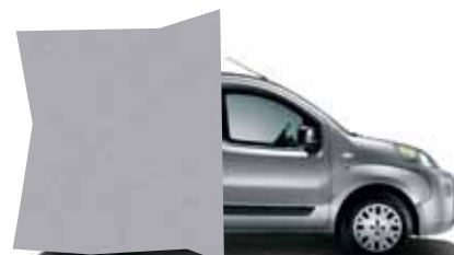
612 ŠEDÁ MINIMAL