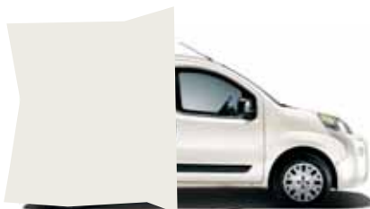
249 BÍLÁ AMBIENT