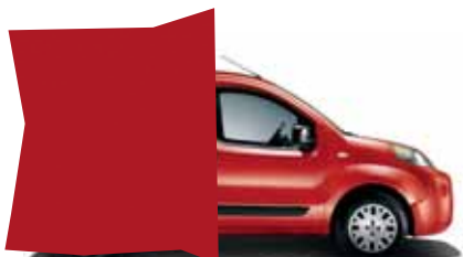
168 ČERVENÁ PIMPANTE