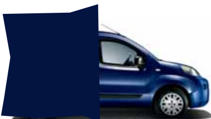
487 MODRÁ NOTTURNO