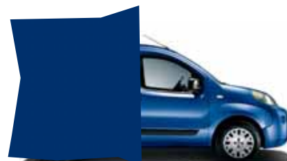
479 MODRÁ LINE