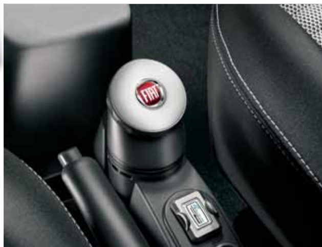
Osvěžovač vzduchu nabízí široký výběr vůní.