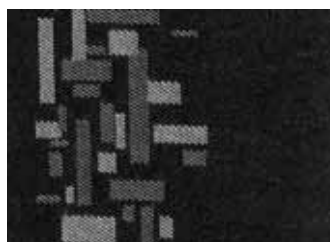
217 ČERNÁ TANGRAM