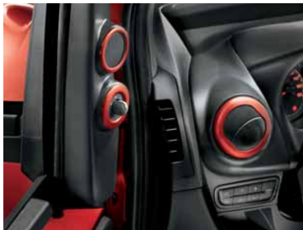
Prvky interiéru sladěné s barvou karoserie.

Zvolte si z nabídky originálních prvků výbavy, jako jsou rámečky v barvě karoserie, koberečky s vyšitým logem, prahové hliníkové lišty, držák na iPod®, originální osvěžovač vzduchu atd. Pro váš volný čas je tu navíc příčný střešní nosník s nosiči lyží, jízdních kol nebo surfového prkna.