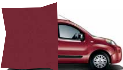
293 ČERVENÁ FLAMENCO