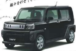
Photo: G, 2WD, ガソリンエンジン、4ドア、5人乗り、メタリック塗装は、Gターボ専用グレードにのみ装着が可能です。ブラックマイカメタリック塗装は、Gターボ専用グレードにのみ装着が可能です。