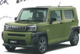
Photo: G, 2WD, ガソリンエンジン、4ドア、5人乗り、メタリック塗装は、Gターボ専用グレードにのみ装着が可能です。ブラックマイカメタリック塗装は、Gターボ専用グレードにのみ装着が可能です。

※Gターボ専用グレードの車種は、ブラックマイカメタリック塗装は、Gターボにのみ装着が可能です。