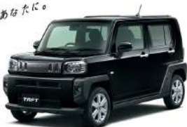
Photo: 2021.11.15 ※カラーはメタリックブルー、 メタリックシルバー、メタリックブラック、 メタリックパールホワイト、 メタリックパールホワイト（パール） （メタリックは別途料金がかかります。）

ダークブラックメッキパック 【GR-10, G11メーカーオプション】 ■ディーラーオプションとしてもおグレードに追加可能です。 詳しくは、近隣の「タフトアクセサリー」までお電話ください。