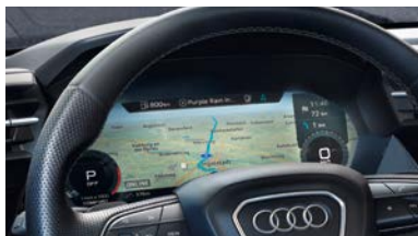
バーチャルコックピットプラス