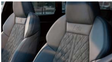
スポーツシート(フロント)／アルカンターラ/アーティフィシャルレザーダイヤモンドステッチング