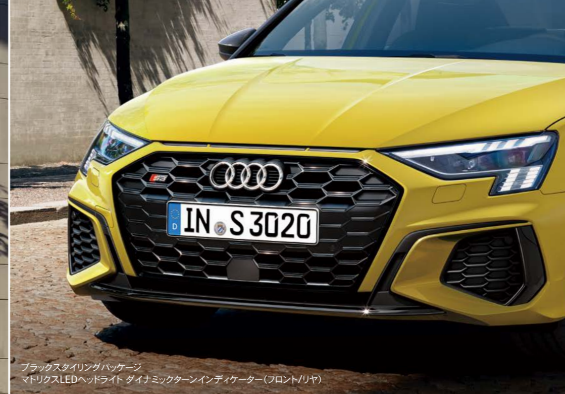
ブラックスタイリングパッケージ マトリクスLEDヘッドライト ダイナミックターンインディケーター（フロント/リヤ）