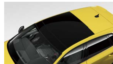
パノラマサンルーフ