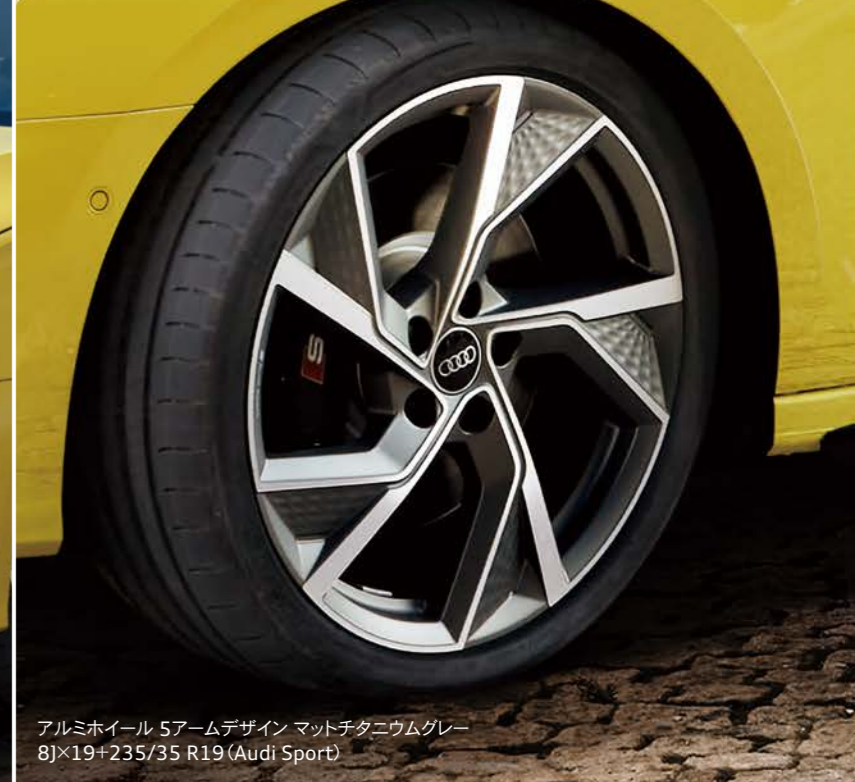
アルミホイール 5アームデザイン マットチタニウムグレー 8J×19+235/35 R19 (Audi Sport)