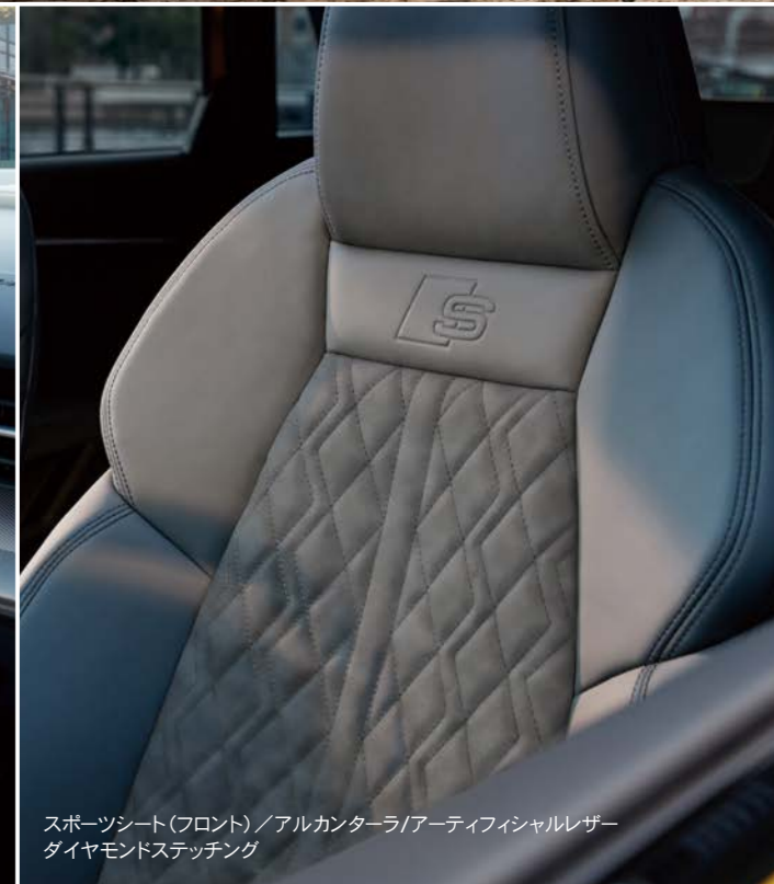
スポーツシート（フロント）/アルカンターラ/アーティフィシャルレザー ダイヤモンドステッチング