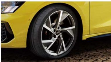
アルミホイール 5アームデザイン マットチタニウムグレー 8J×19+235/35 R19(Audi Sport)