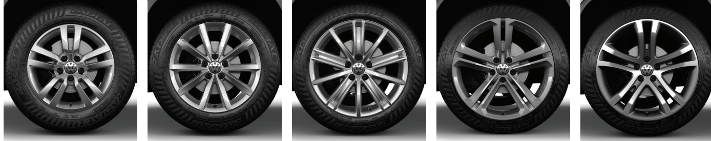
Roues en alliage « Portland » de 16 po TL