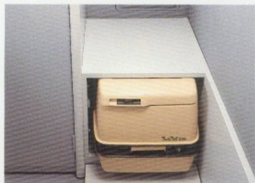
Platz für Chemikalien-toilette.