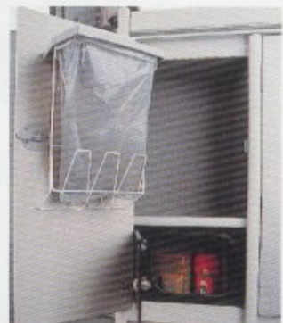
Mülleimer und Wertsachenfach.