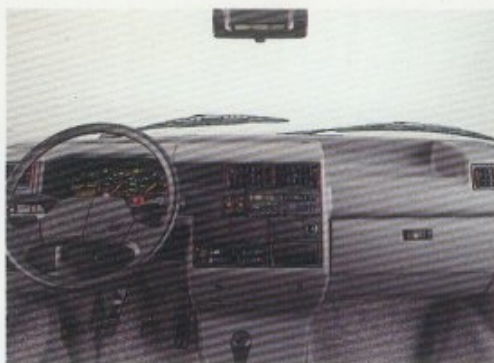
Schalttafel mit übersichtlicher Instrumentierung.

Der neue California Club. Sicher reisen und komfortabel wohnen. Das ist Luxus für unterwegs.