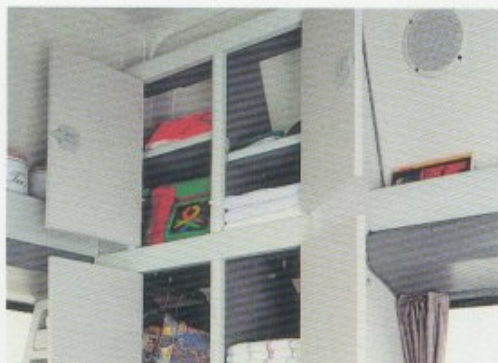
mit viel Stauraum