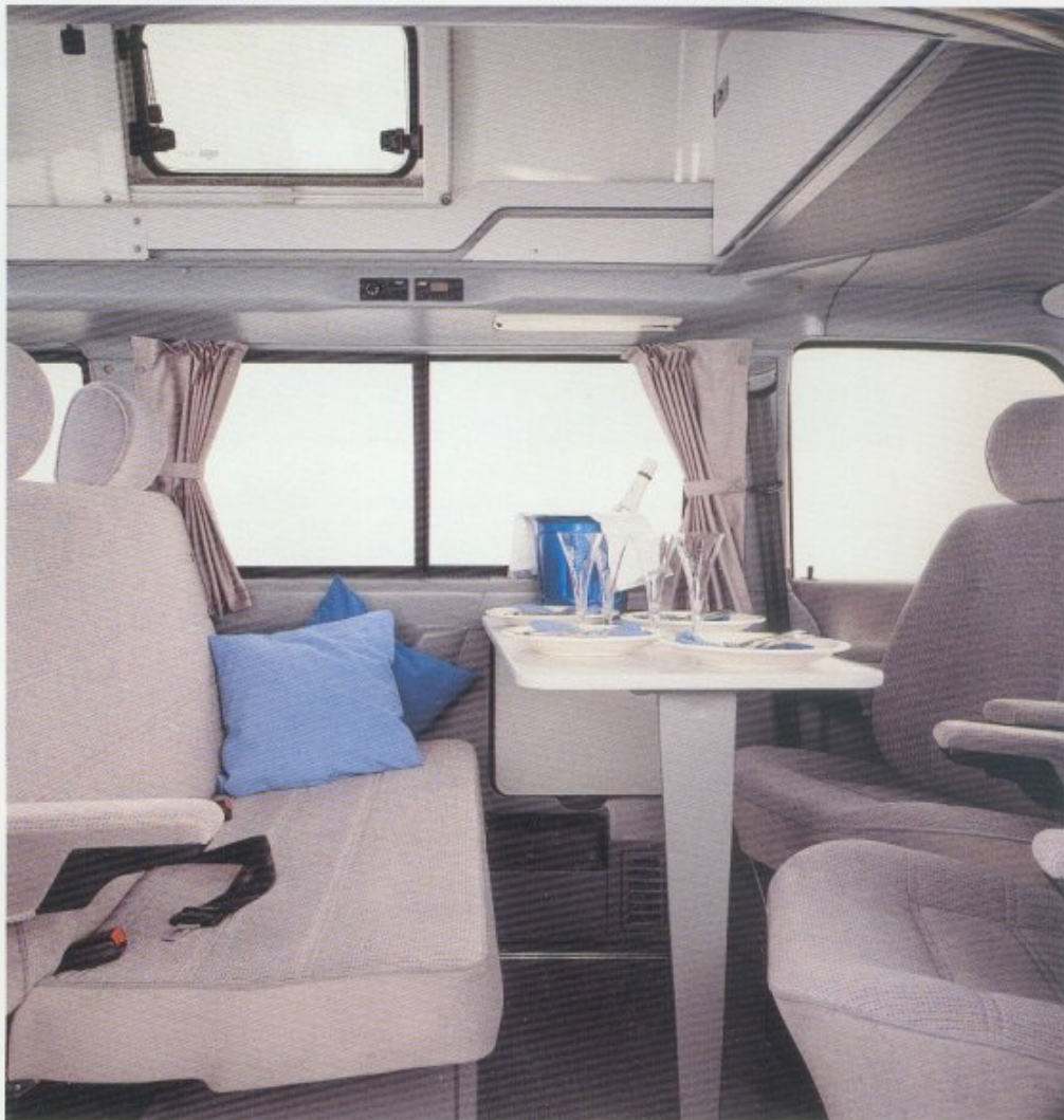
Der gemütliche Wohnraum mit großem Tisch (Kopfstützen Sonderausstattung) ...