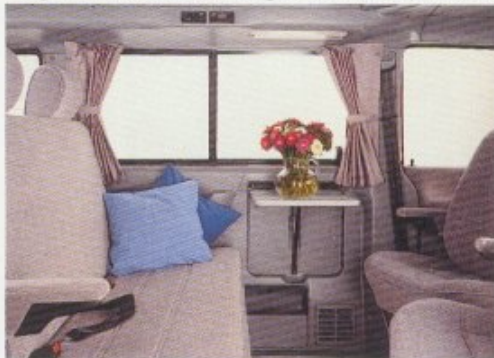
... und mit kleinem Tisch.