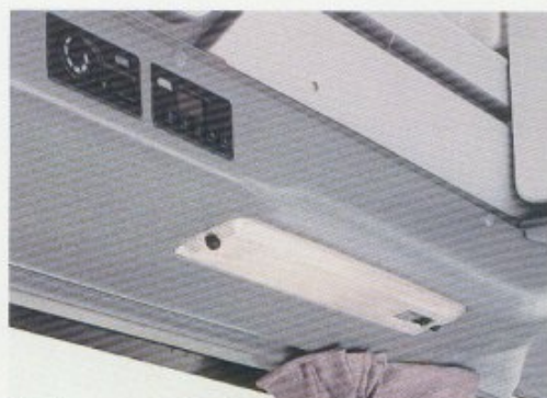
Standheizung mit Zeitschaltuhr und Transistorleuchte.