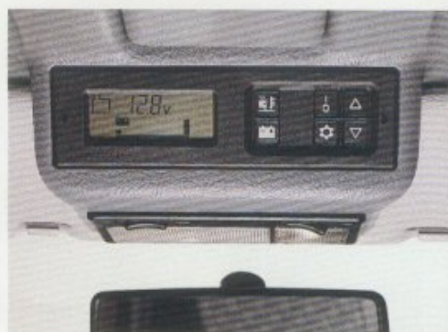
Zentralelektronik im Fahrerhaus.