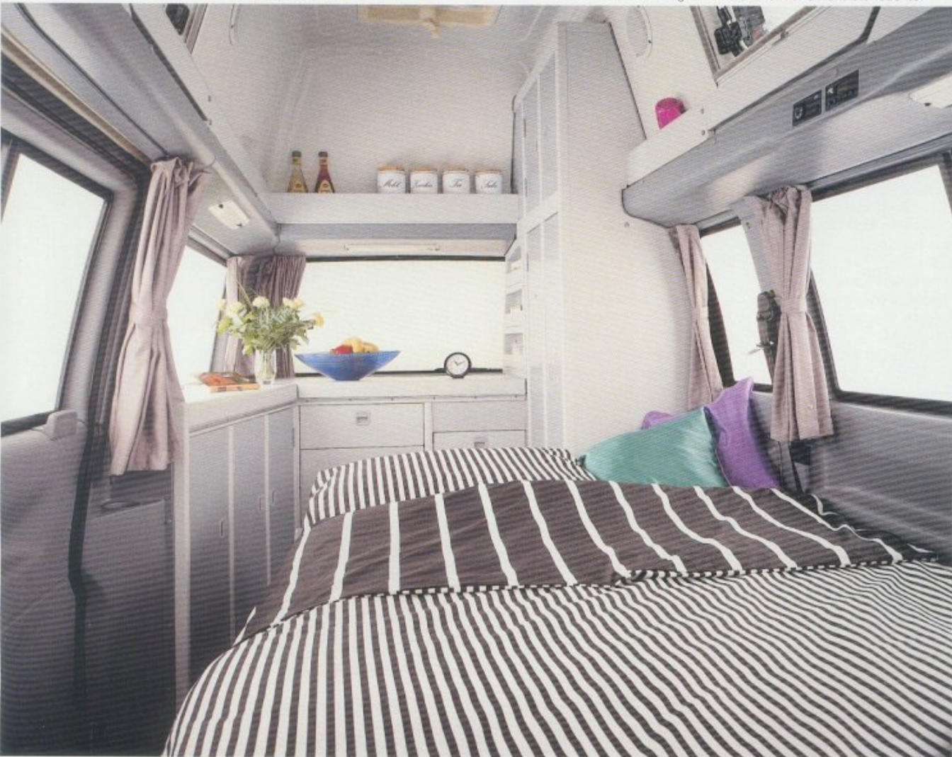
Geräumiger Schlafraum mit bequemen Betten.