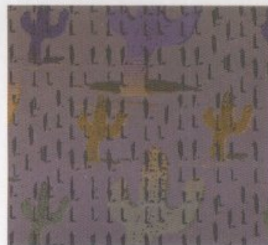
Jacquard, Dessin Kaktus