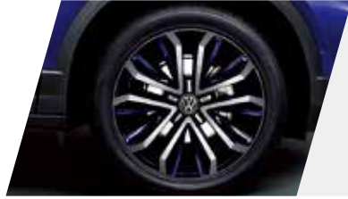
18英寸FERROL 风暴蓝喷漆铝轮毂 /215轮胎

紧贴地面，也要紧锁路人的目光。舒适型和豪华型可选装烈焰橙、风暴蓝2种颜色的18英寸轮毂，个性十足。驰骋中，收获无数艳羡目光。