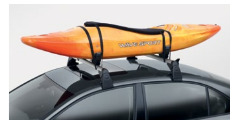
Support à kayak