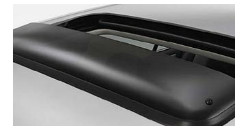
Défecteur de toit ouvrant