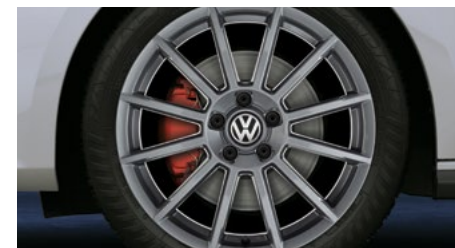
Roue « Rotary » de 18 po