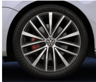
Roue en alliage « Joda Black » de 17 po GLI