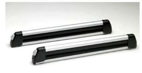
Traverses de porte-équipement de base et support à skis/planches à neige