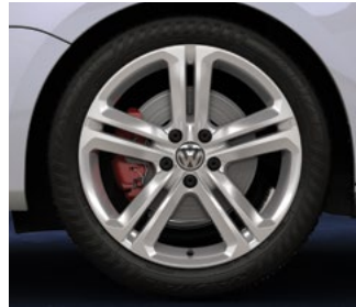
Roue en alliage « Mallory » de 18 po Autobahn