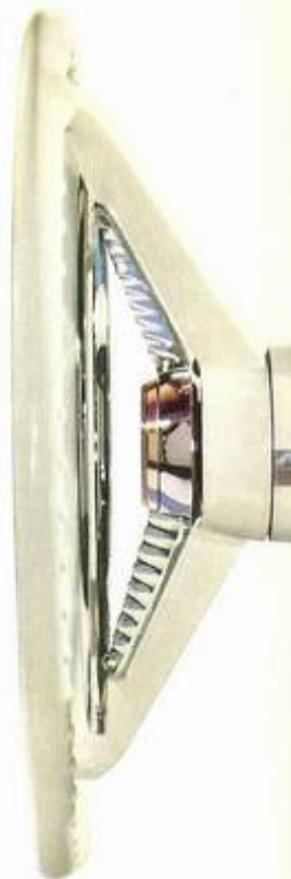
Das schüsselförmige Lenkrad mit tiefliegender Nabe; damit haben Sie den OPEL/1200 ebenso leicht wie sicher in der Hand.

Seinen Ehrennamen „Der Zuverlässige“ hat sich der OPEL-Motor auf Fahrkilometern schier astronomischer Größenordnung redlich verdient. Als 1.2 Ltr. Motor und mit 40 PS „steht er seinen Mann“. Er ist Taktiker und Strategie zugleich ... im sinnvoll-rationellen Einsatz seiner Kräfte. Er ist Eskimo und Afrikaner in einem ... immun gegen die winterliche Tiefkühlung unter Laternengaragen, immun gegen den Tropenkoller an steilen Bergen. In diesem Motor steckt Kraft. Das spüren Sie schon beim Start und mehr noch, wenn es sekundenschnell zu beschleunigen gilt. Auch dabei bleibt er laufruhig und leise ... nimmt Rücksicht auf Ihre Nerven. Und die Sparsamkeit ist ihm angeboren: Er rechnet mit jedem Pfennig, denn er beansprucht für hohe Leistungen im Straßenverkehr je nach Fahrertemperatur 7.5 bis 8.5 Ltr./100 km (8.1 Ltr./100 km nach DIN 70030). Kurz, der 1.2 Ltr. OPEL-Motor ist der tüchtige wie sparsame Hausvater Ihres OPEL/1200 ... und er bleibt es, kerngesund, sein Leben lang.