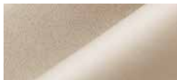
米色豪华真皮座椅

*用ECE计量法，实际状况根据不同的燃油品质、路面和驾驶条件而定。注释：“S”标准配置；“O”可选“-”无。(标准配置以实车为准)