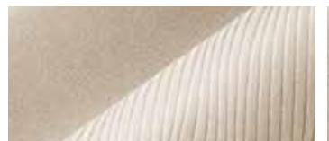
米色高级绒布座椅