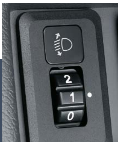
頭燈手動水平調整