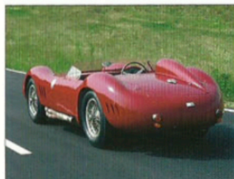
MASERATI 200S - 1956

details and limited run, will make it a true object of desire for Maserati enthusiasts everywhere.