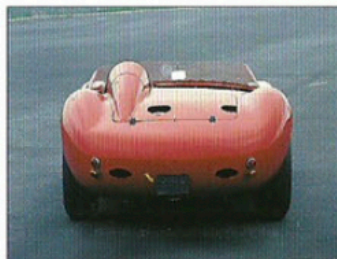
MASERATI 300S - 1955