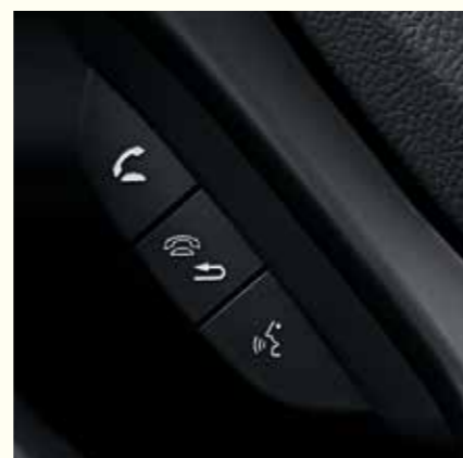
SYSTÈME DE TÉLÉPHONIE MAINS-LIBRES BLUETOOTH® SUR 1.6 i-DTEC EXECUTIVE