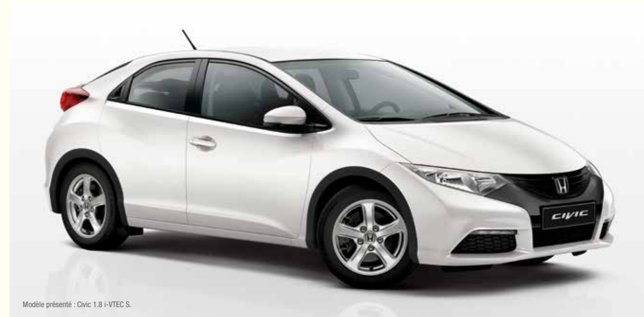
Modèle présenté : Civic 1.8 i-VTEC S.