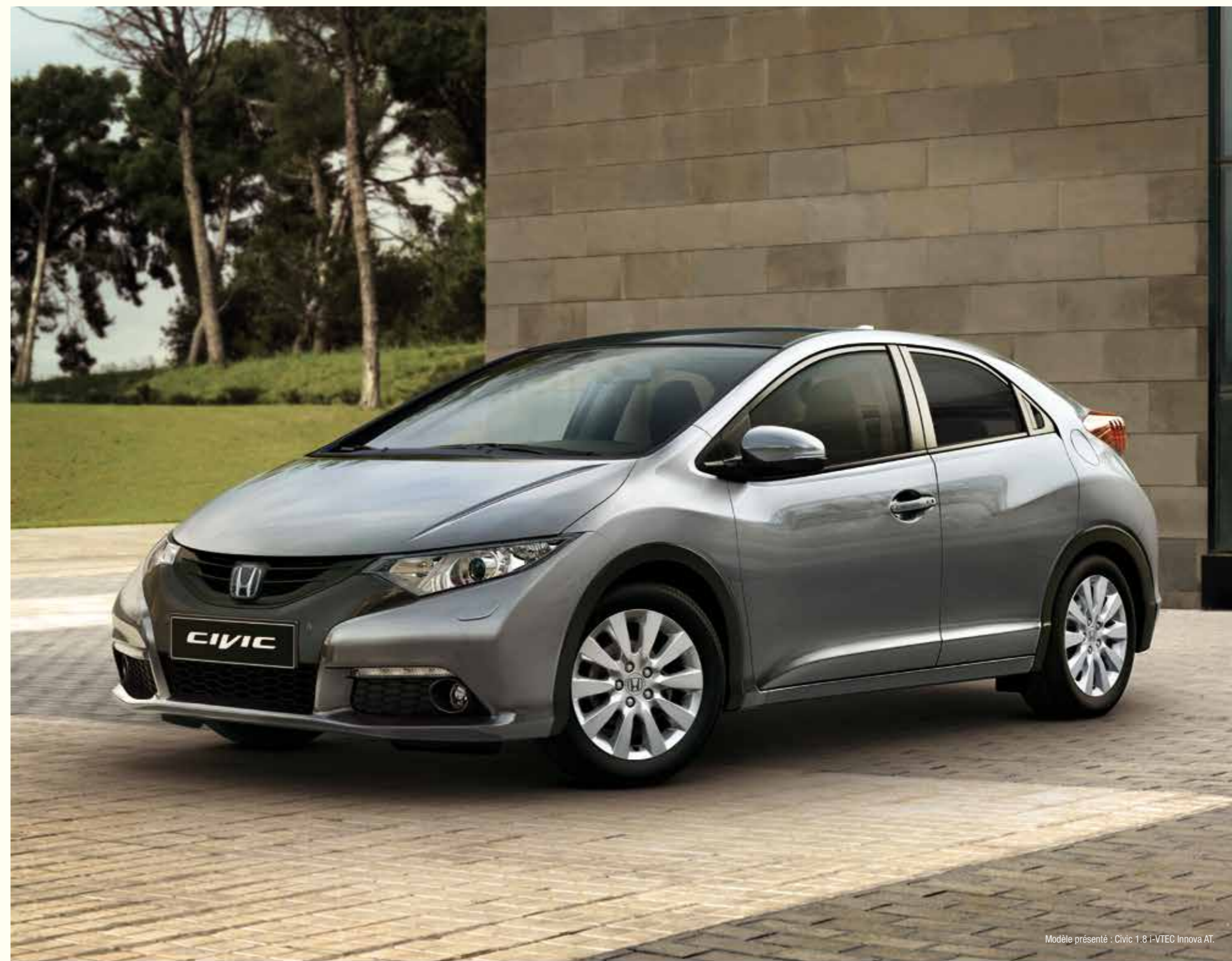
Modèle présenté : Civic 1.8 i-VTEC Innova AT.