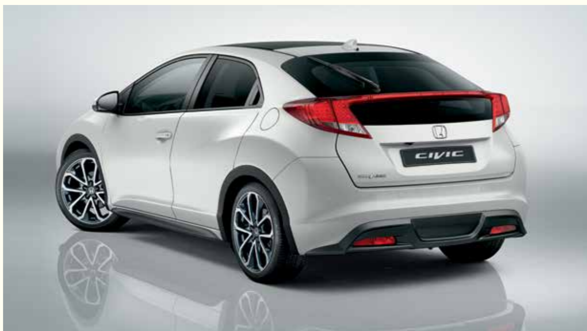
Modèle présenté avec Pack Krypton et Pack Carbone.