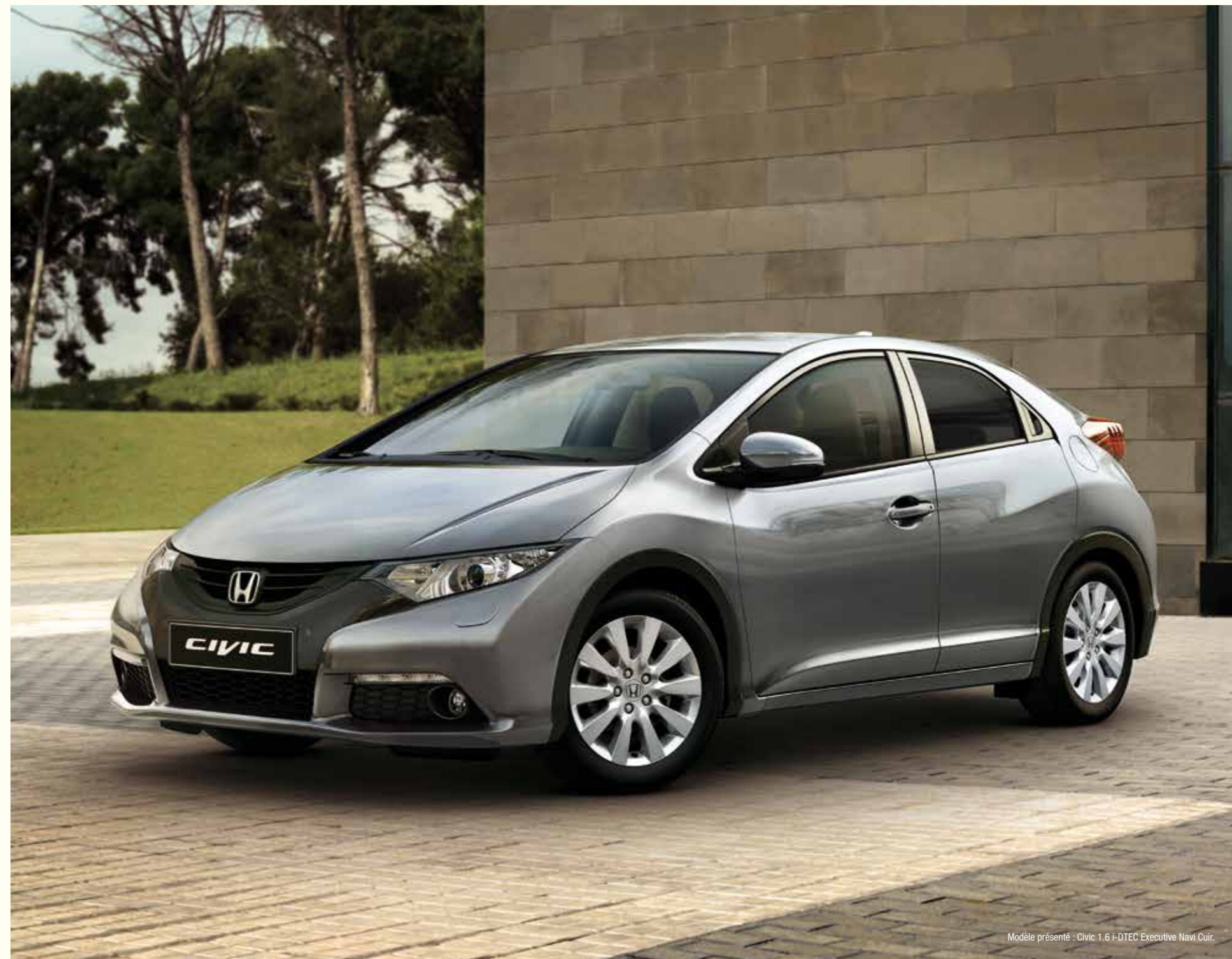
Modèle présenté : Civic 1.6 i-DTEC Executive Navi Cuir.