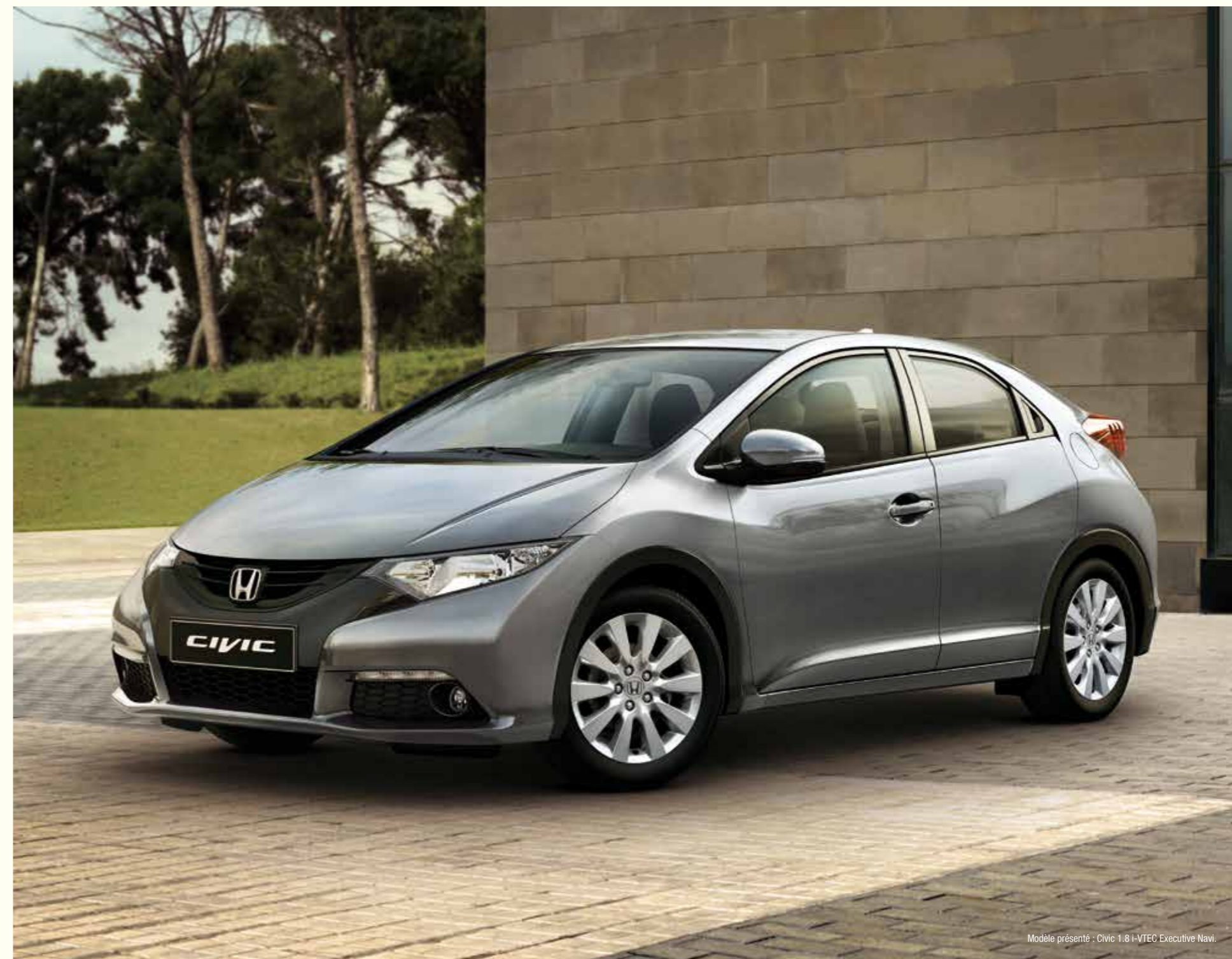
Modèle présenté : Civic 1.8 i-VTEC Executive Navi.