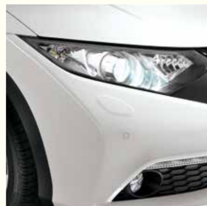
PHARES AVANT BI-XÉNON

*Les parties centrales du dossier et de l'assise des sièges avant, les parties latérales inférieures (soutiens latéraux) et la partie périmétrique des appuis-tête avant sont en cuir d'origine bovine. La face des dossiers, de l'assise des sièges arrière et les parties supérieures et latérales des appuis-tête arrière sont également en cuir d'origine bovine. Les parties centrale et inférieure des appuis-tête avant, l'arrière des sièges avant et les côtés des assises et des dossiers sont en simili cuir. Les parties supérieures latérales du dossier (épaules) et les parties latérales avant des assises de sièges avant (soutien des cuisses) sont en imitation cuir avec aspect tissu. Le dessous des appuis-tête arrière, les côtés de la banquette, la partie inférieure périmétrique des assises, les faces et le fond de la trappe à accoudoir arrière, les parties latérales de l'accoudoir et les parties de contact de l'assise et du dossier de sièges arrière sont en simili cuir. Le dos des dossiers arrière est en tissu. Les contrepentes et l'accoudoir central avant sont recouverts de simili cuir.