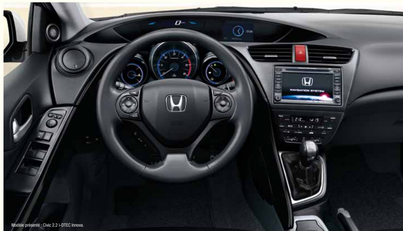
Modèle présenté : Civic 2.2 i-DTEC Innova.

Système de prévention des collisions par freinage CMBS Régulateur de vitesse adaptatif ACC