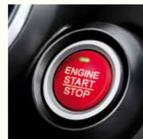
SYSTÈME DE DÉVERROUILLAGE ET DE DÉMARRAGE SANS CLÉ

*Les parties centrales du dossier et de l'assise des sièges avant, les parties latérales inférieures (soutiens latéraux) et la partie périmétrique des appuis-tête avant sont en cuir d'origine bovine. La face des dossiers, de l'assise des sièges arrière et les parties supérieures et latérales des appuis-tête arrière sont également en cuir d'origine bovine. Les parties centrale et inférieure des appuis-tête avant, l'arrière des sièges avant et les côtés des assises et des dossiers sont en simili cuir. Les parties supérieures latérales du dossier (épaules) et les parties latérales avant des assises de sièges avant (soutien des cuisses) sont en imitation cuir avec aspect tissu. Le dessous des appuis-tête arrière, les côtés de la banquette, la partie inférieure périmétrique des assises, les faces et le fond de la trappe à accoudoir arrière, les parties latérales de l'accoudoir et les parties de contact de l'assise et du dossier de sièges arrière sont en simili cuir. Le dos des dossiers arrière est en tissu. Les contrepentes et l'accoudoir central avant sont recouverts de simili cuir.