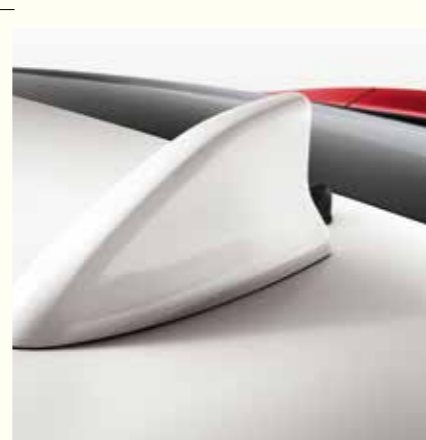
ANTENNE "AILERON DE REQUIN"

Système de téléphonie mains-libres Bluetooth®