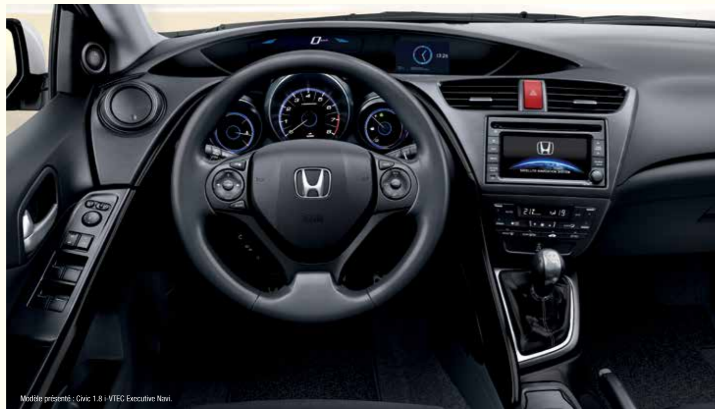
Modèle présenté : Civic 1.8 i-VTEC Executive Navi.

Système de navigation par satellite avec cartographie SD Système de téléphonie mains libres Bluetooth®