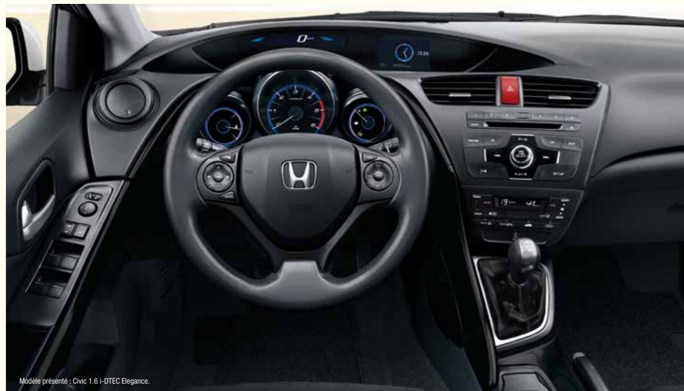
Modèle présenté : Civic 1.6 i-DTEC Elegance.