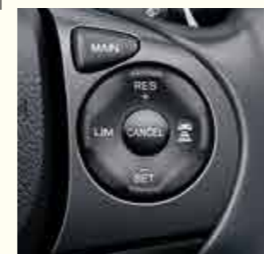
COMMANDES AU VOLANT DU RÉGULATEUR DE VITESSE ADAPTATIF ACC