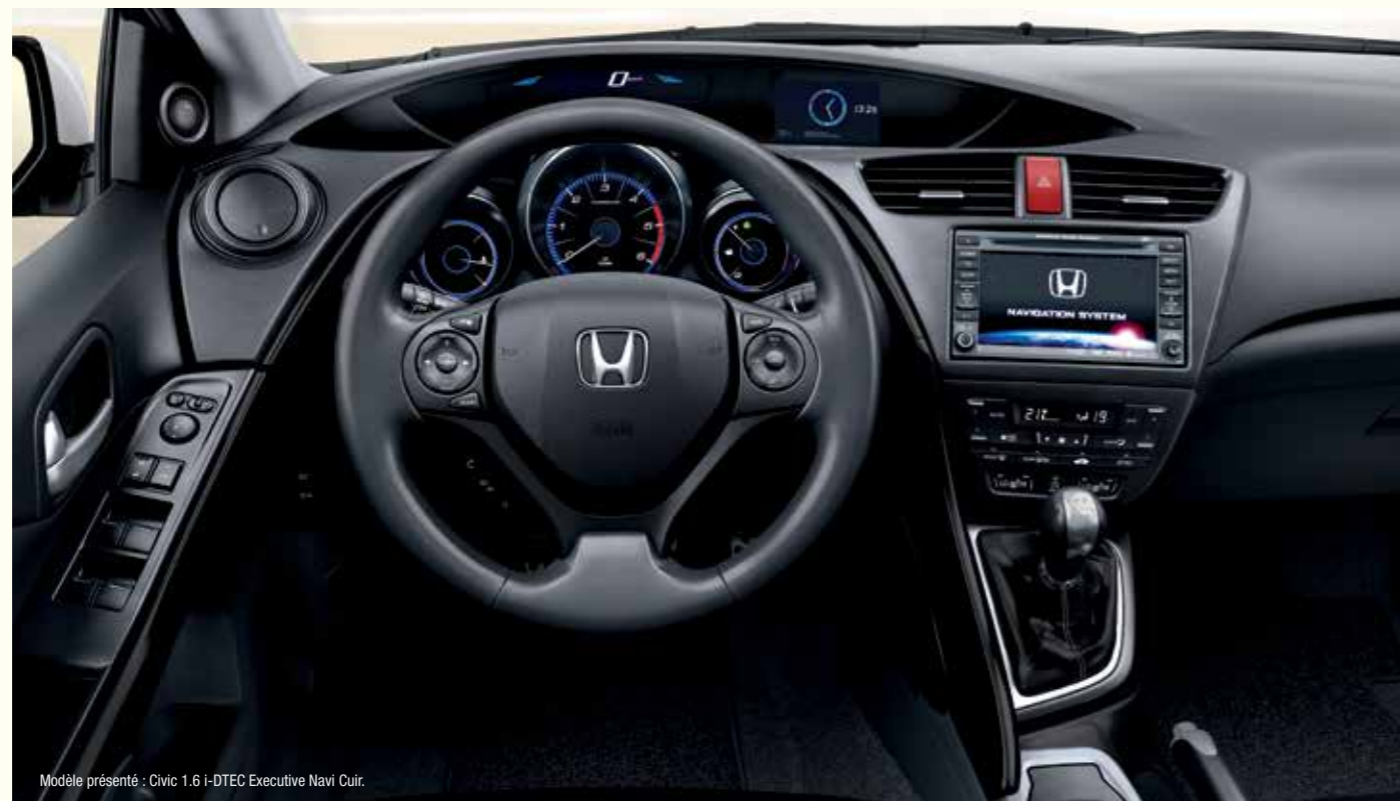
Modèle présenté : Civic 1.6 i-DTEC Executive Navi Cuir.

Système de navigation à disque dur interne Sellerie en cuir partiel* Sièges avant chauffants Phares bi-xénon Système de feux de route automatiques HSS Radars de stationnement AV / AR Vitres arrière surteintées Système audio premium avec subwoofer et tuner numérique DAB Rétroviseur intérieur jour/nuit automatique