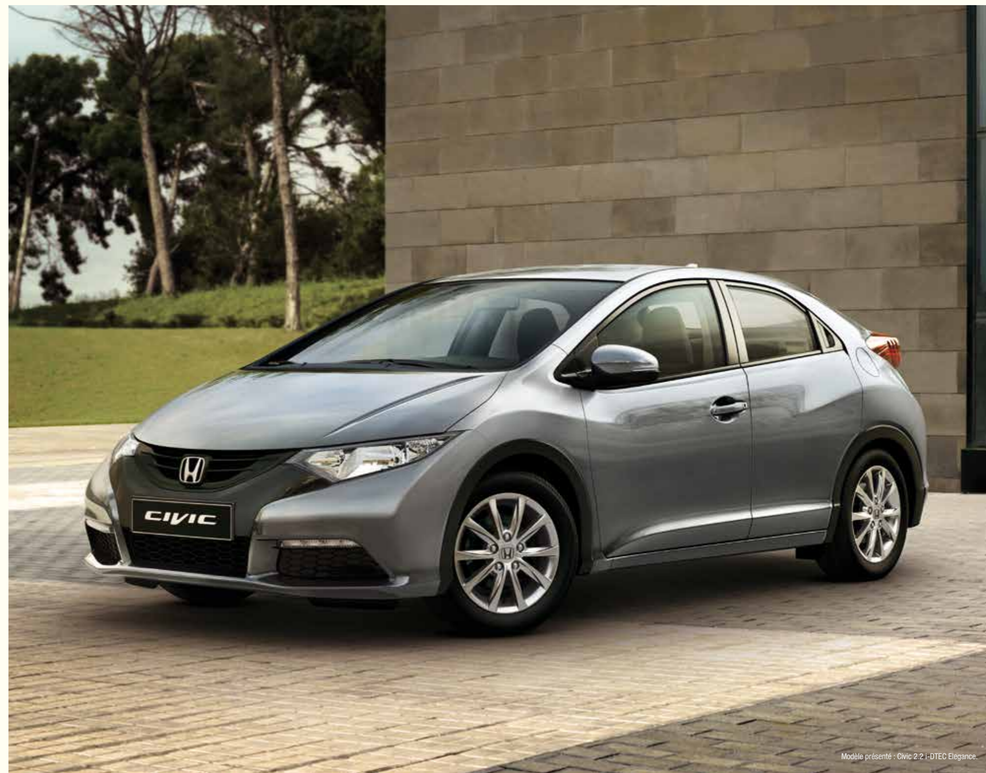
Modèle présenté : Civic 2.2 i-DTEC Elegance.