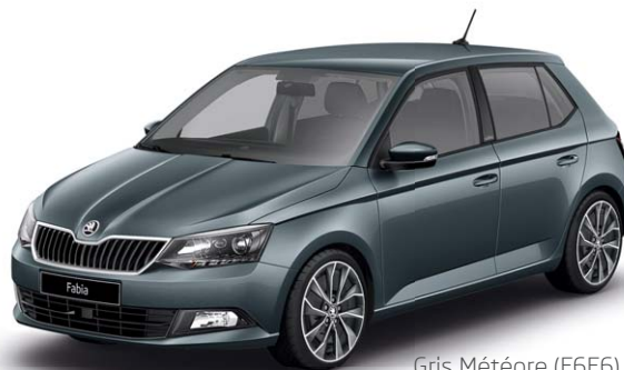
Gris Météore (F6F6)