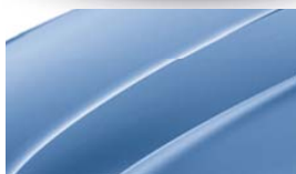
Bleu Denim (G0G0)