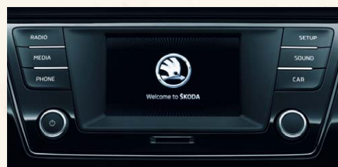
Radio "Swing" avec écran tactile, système téléphone mobile Bluetooth® et lecteur de carte SD.