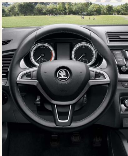
Volant en cuir avec surpiqures 3 branches multifonctions radio / téléphone, fonds de cadrans spécifiques Edition Tour de France.