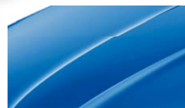
Bleu Racing (8X8X)