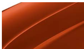
Rouge Rio (6X6X)