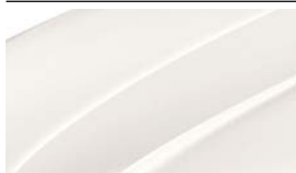
Blanc Cristal (9P9P)