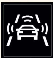
Front Assist (aide au freinage d'urgence).