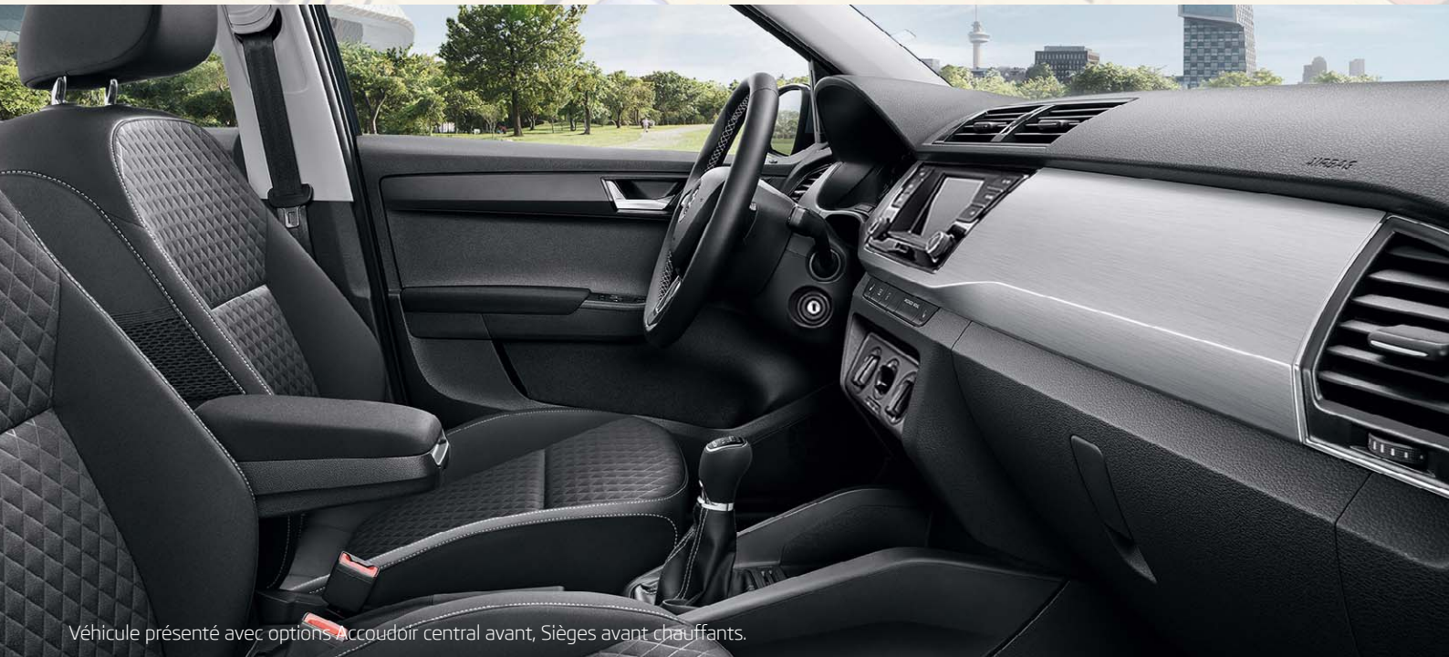
Véhicule présenté avec options Accoudoir central avant, Sièges avant chauffants.

L'habitacle profite d'éléments de design spécifiques tels que les surpiqures grises sur le volant, le frein à main et le levier de vitesse, ainsi qu'une sellerie spécifique noire. Le volant multifonctions, la climatisation mécanique, la radio "Swing" avec écran tactile et système téléphone mobile Bluetooth®, le régulateur/limiteur de vitesse et le Front Assist viennent quant à eux assurer un maximum de confort et de sécurité.