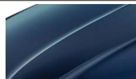
Bleu Pacific (Z5Z5)