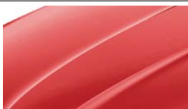
Rouge Corrida (8T8T)