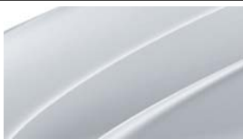
Gris Argent (8E8E)