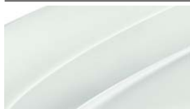
Blanc Laser (J3J3)