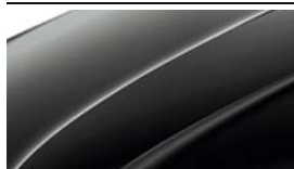
Noir Magic Nacré (I2I2)