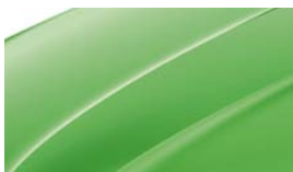
Vert Rallye (P7P7)