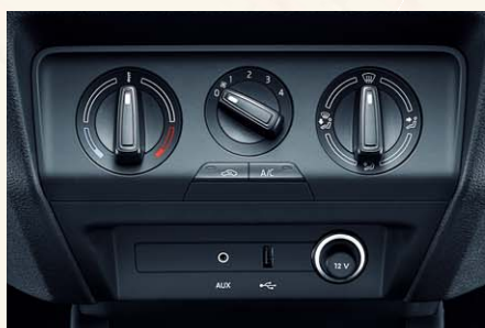
Climatisation mécanique et connexions USB/AUX-IN.