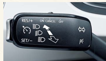
Régulateur + limiteur de vitesse.