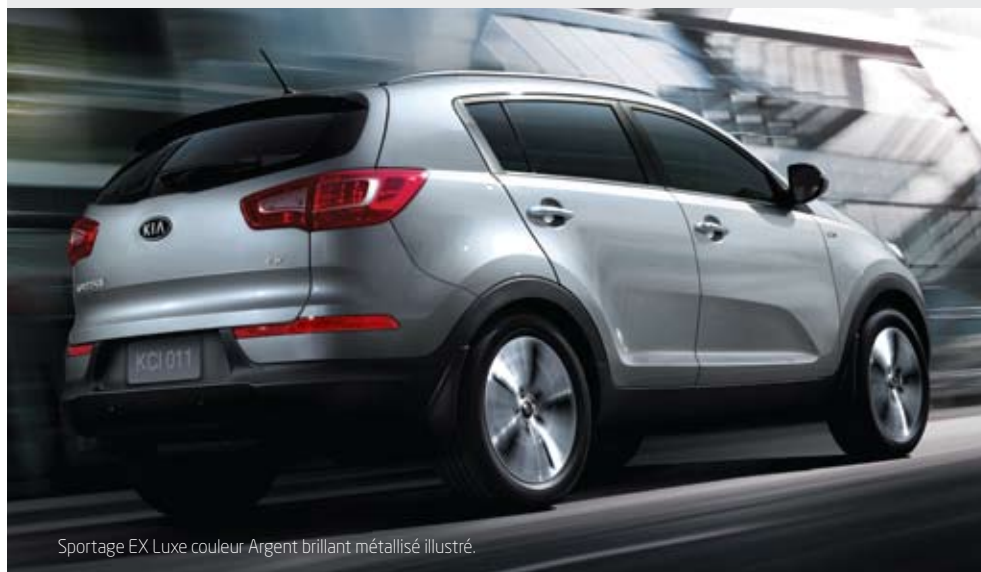
Sportage EX Luxe couleur Argent brillant métallisé illustré.

Pouvez-vous vous imaginer au volant d'un autre véhicule?