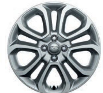
Llantas de aleación de 17"