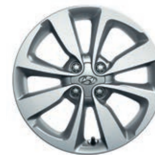
Llantas de aleación de 16"

TomTom® LIVE Services. Se incluye una suscripción gratis por 7 años a TomTom® LIVE Services, que proporciona datos precisos sobre el tráfico, radares y cámaras*, meteorología y servicios locales, todo en una gran pantalla táctil a color de 7 pulgadas. La conectividad está asegurada por Bluetooth® y los puertos USB y AUX.