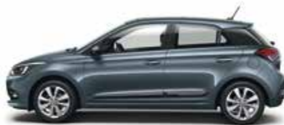
Aqua Sparkling (W3U) Metalizzato