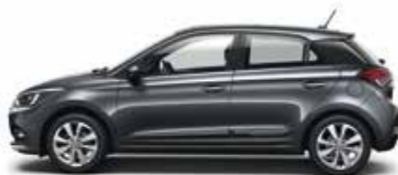
Star Dust (V3G) Metalizzato