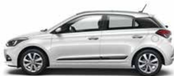
Polar White (PSW) Pastello