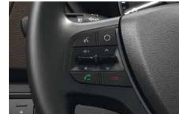
Comandi audio al volante. Controlla il volume, cerca o cambia la stazione radio in tutta semplicità.