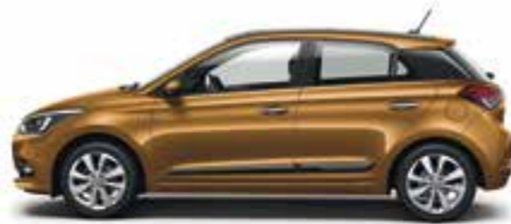
Mandarin Orange (T5A) Micalizzato