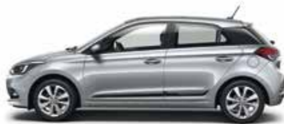
Sleek Silver (RYS) Metalizzato