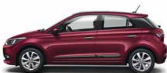
Red Passion (X2R) Micalizzato