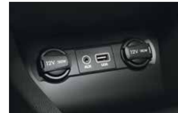
Porte AUX e USB. Tutta la connettività di cui hai bisogno per il tuo smartphone o lettore MP3.