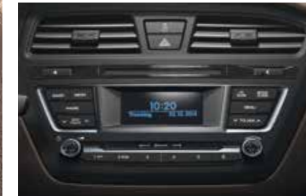
Sistema audio. Radio RDS con lettore CD/MP3, connettività Bluetooth® e porte USB e AUX. Il sistema può essere controllato facilmente anche tramite i comandi al volante.

Intrattenimento, comunicazione e interazione con il veicolo: la nuova Hyundai i20 sorprende per una dotazione multimediale che risponde alle aspettative di chi è sempre connesso e non rinuncia ad ascoltare la propria musica preferita anche in auto. Il sistema audio, con comandi al volante, offre connettività Bluetooth® e le porte USB e AUX. Infine la nuovissima Docking Station, di serie nella versione top, consente di collegare e tenere in carica il proprio smartphone, accedere alle proprie playlist o ascoltare le frequenze radio preferite collegandosi tramite Bluetooth®. La posizione nella parte superiore del cruscotto risulta ottimale anche nel caso in cui si utilizzi lo smartphone per la navigazione satellitare.