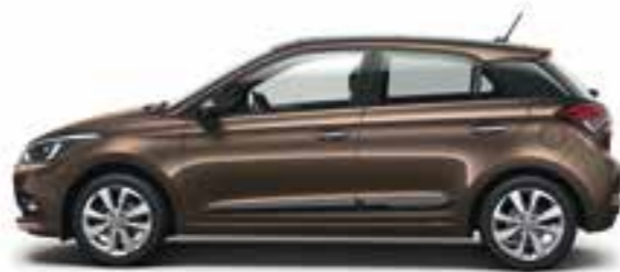
Iced Coffee (X9N) Metalizzato