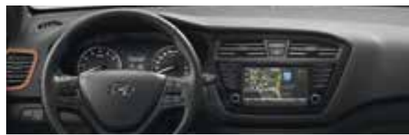
Grigio con inserti arancio