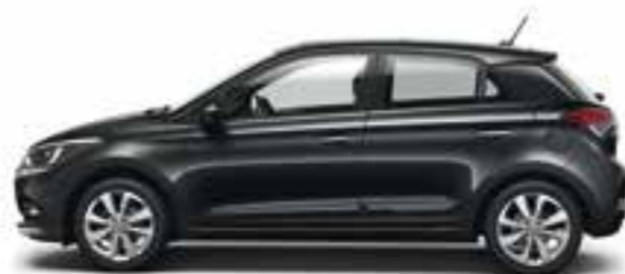
Phantom Black (X5B) Micalizzato

Siamo tutti diversi e ognuno di noi ha i propri gusti e preferenze. Per questo la tua nuova i20 è disponibile in una vasta gamma di colori esterni in abbinamento a 3 diversi rivestimenti interni.