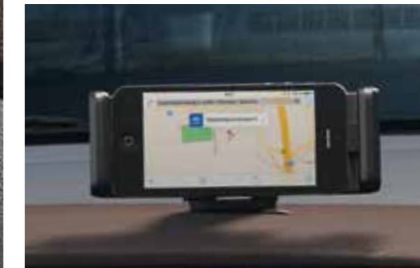
Docking station per Smartphone. Il modo migliore per tenere il tuo smartphone in posizione sicura, comoda e sotto carica.