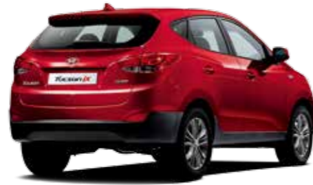
Smart (레밍턴 레드)