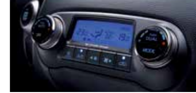
듀얼 풀오토 에어컨