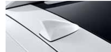
외장형 통합안테나 (샤크핀타입)