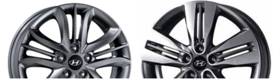
◀ 17인치 알로이 휠