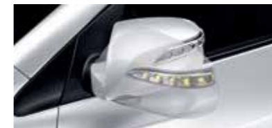
열선내장 전동접이식 아웃사이드 미러