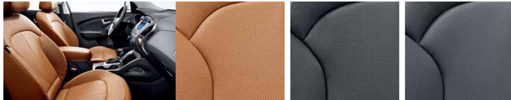
브라운 가죽 시트