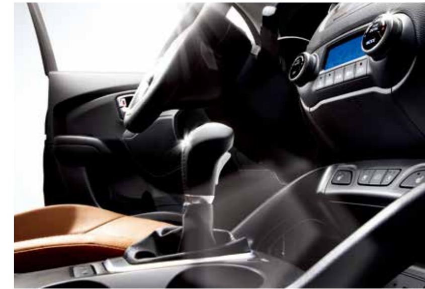
[부스트타입 6단자동 변속기]

[플렉스 스티어] 드라이빙 상황에 따라 콤포트, 노멀, 스포츠의 3가지 모드로 스티어링 휠 감도 조절이 가능하여 드라이빙의 만족감을 더합니다.