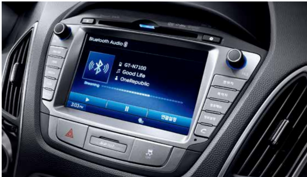
[7인치 스마트 내비게이션 & AUX/USB 단자]

TPEG 서비스와 DMB, DVD플레이어 등의 기능에 블루링크 서비스가 적용된 내비게이션은 차량진단관리, 소모품 관리, 에코드라이브 코치 등 다양한 서비스로 스마트한 자동차 생활을 가능하게 합니다.