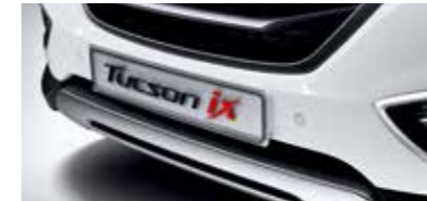
프론트 스킵드 플레이트