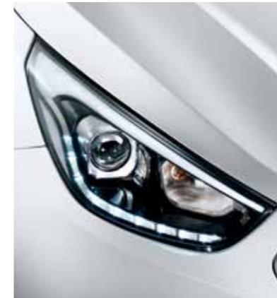
HID 헤드램프 & LED 주간전조등, 포지셔닝 램프