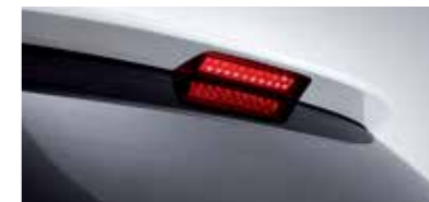
리어스포일러 (보조제동등 내장)