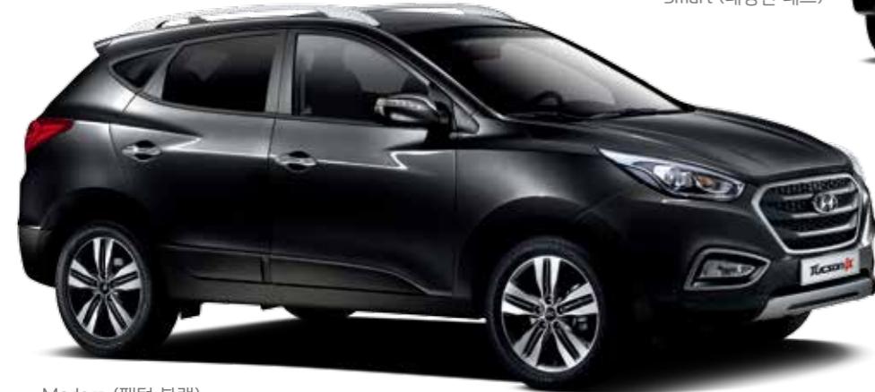
Modern (팬텀 블랙)