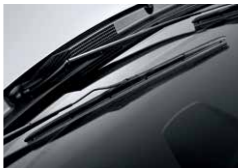
[에어로 타입 와이퍼] 에어로 타입 와이퍼는 우수한 밀착력으로 비오는 날 깨끗한 시야 확보가 가능합니다.

어느새 일상으로 빠져들어가는 화요일. 비슷한 느낌의 사람들 만큼이나 익숙한 것들로 가득한 거리. 그 속에서 투싼에 눈길이 가는 건 살아있는 디테일 때문일까. 투싼과 나에게 이 도시는 무대이며, 주인공은 나다.