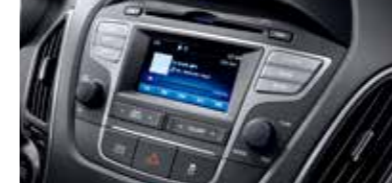
고급형 오디오 (후방카메라 포함)