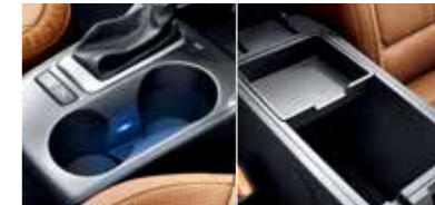
컵홀더 조명 / 센터콘솔 내장 트레이