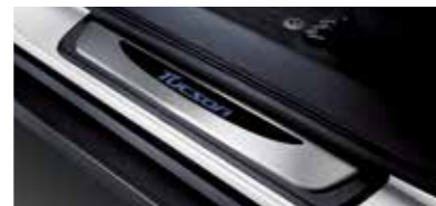
도어스텝 플레이트 (LED)