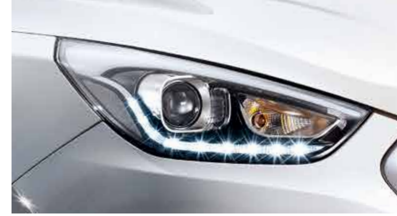
[LED 주간전조등 (DRL)] 신규 적용된 LED 주간전조등이 주간 드라이빙의 안전까지 확보해 투싼만의 스타일과 안전성을 완성합니다.