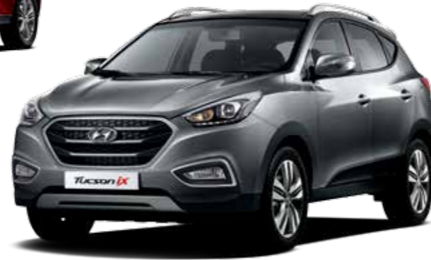
Smart Special (페퍼 그레이)