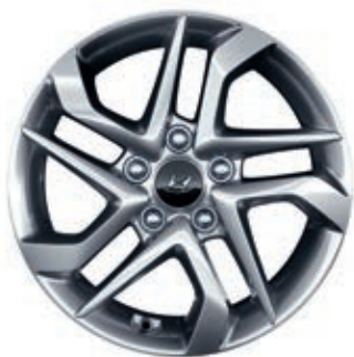
Llantas de aleación 16"