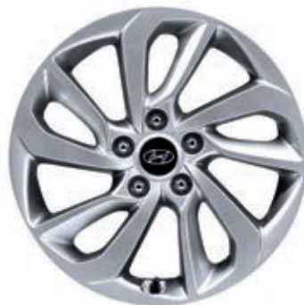
Llantas de aleación 17"