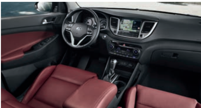
Interior de cuero rojo