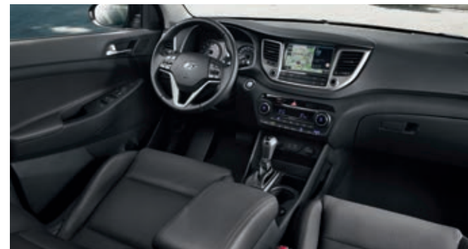
Interior negro (cuero o tela)