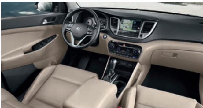
Interior beige (cuero o tela)