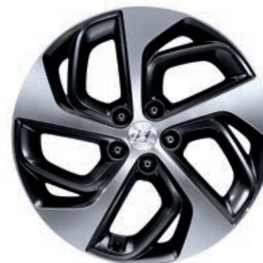
Llantas de aleación 19"