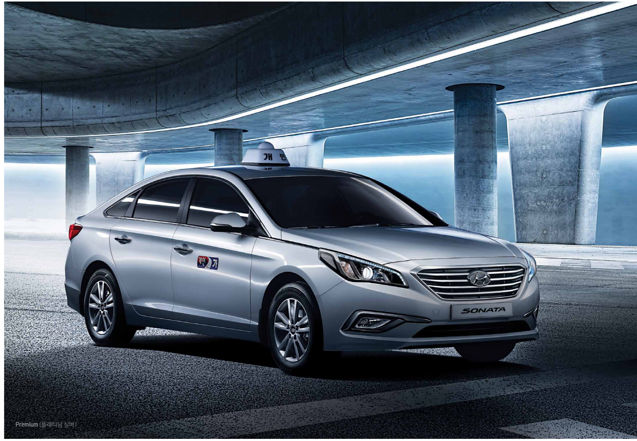
Premium (플래티넘 실버)