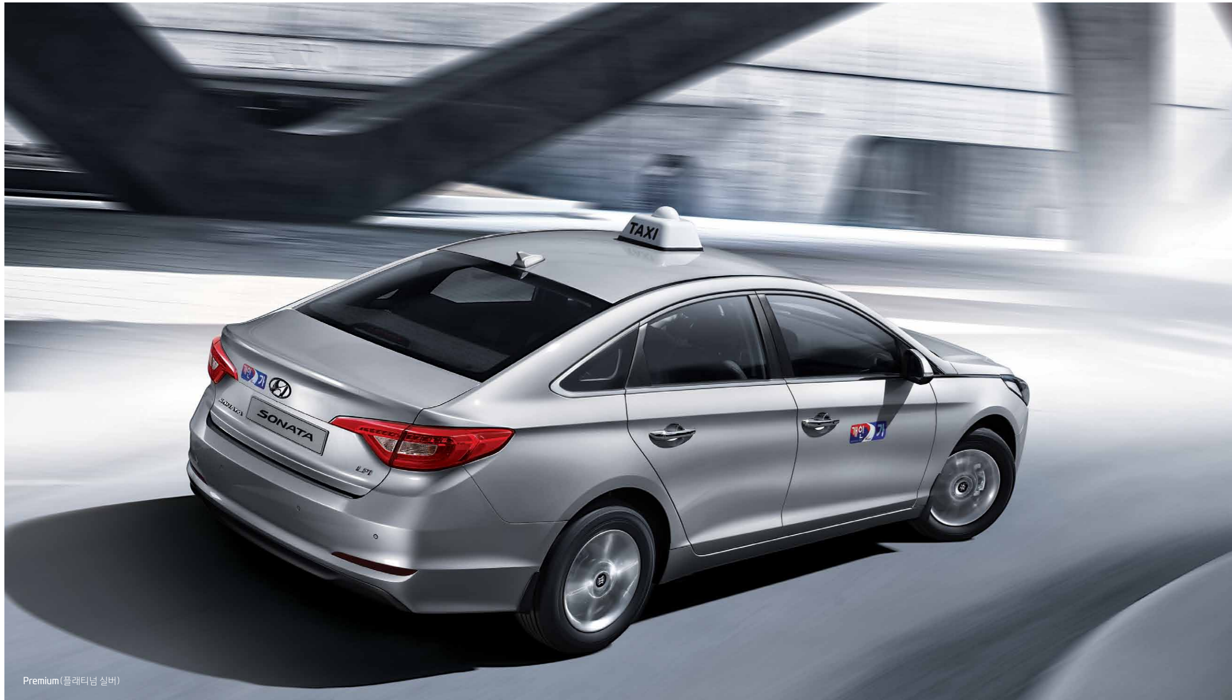
Premium (플래티넘 실버)