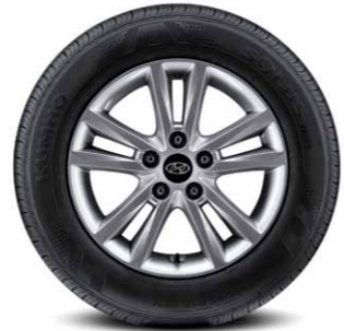
205/65R16 타이어 & 16인치 알로이 휠

택시이기에 세상의 자동차와는 다른 방향으로 진화를 시작했습니다. 쓸모 없는 기능이 당신을 불편하게 하지는 않지... 쏘나타 택시는 당신에게 필요한 기능을 더욱 완성했습니다.