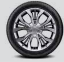
235/45 R18 타이어 & 18인치 알로이 휠