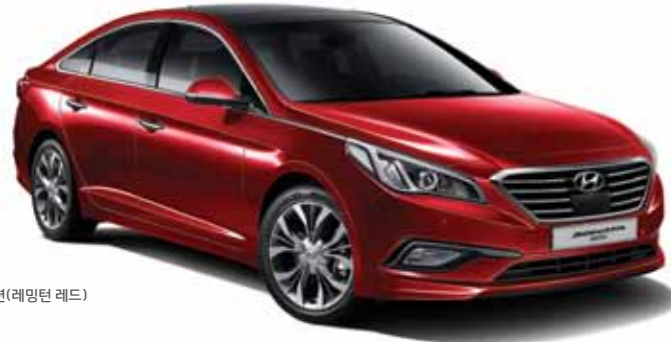
1.7 e-VGT 스마트 스페셜 풀옵션(레밍턴 레드)