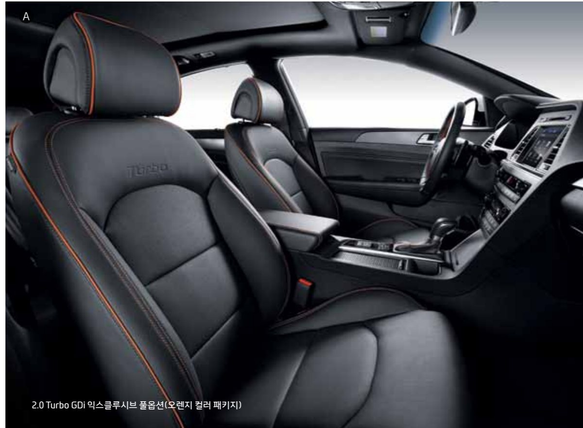
2.0 Turbo GDi 익스클루시브 풀옵션(오렌지 컬러 패키지)

세타(θ) II 2.0 Turbo GDi 엔진 연료 직분사 방식과 터보차저를 통해 고성능·친환경성을 동시에 실현한 현대자동차의 차세대 주력 엔진