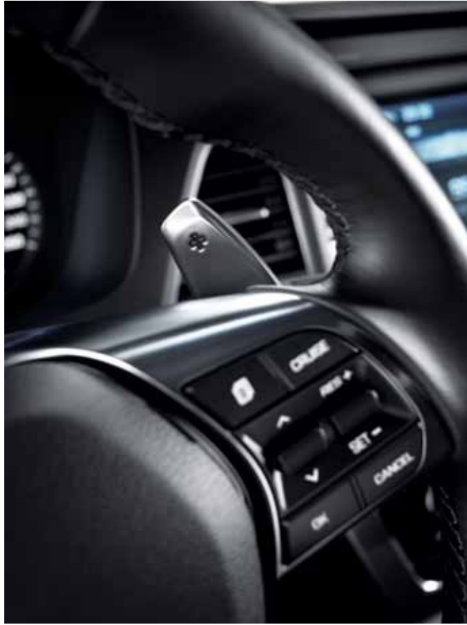
날렵한 디자인으로 드라이빙 본능을 자극하고 운전의 재미를 더하는 패들쉬프트