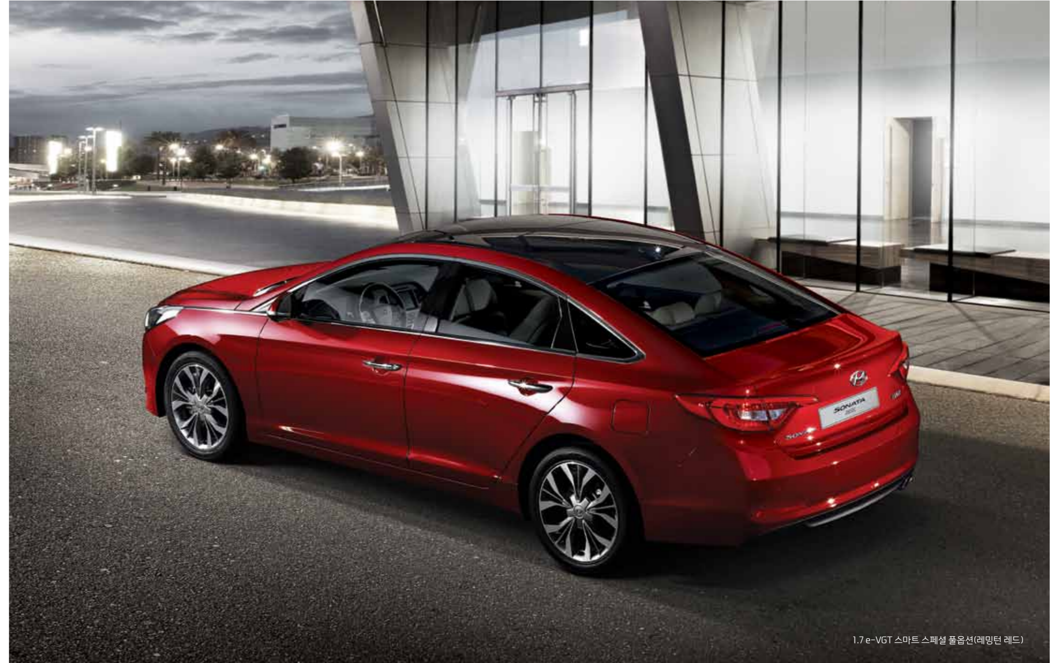
1.7 e-VGT 스마트 스페셜 풀옵션(레밍턴 레드)

연비 개선 효과와 부드러운 변속, 변속 시 소음이 적은 7단 DCT와 효율을 높이는 ISG시스템이 적용되어 효율을 극대화하고 보다 역동적인 가속감을 전달합니다.