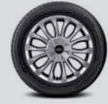
215/55 R17 타이어 & 17인치 알로이 휠