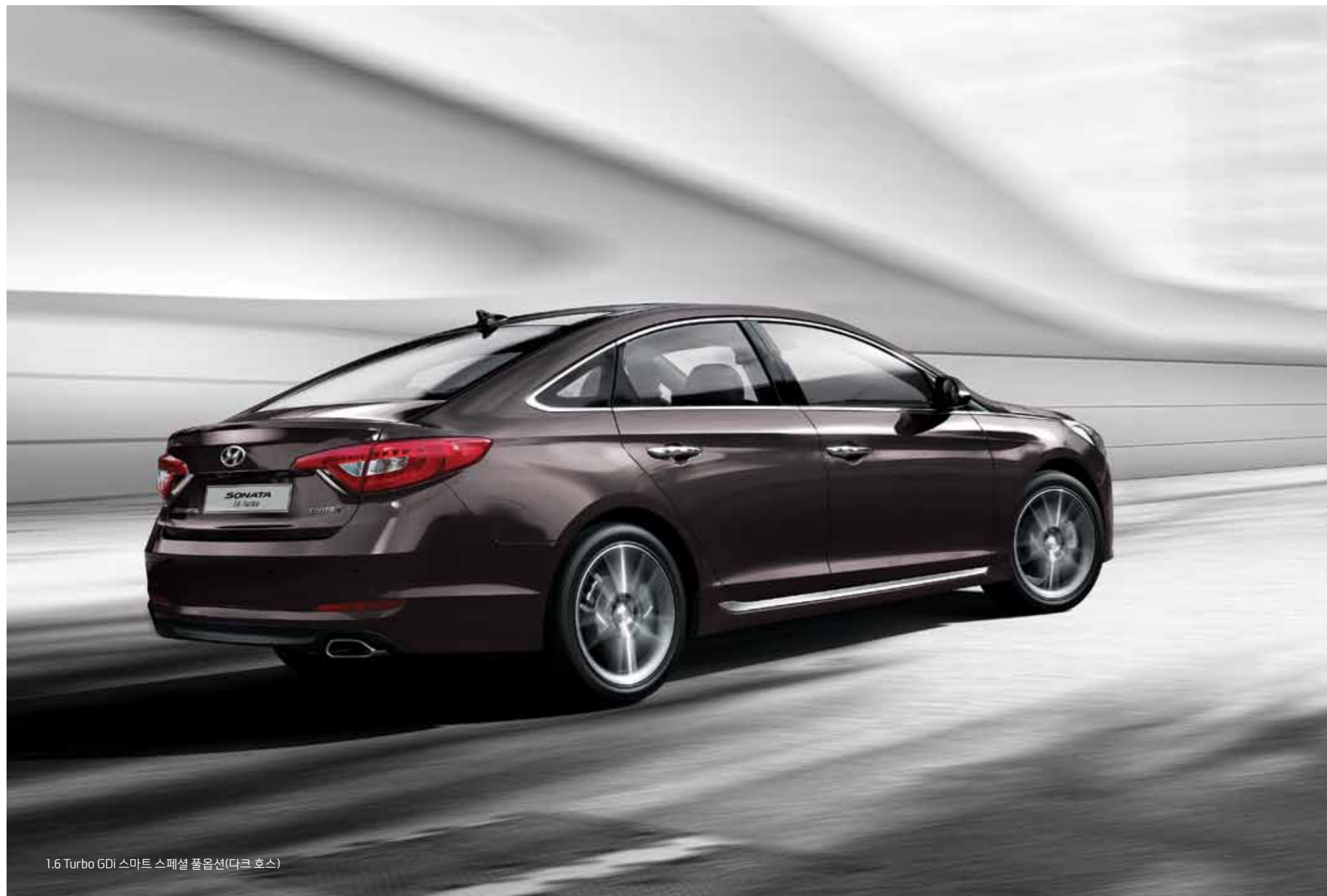
1.6 Turbo GDi 스마트 스페셜 풀옵션(다크 호스)