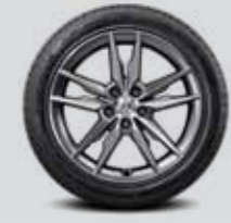
235/45 R18 타이어 & 스포츠 18인치 알로이 휠