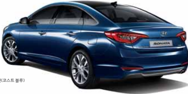
2.0 CVVL 프리미엄 스페셜 풀옵션(코스트 블루)