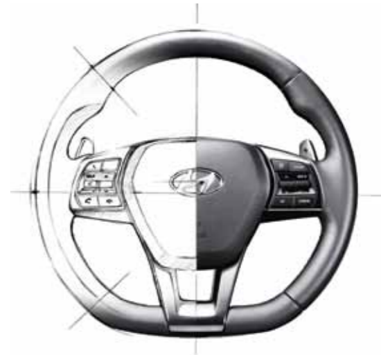
하단을 수평으로 처리하여 터보 특유의 역동성을 살린 D컷 스티어링 휠