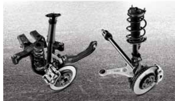
알루미늄 소재를 적용하여 경량화되고 Ride & Handling 성능을 강화한 후륜 듀얼 로어암 멀티링크 타입 서스펜션 / 전륜 맥퍼슨 스트럿 타입 서스펜션