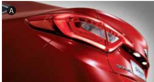
A. LED 리어 콤비램프 B. HID 헤드램프(바이패션, 스테틱 밴딩 라이트 포함) & LED 주간주행등(DRL) C. LED 리피터 내장 아웃사이드 미러