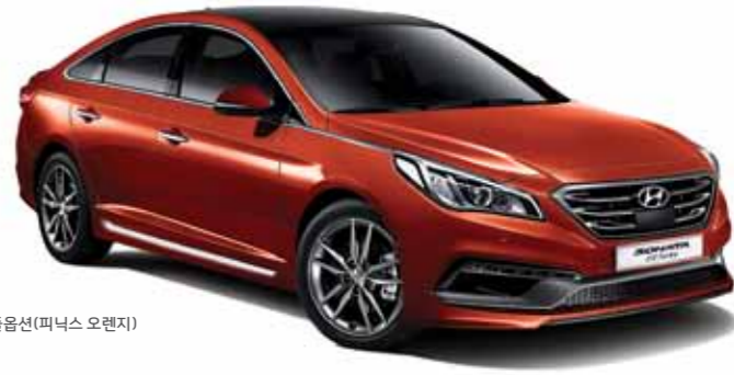
2.0 Turbo GDi 익스클루시브 풀옵션(피닉스 오렌지)