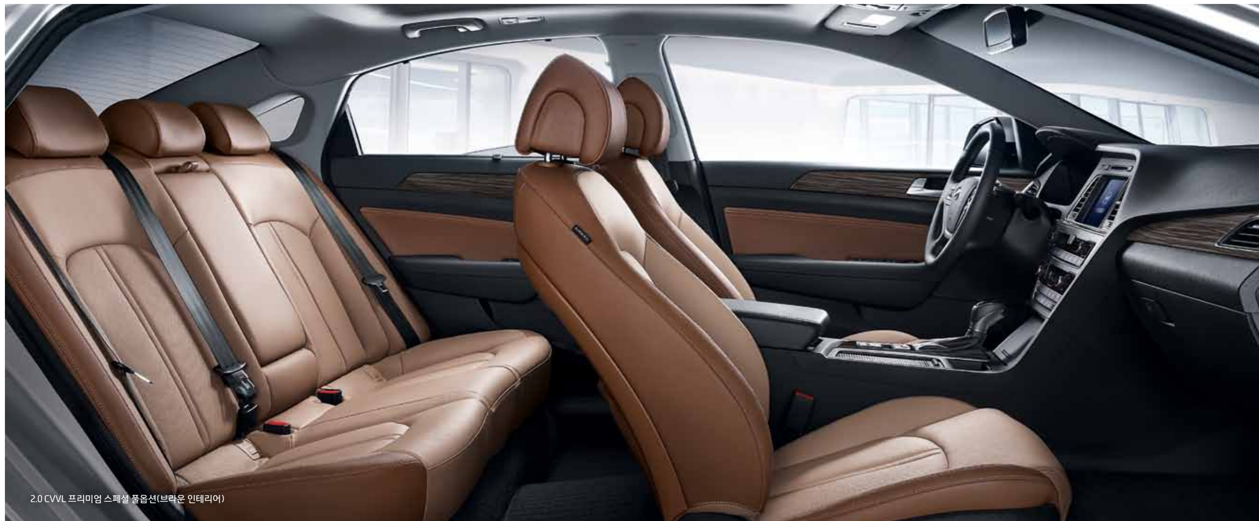
2.0 CVVL 프리미엄 스페셜 풀옵션(브라운 인테리어)

클러스터와 내비게이션, 오디오의 높이를 시각적으로 동일 선상에 정렬하여 보다 운전 집중할 수 있게 설계된 T자형 센터페시아