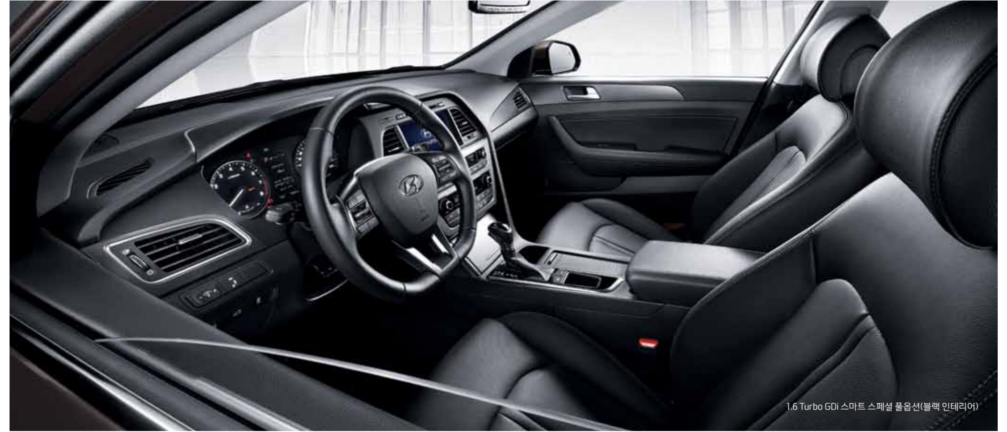
1.6 Turbo GDI 스마트 스페셜 풀옵션(블랙 인테리어)