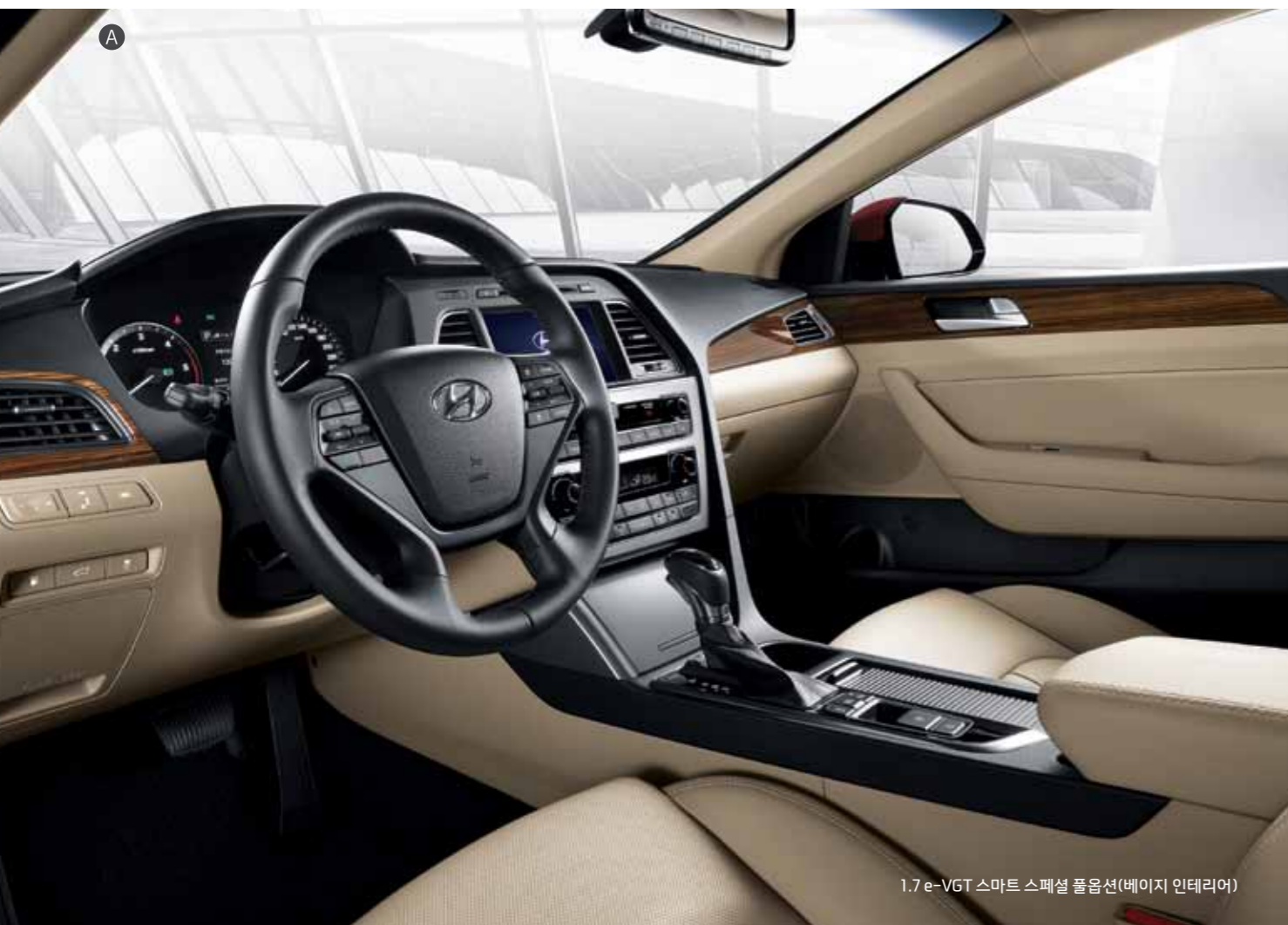
1.7 e-VGT 스마트 스페셜 풀옵션(베이지 인테리어)