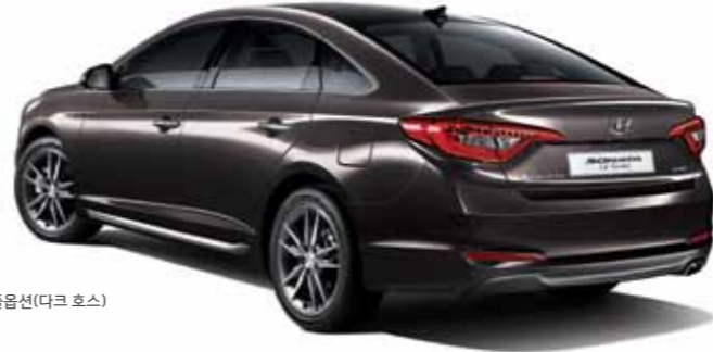
1.6 Turbo GDi 스마트 스페셜 풀옵션(다크 호스)