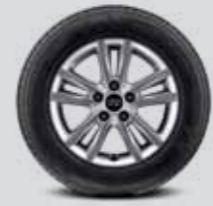
205/65 R16 타이어 & 16인치 알로이 휠

-기본서비스 : 스마트 컨트롤, 안전보안, 차량관리, 드라이빙, 블루링크Apps -유료 부가 서비스 : 컨시어지