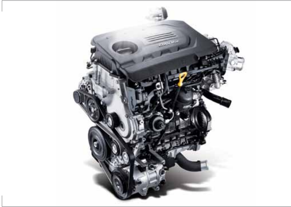
U-II 1.7 e-VGT 엔진 더욱 엄격해진 디젤차 배기가스 규제단계인 EURO 6의 기준을 충족시킨 새로운 1.7 e-VGT 엔진