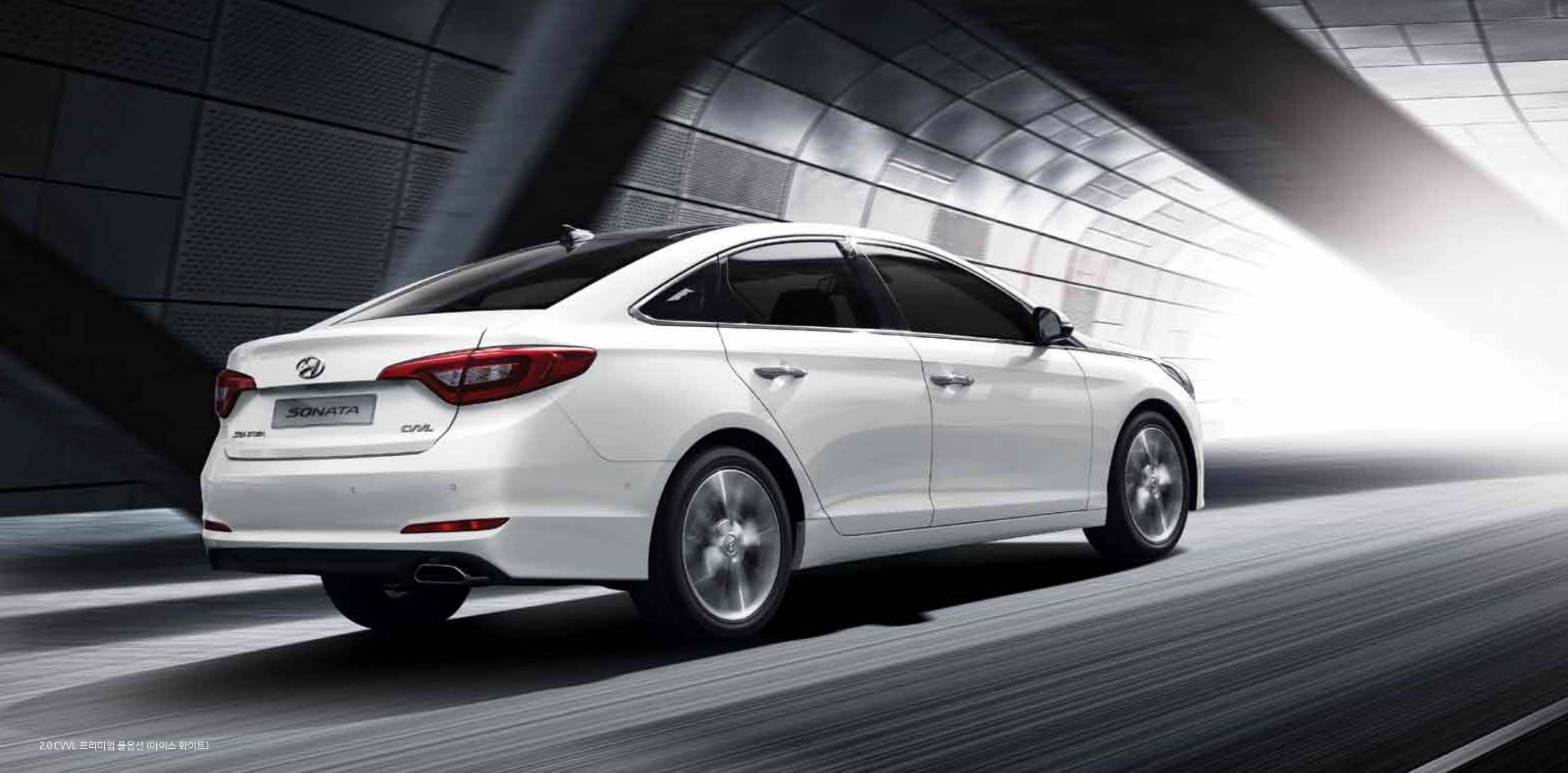
2.0 CVT 프리미엄 풀옵션 (아이스 화이트)