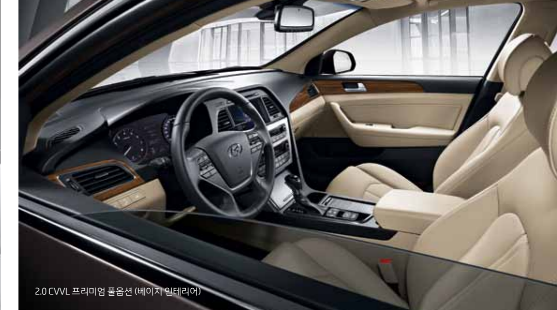
2.0 CVT 프리미엄 풀옵션 (베이지 인테리어)

자동차의 드라이빙은 엔진과 차체의 성능만으로 완벽해질 수 없습니다. 쏘나타가 자동차의 본질을 찾고, 개발하는 과정에서 운전보다 편안하고 안전하게 할 수 있는 실내 공간을 디자인 하는 것이 바로 그것 때문입니다. 클러스터와 내비게이션/오디오의 높이를 시각적으로 동일선 상에 위치하도록 세심하게 정렬함으로써 운전보다 집중할 수 있는 T자형 센터페시아와 함께 인체공학적으로 설계된 시트의 디자인은 간결함이 궁극의 정교함이라는 쏘나타의 철학과 맞닿아 있습니다.