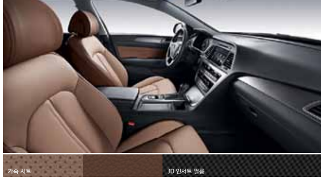
가죽 시트 3D 인서트 필름