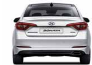
윤거 후 1,604