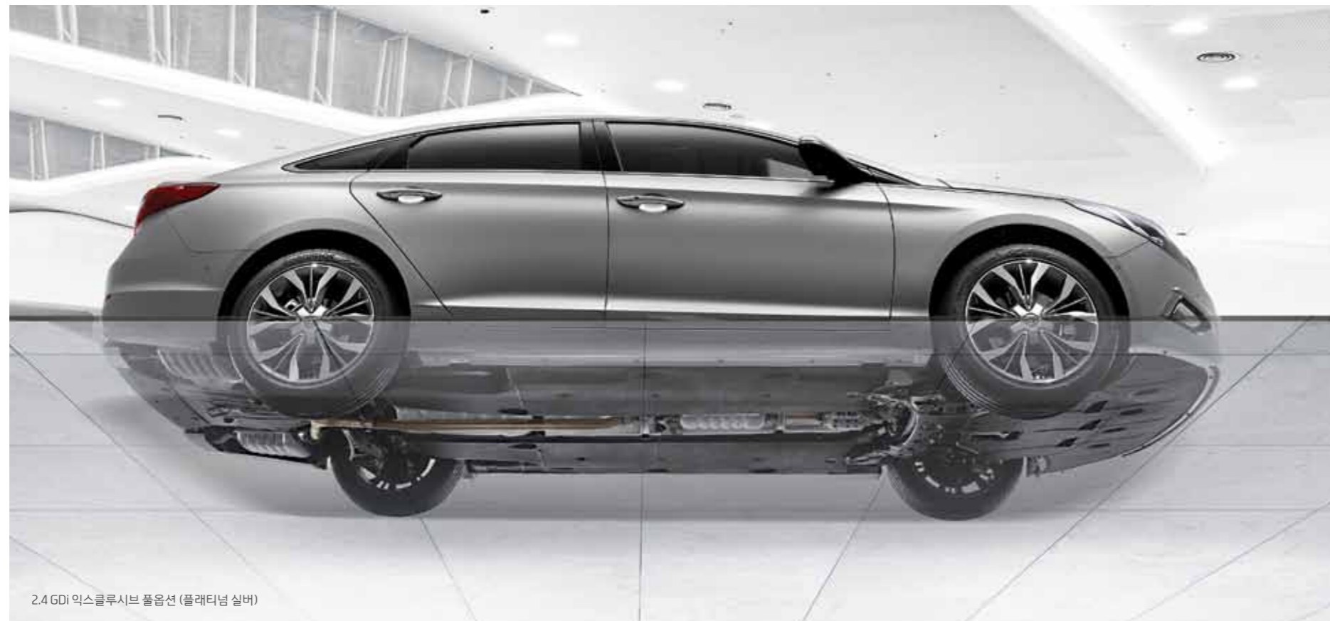
2.4 GDi 익스클루시브 풀옵션 (플래티넘 실버)

멈춰진 순간을 꾸미는 것만이 디자인은 아니기에 보이지 않더라도 몸과 마음이 느낄 수 있다면, 공기의 흐름과 함께 주행감성이 느껴질 수 있다면, 잘 달리기 위한 본질의 디자인, 쏘나타의 언더커버