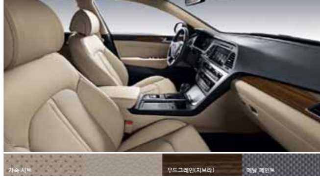
가죽 시트 우드그레인(지브라) 메탈 페인트

베이지 인테리어 선택 가능 모델 - 2.0 CVL 프리미엄, 2.0 LPi 장애인 모던, 2.0 LPi 렌터카 프리미엄 / 프리미엄 스페셜