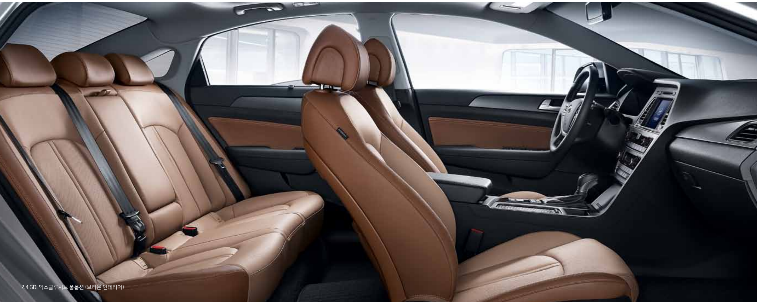
2.4GDi 익스클루시브 풀옵션 (브라운 인테리어)