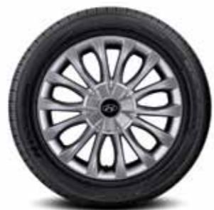
215/55R17 타이어 & 17인치 알로이 휠