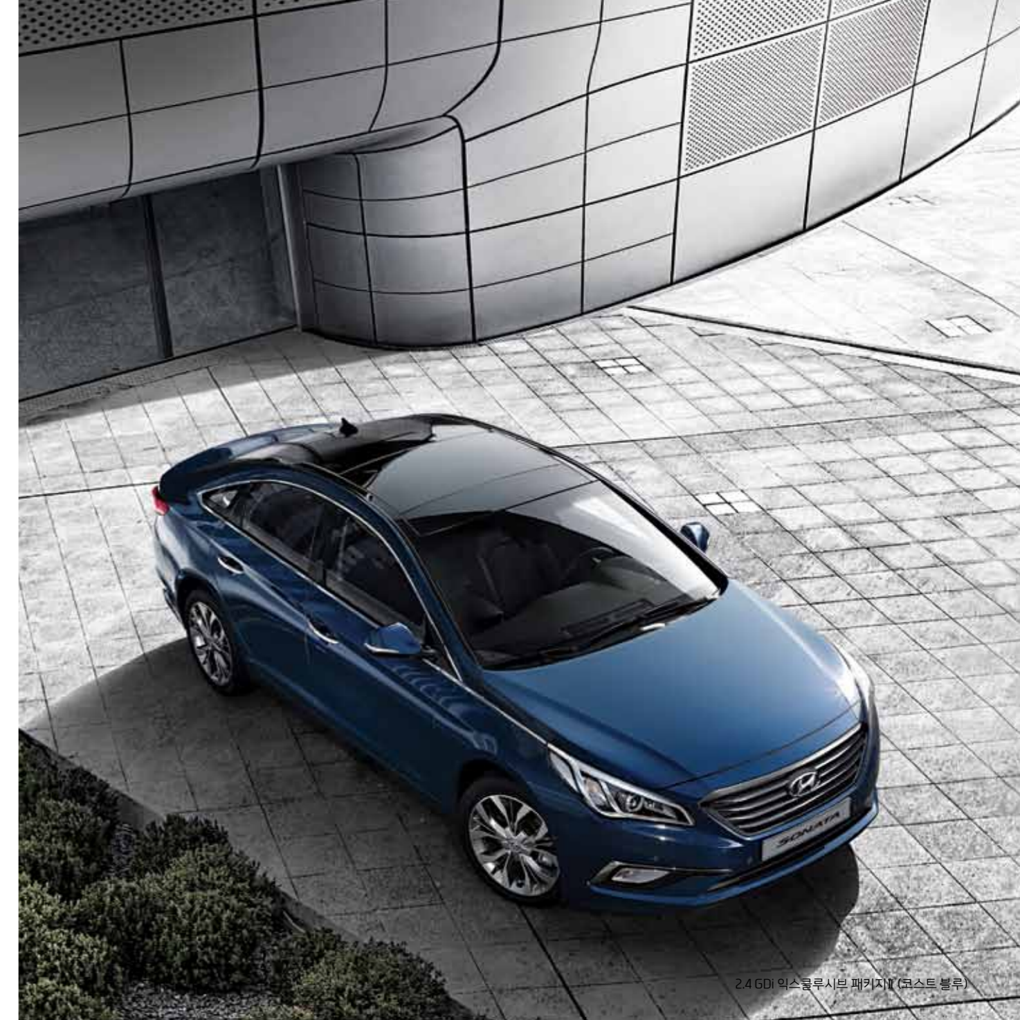
2.4 GDI 익스클루시브 패키지 (코스트 블루)