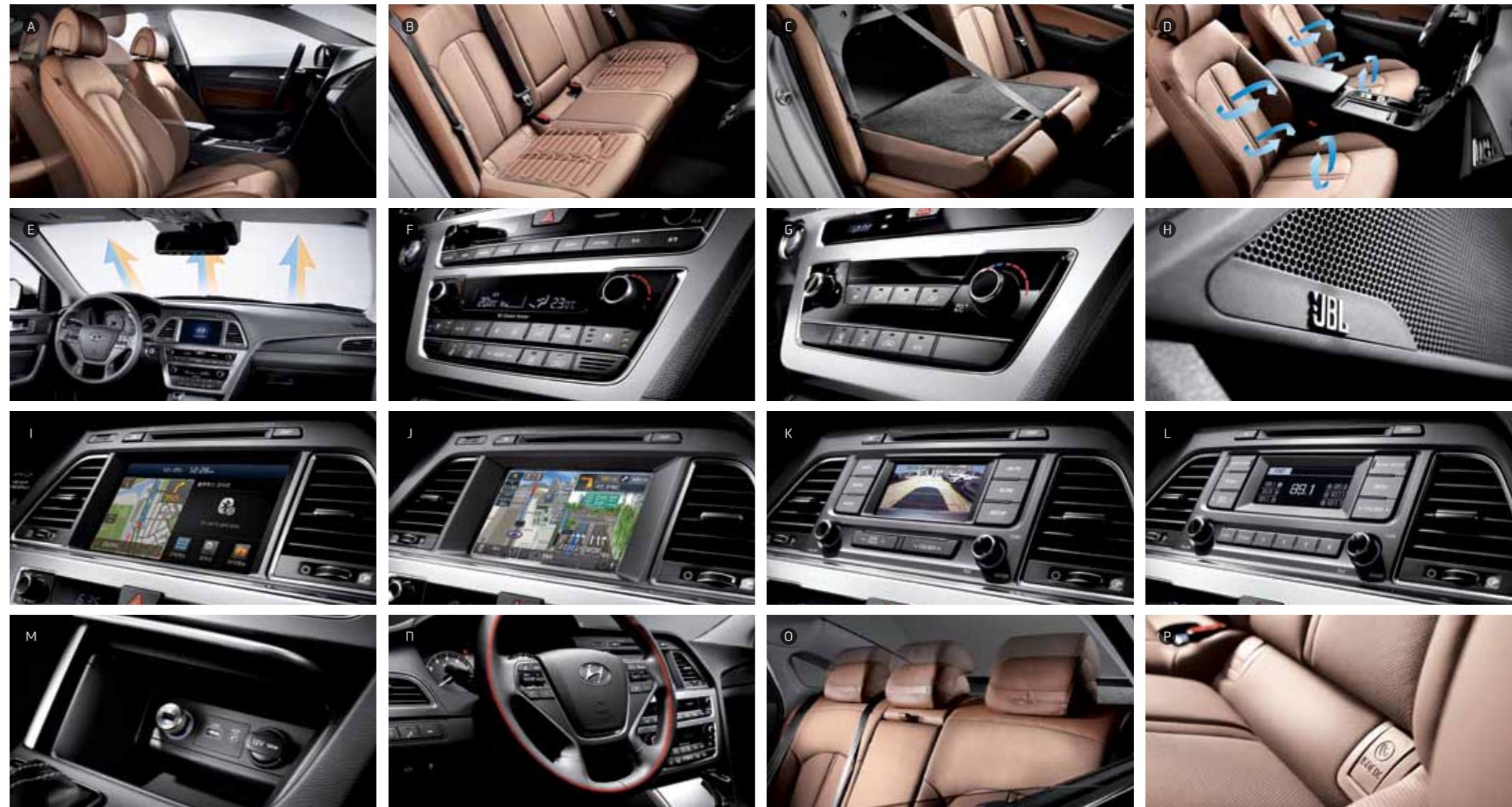
A. 동승석 전동시트(4WAY 럼버 서포트) E. 오토 디프로그 I. 8인치 스마트 내비게이션(블루링크 2.0) M. USB 충전기