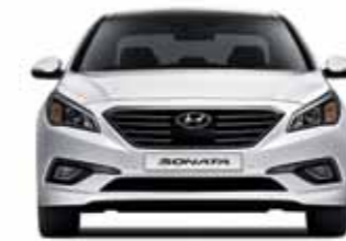
윤거 전 1,597