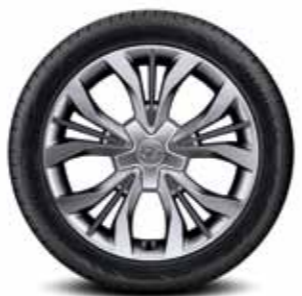
235/45R18 타이어 & 18인치 알로이 휠