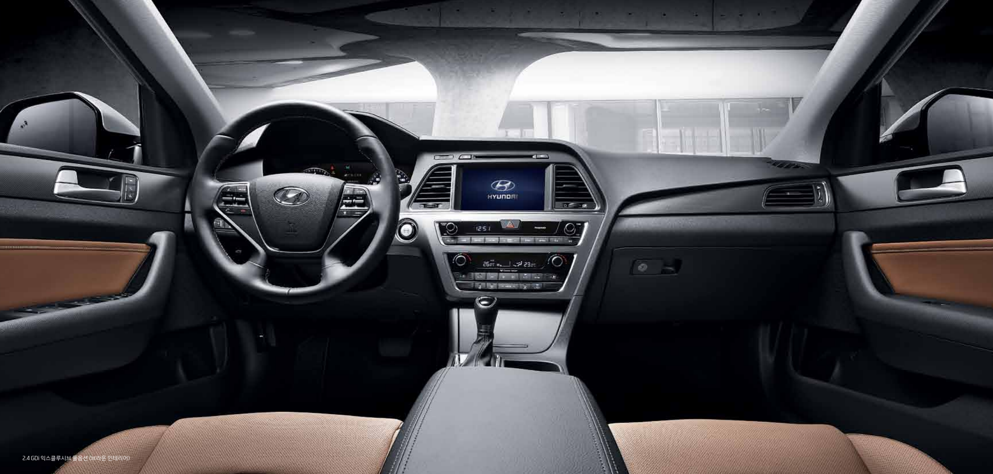
2.4 GDI 익스클루시브 풀옵션 (브라운 인테리어)