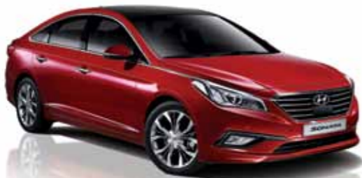
2.0 CVL 프리미엄 풀옵션 (레밍턴 레드)