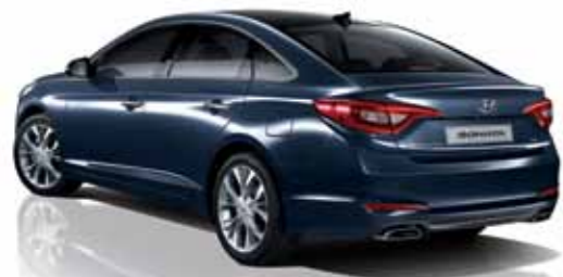
2.4 GDi 익스클루시브 풀옵션 (나이트 스카이)