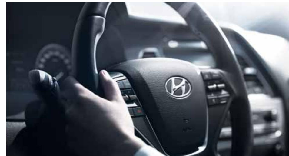
올은 방향의 진화, 쏘나타

자동차 안에 있는 수십 개의 스위치를 누르는 손끝의 작은 느낌까지 편안하고 즐거운 경험이 될 수 있도록, 이해와 사용이 쉽고 감성적인 즐거움을 주도록 HMI(Human Machine Interface)를 기반으로 개발된 쏘나타의 인테리어. 최적의 조작 거리를 유지할 수 있도록 핸드 리치 존(Hand reach zone)을 고려한 스위치와 화면은 물론, 운전자를 배려하는 쏘나타의 정성은 모든 부품 하나하나에 깃들어 있습니다.