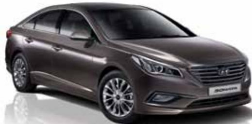
2.0 CVL 스마트 (다크 호스)