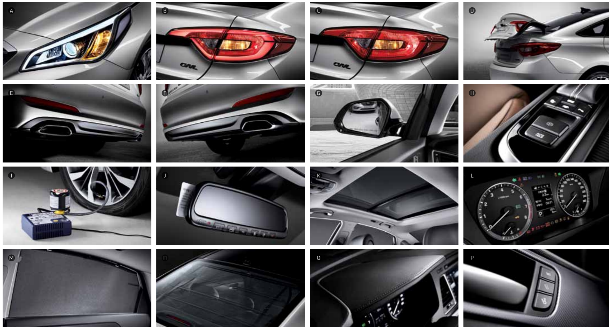
A. HID 헤드램프(오토레벨링, 스테틱 밴딩 라이트) E. 노출형 듀얼팁 머플러 I. 타이어 리페어 키트 M. 뒷좌석 매뉴얼 사이드 커튼