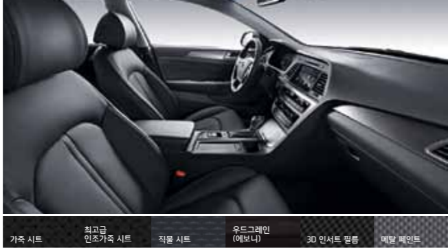
가죽 시트 최고급 인조가죽 시트 직물 시트 우드그레인 (에보나) 3D 인서트 필름 메탈 페인트