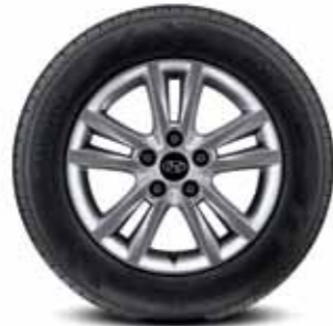
205/65R16 타이어 & 16인치 알로이 휠