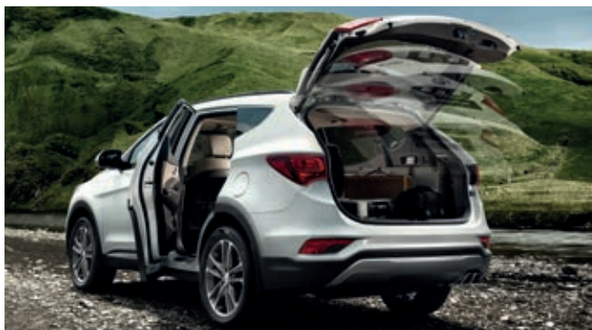
Portón trasero con sistema “manos libres”. Sensores detectan la proximidad y presencia del conductor que porta la llave y abren el portón automáticamente para ofrecer acceso sin esfuerzo a la zona de carga.

El nuevo Santa Fe ofrece una gama de soluciones inteligentes que facilitan los retos de la conducción diaria. Gracias a su tecnología de vanguardia se facilita el aparcamiento en espacios reducidos, y el portón trasero, con sistema de apertura “manos libres”, da acceso a la generosa zona de carga, de hasta 1.680 litros con los asientos traseros abatidos. Queda claro que el nuevo Santa Fe tiene sitio para todo.