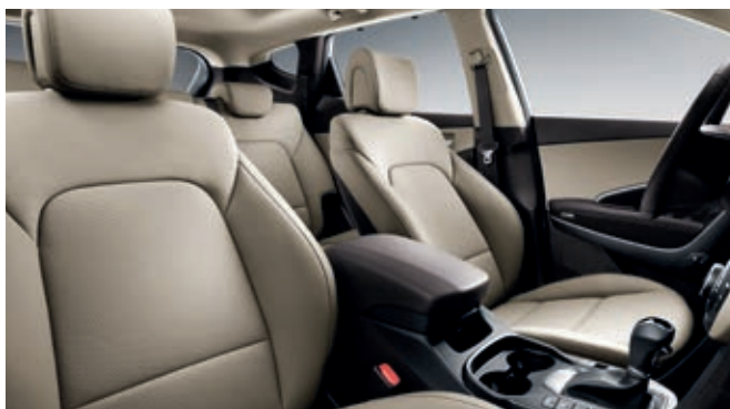
Cuero beige, en dos tonos (también disponible en tela)