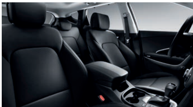
Cuero negro (también disponible en tela)