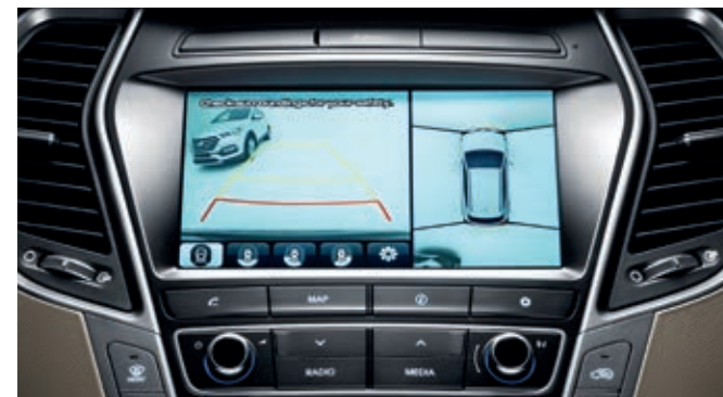
Monitor de visión periférica. Maniobrar en espacios reducidos es más fácil gracias a las cámaras ubicadas estratégicamente para proporcionar una perspectiva de 360 grados del entorno del vehículo.