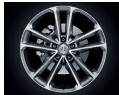
Llantas de aleación 19"