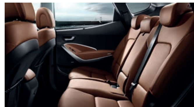
Más espacio para las piernas. Los pasajeros en la segunda fila pueden disfrutar de aún más espacio para estirar las piernas, pudiendo ganar hasta 270mm extras corriendo los asientos hacia atrás.