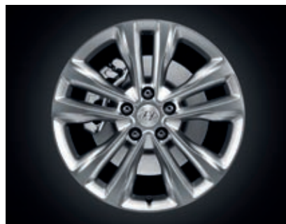
Llantas de aleación 18"