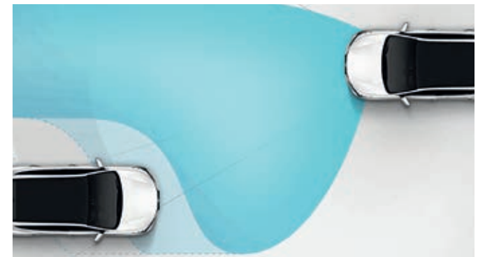
Sistema activo de luces largas (HBA, High Beam Assist). Cuando se detectan vehículos delante del nuestro, los faros automáticamente cambian de largas a cortas para evitar deslumbrar a los otros conductores.