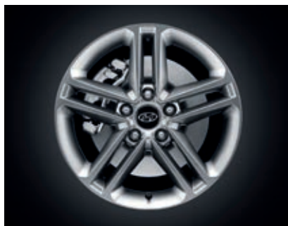
Llantas de aleación 17"