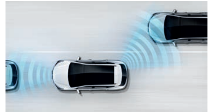
Sistema de detección de ángulo muerto (BSD, Blind Spot Detection). Sensores integrados en la parte trasera del coche detectan cualquier vehículo que se puede encontrar en el ángulo muerto y emiten un aviso sonoro si se acciona un intermitente.