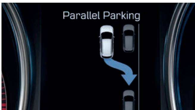
Asistencia al aparcamiento Inteligente (SPAS, Smart Parking Assist System). Mediante los sensores se identifica una plaza de aparcamiento factible, y luego guían al Santa Fe para ocupar la plaza perfectamente, incluso para aparcarse en batería. Tú controlas el acelerador y el freno, y el Sistema hace todo lo demás.