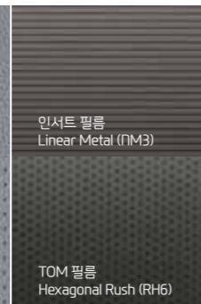
인서트 필름 Linear Metal (PM3)