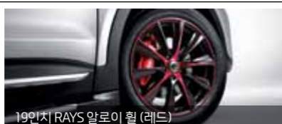
19인치 RAYS 알로이 휠 (레드)