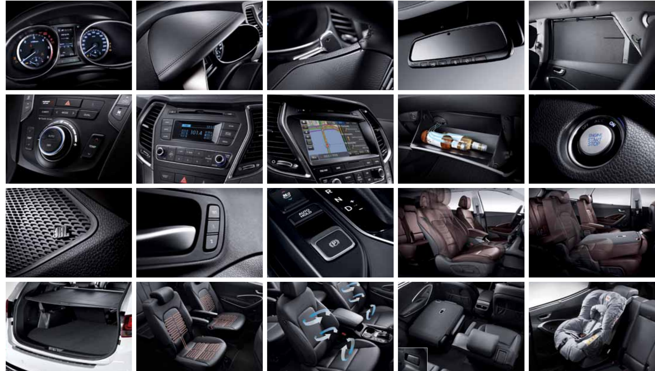
슈퍼비전 클러스터 듀얼 풀 오토 에어컨 JBL 사운드 시스템 러기지 스크린