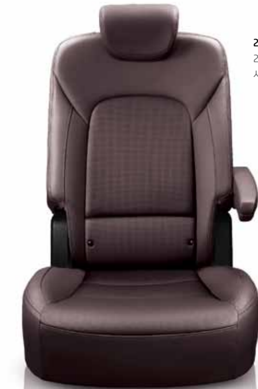
2열 캡틴시트 (6인승 전용) 2열의 좌/우측 좌석을 독립적으로 사용할 수 있습니다.

다이내믹한 볼륨감에 섬세한 감성을 더해 완벽해진 스타일에 고급스러운 인테리어와 디테일을 더하는 실용적인 편의사양으로 차세대 대형 SUV로서의 고품격 감성을 구현하였습니다.