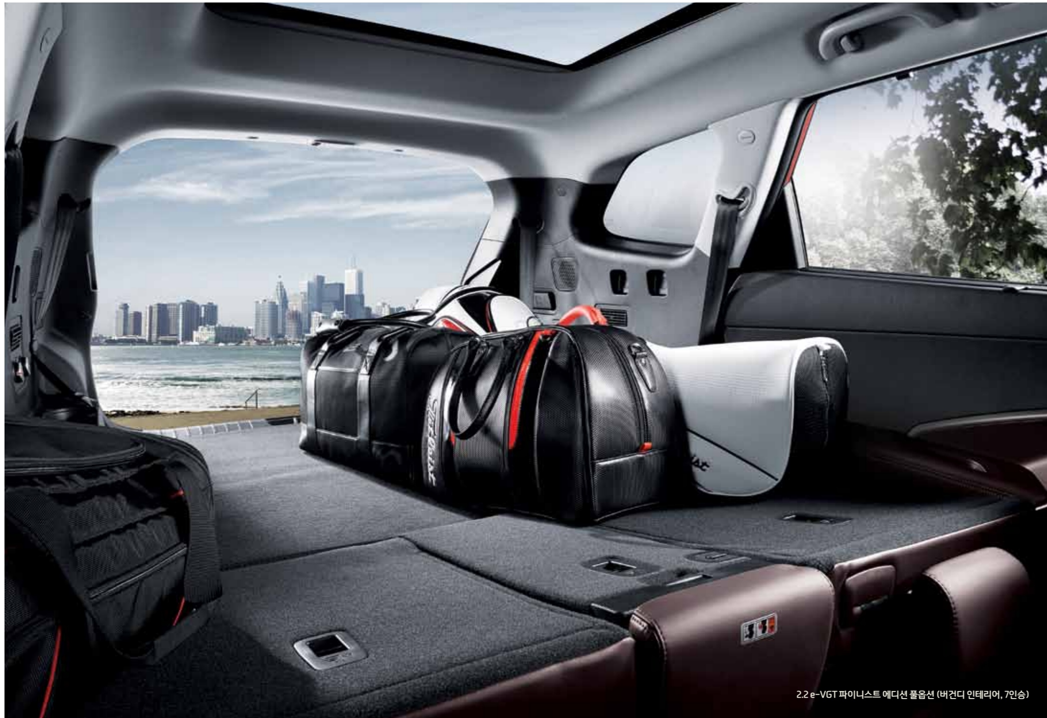
2.2e-VGT 파이니스트 에디션 풀옵션 (버건디 인테리어, 7인승)