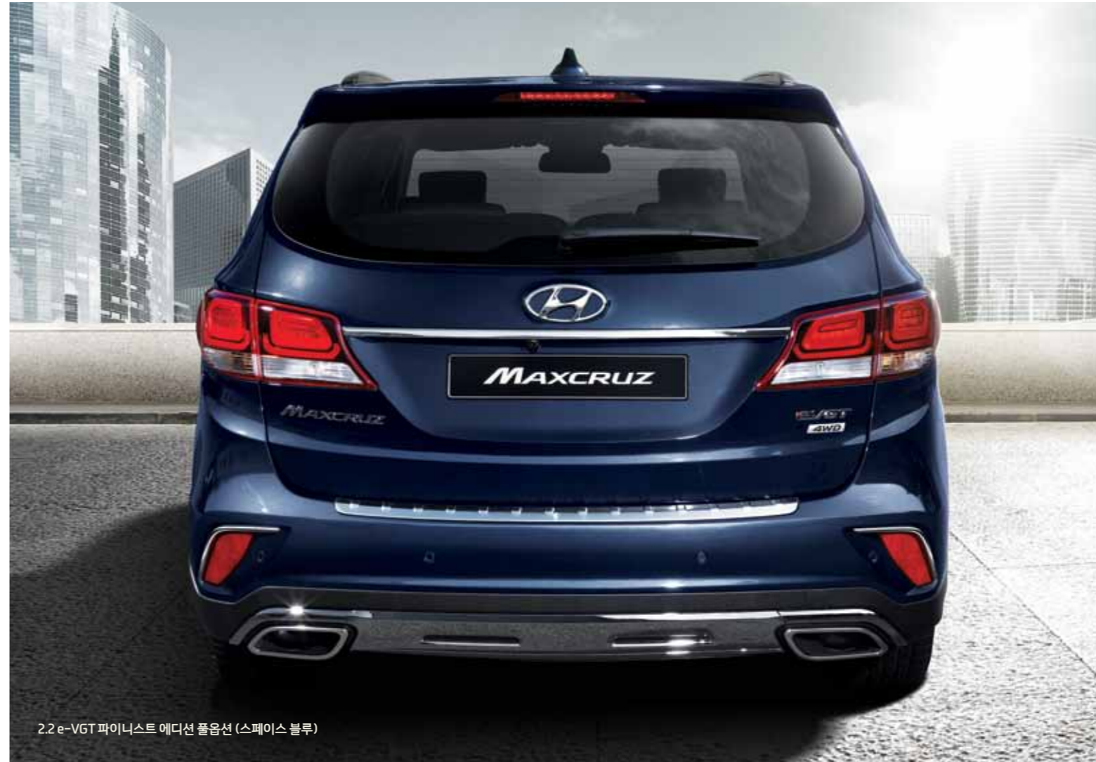
2.2 e-VGT 파이니스트 에디션 풀옵션 (스페이스 블루)

다이나믹한 볼륨감과 감성적인 디테일을 더해 고급스럽고 감각적인 맥스크루즈만의 스타일을 구현하였습니다. 완전히 새로워진 디자인의 차세대 대형 SUV, 맥스크루즈를 통해 당신의 스타일이 한 단계 업그레이드 됩니다.