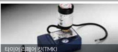
타이어 리페어 키트(TMK)