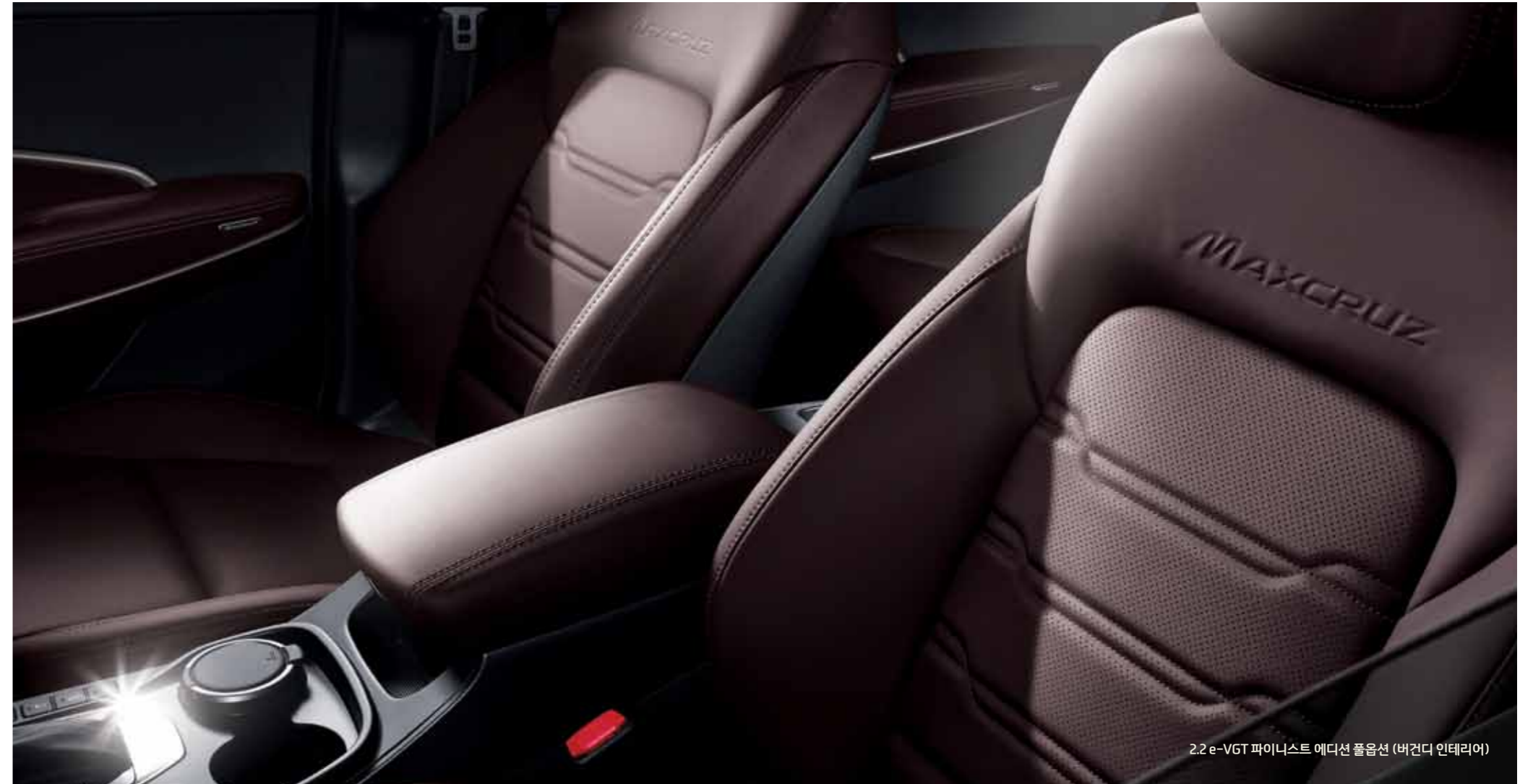
2.2 e-VGT 파이니스트 에디션 풀옵션 (버건디 인테리어)