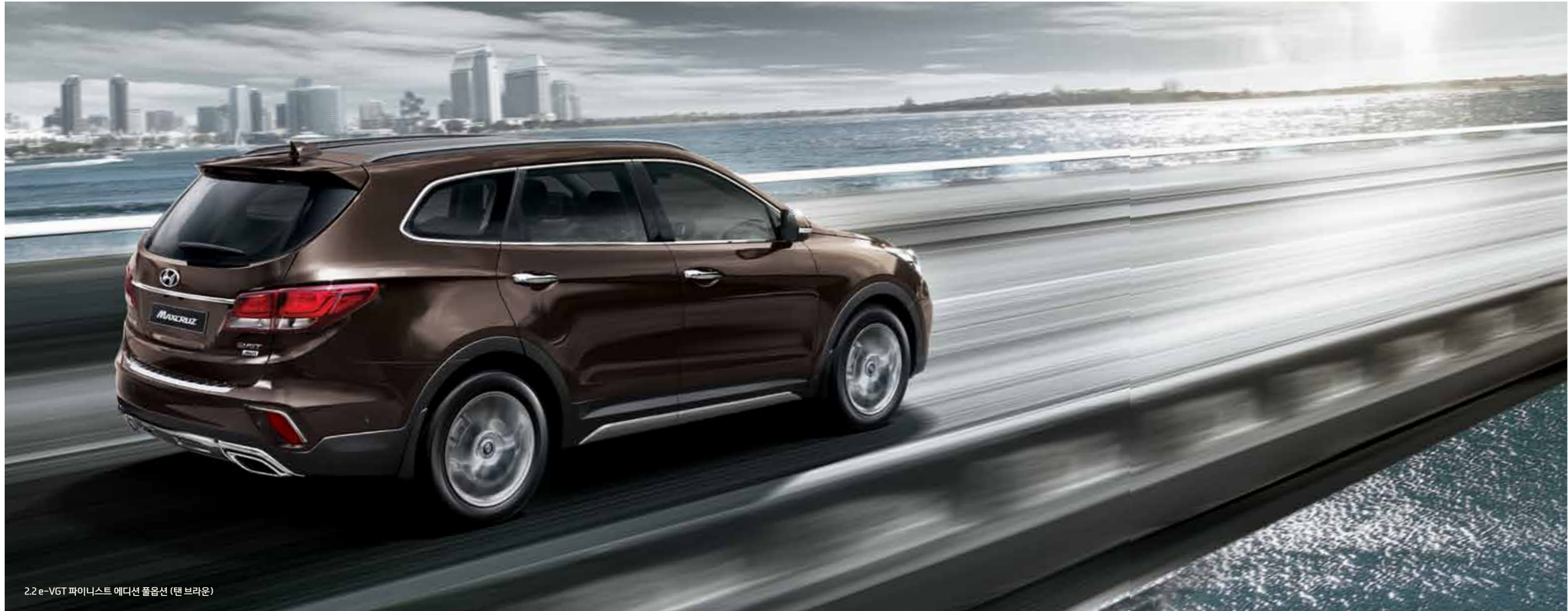
2.2e-VGT 파이니스트 에디션 풀옵션 (탠 브라운)