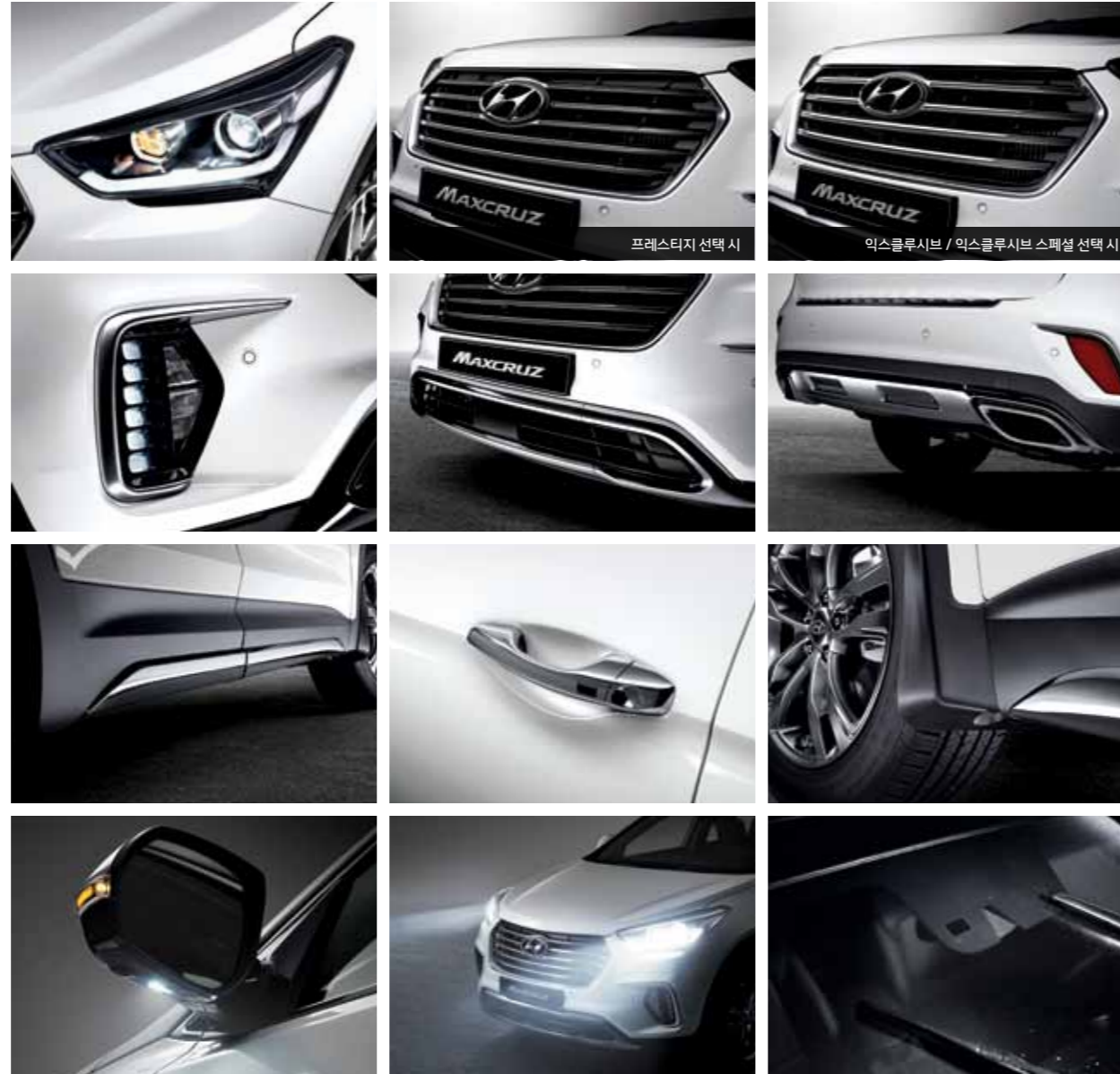
바이핑션 HID 헤드램프 LED 주간주행등 (DRL) 다크크롬 사이드 도어 가나쉬 퍼들램프