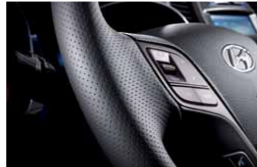
스티어링 휠에 반편칭 가죽을 더하여 고급스러움은 물론, 그립감을 높여 더욱 안전하고 즐거운 주행을 완성한 반편칭 스티어링 휠

운전자가 온전히 주행에 몰입할 수 있도록 실용적인 디테일에 감성을 더해 운전의 즐거움을 극대화해주는 맥스크루즈