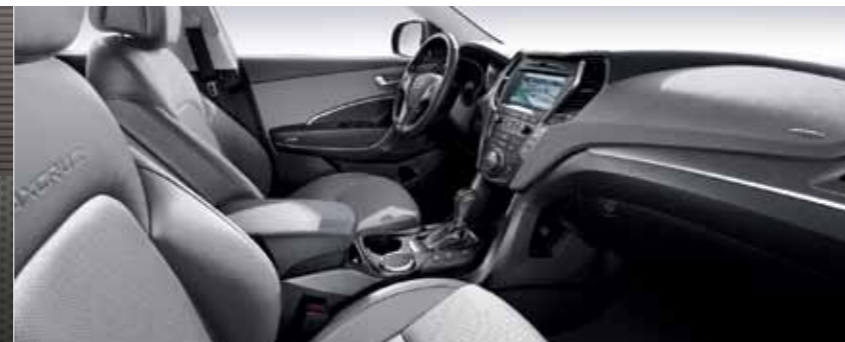
TOM 필름 Hexagonal Rush (RH6)