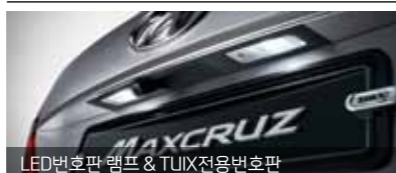
LED번호판 램프 & TUUX전용번호판