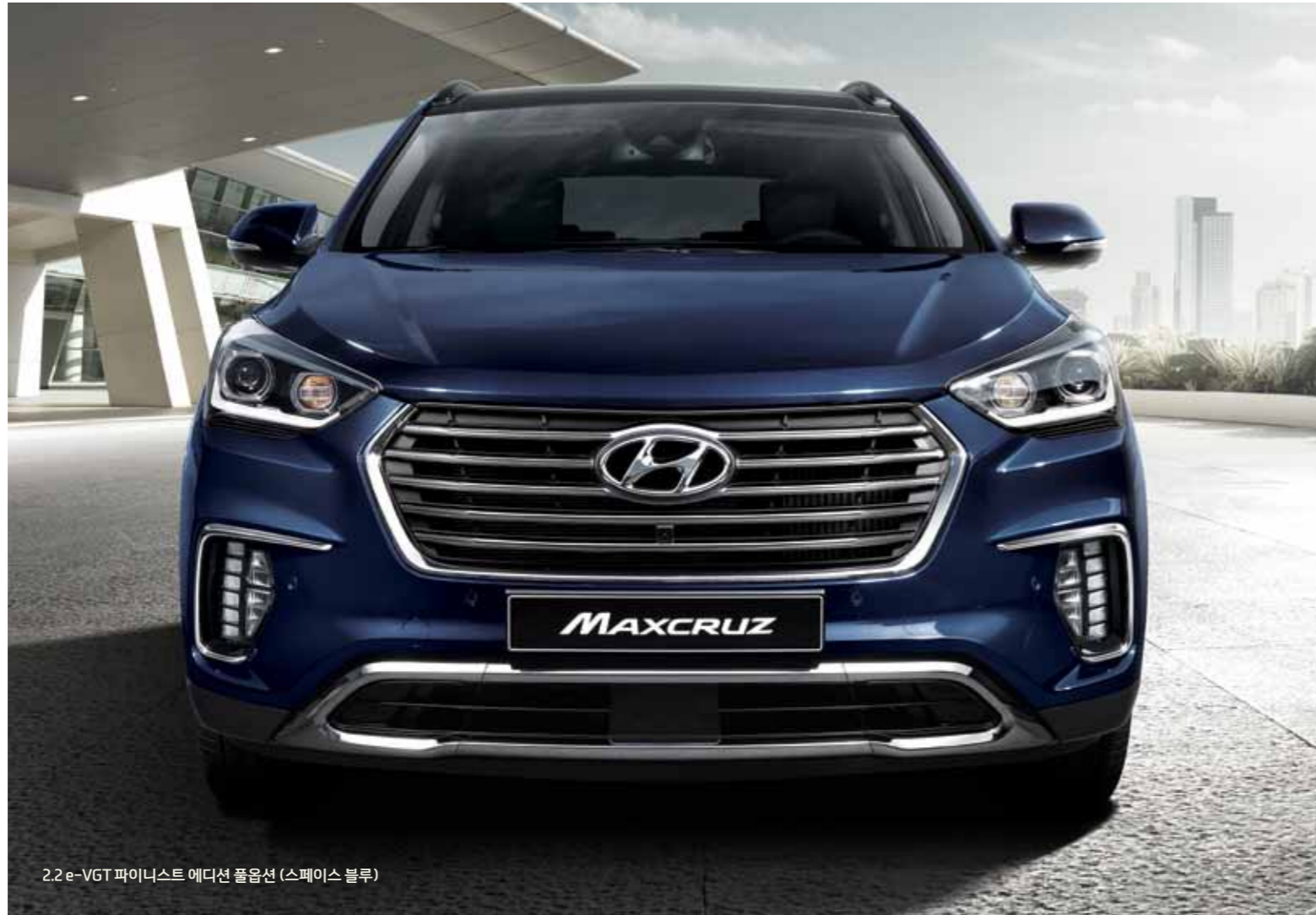
2.2 e-VGT 파이니스트 에디션 풀옵션 (스페이스 블루)