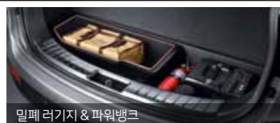
밀폐 라기지 & 파워뱅크