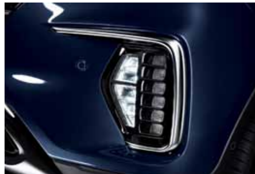
바이펑션 HID 헤드램프 신형 라디에이터 그릴 (다크 크롬) LED 전면 안개등