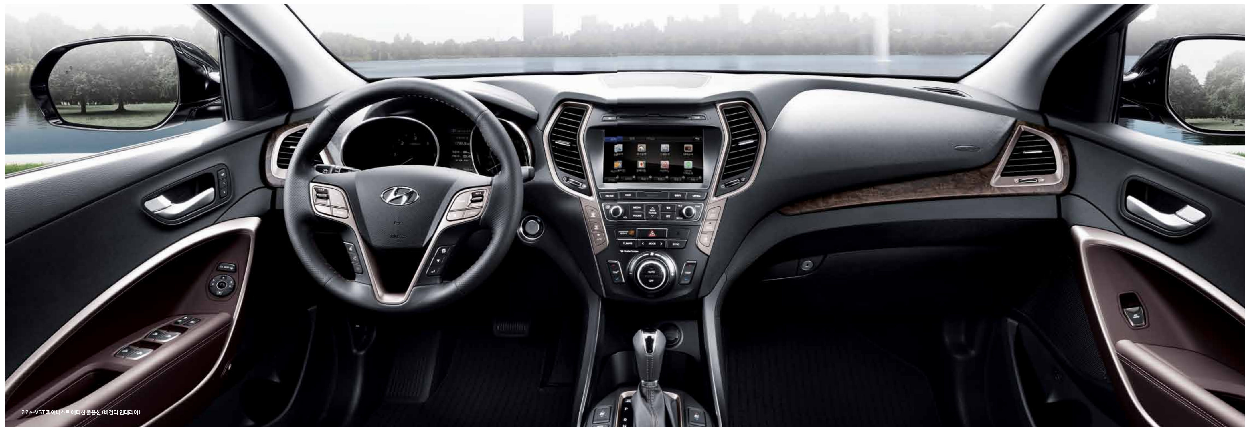
2.2 e-VGT 파이니스트 에디션 풀옵션 (버건디 인테리어)