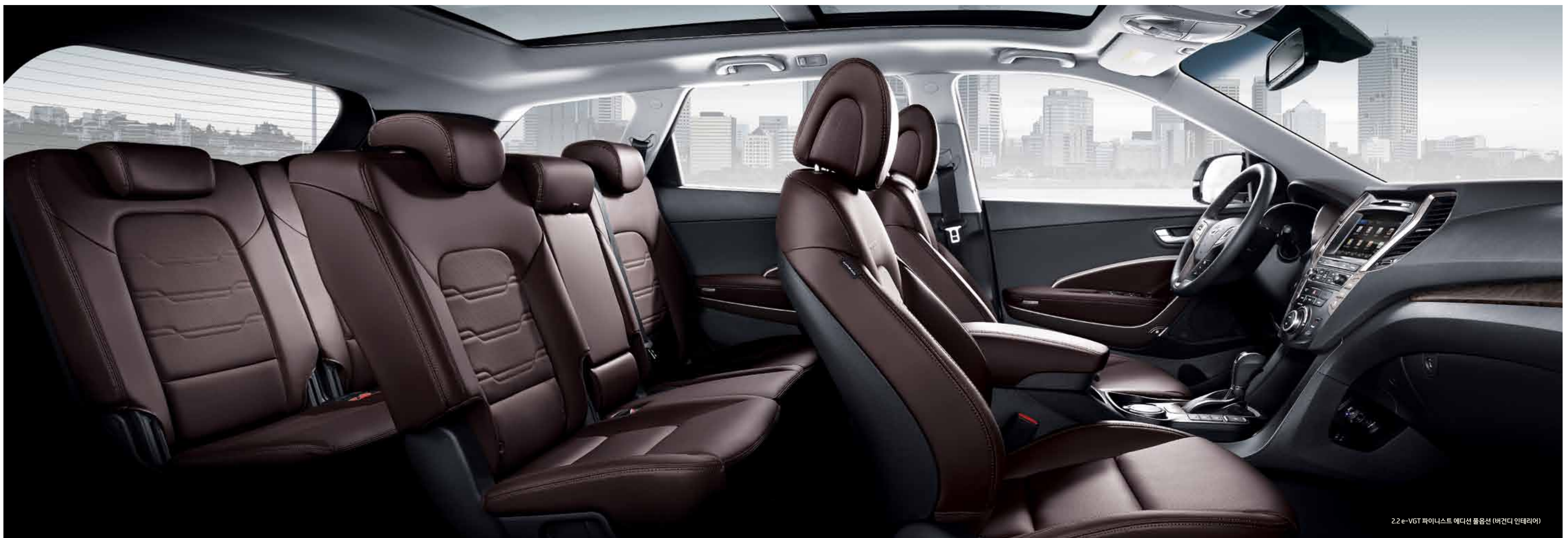
2.2 e-VGT 파이니스트 에디션 풀옵션 (버건디 인테리어)