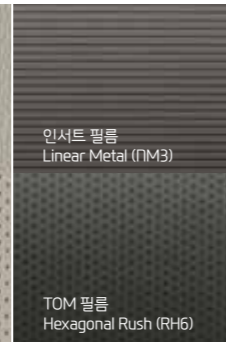
인서트 필름 Linear Metal (PM3)