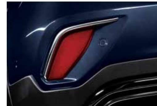
LED 리어 콤비램프 리어 범퍼 스텝 후부 반사기 (리어 리플렉터)