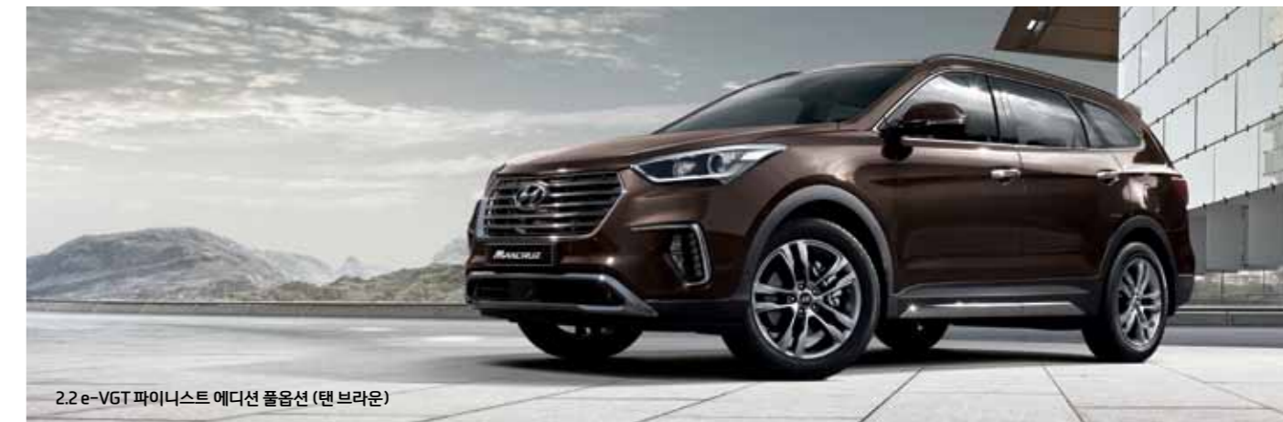
2.2 e-VGT 파이니스트 에디션 풀옵션 (탠 브라운)