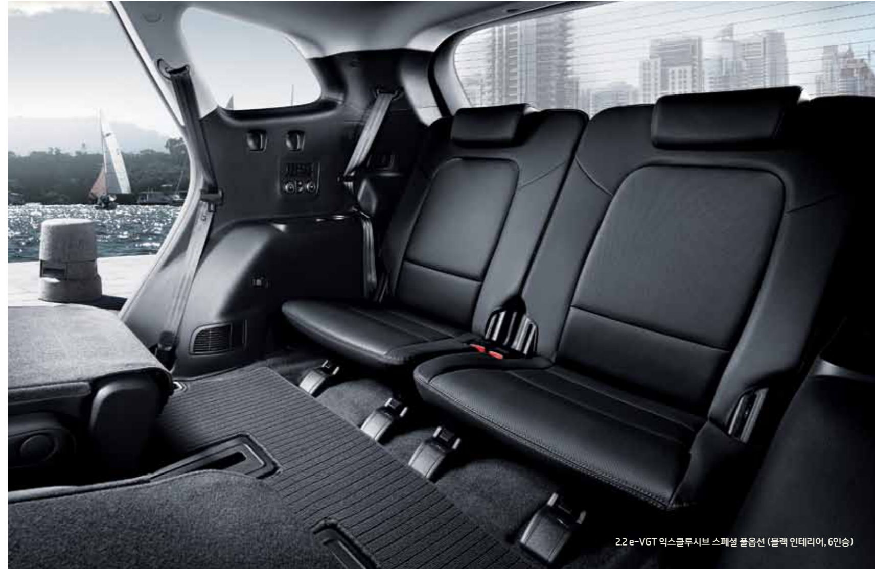
2.2 e-VGT 익스클루시브 스페셜 풀옵션 (블랙 인테리어, 6인승)

좌측석, 우측석을 앞뒤로 독립적으로 움직일 수 있어 3열 탑승이 더욱 용이하고 다양한 크기의 짐도 더 편리하게 실을 수 있습니다.