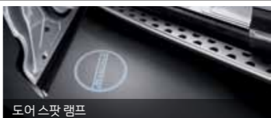
도어 스팟 램프