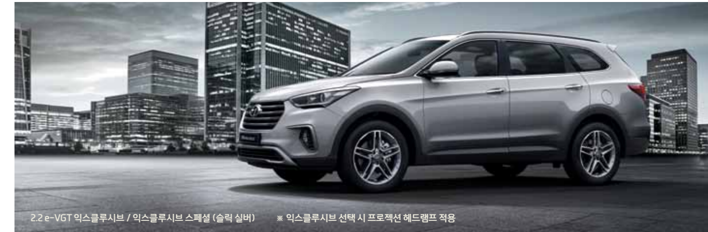
2.2 e-VGT 익스클루시브 / 익스클루시브 스페셜 (슬릭 실버) ※ 익스클루시브 선택 시 프로젝션 헤드램프 적용