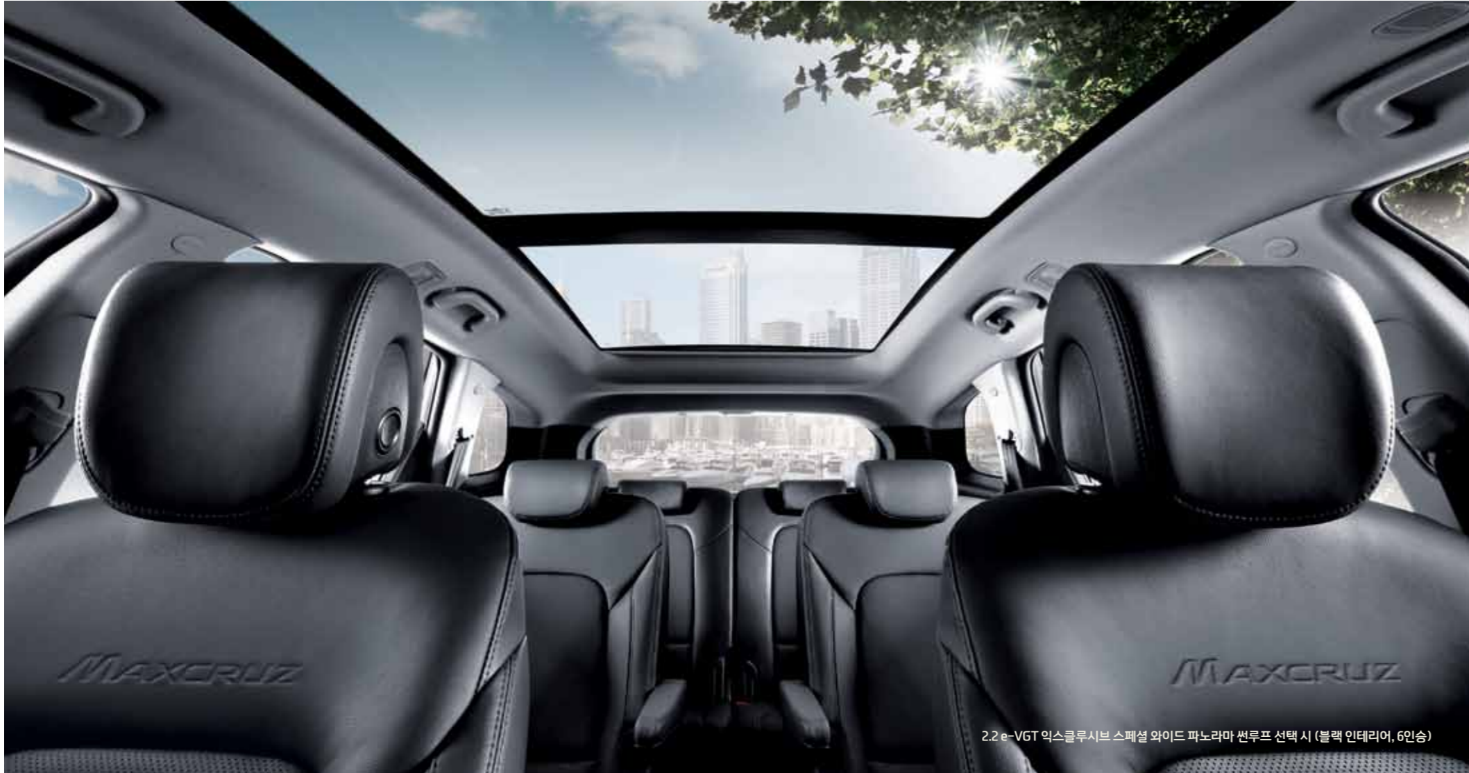
2.2 e-VGT 익스클루시브 스페셜 와이드 파노라마 선루프 선택 시 (블랙 인테리어, 6인승)