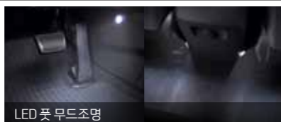
LED 풋 무드조명