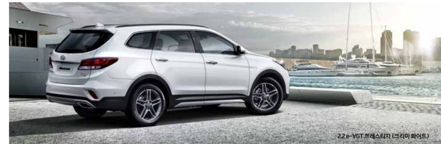
2.2 e-VGT 프레스티지 (크림 화이트)