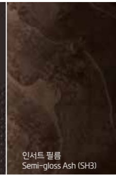
인서트 필름 Semi-gloss Ash (SH3)