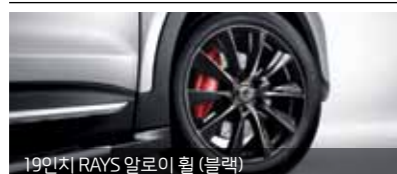
19인치 RAYS 알로이 휠 (블랙)