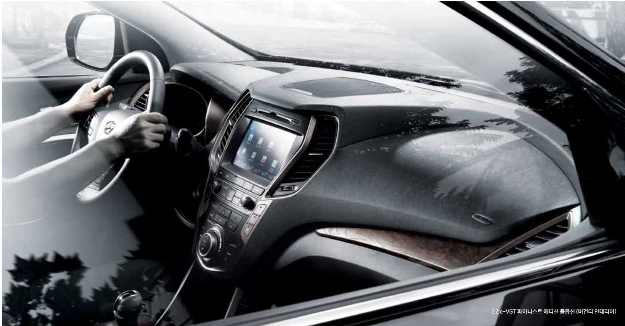
2.2 e-VGT 파이니스트 에디션 풀옵션 (버건디 인테리어)