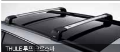
THULE 루프 크로스바