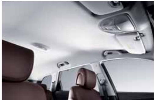
프리미엄이 느껴지는 파이니스트 에디션을 더욱 특별하게 만들어주는 모던한 감성의 트리코트 스웨이드 내장재

품격 있는 리조트에서 휴식을 취하는 듯한 여유로움으로 편안함을 극대화해주는 맥스크루즈