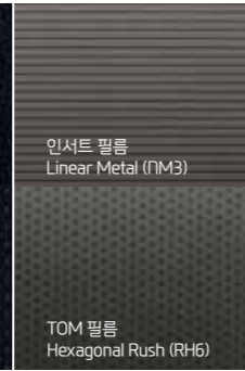
인서트 필름 Linear Metal (PM3)