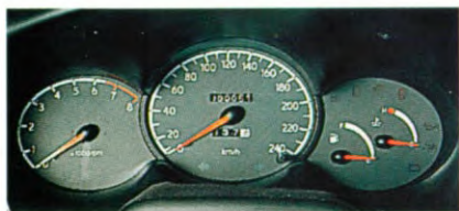
Wit op grijs: het instrumentenpaneel is even fraai als functioneel