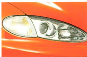
Slanke en rondlopende koplampen passen naadloos in de carrosserie