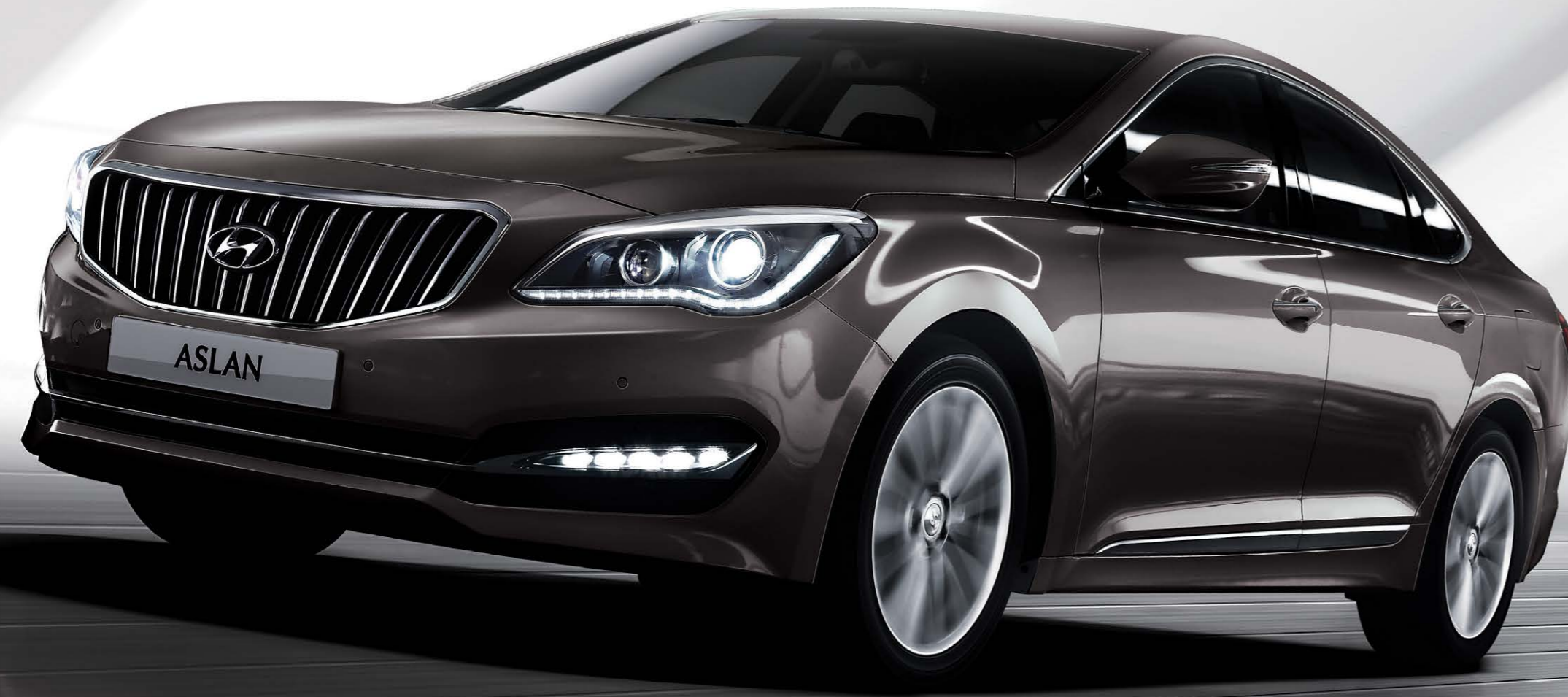
G300 모던 [다크호스]

최첨단 기술이 집약된 V6 GDi 엔진으로 구현한 탁월한 성능, 소음과 진동의 최소화로 구현한 정숙성과 정교한 주행감