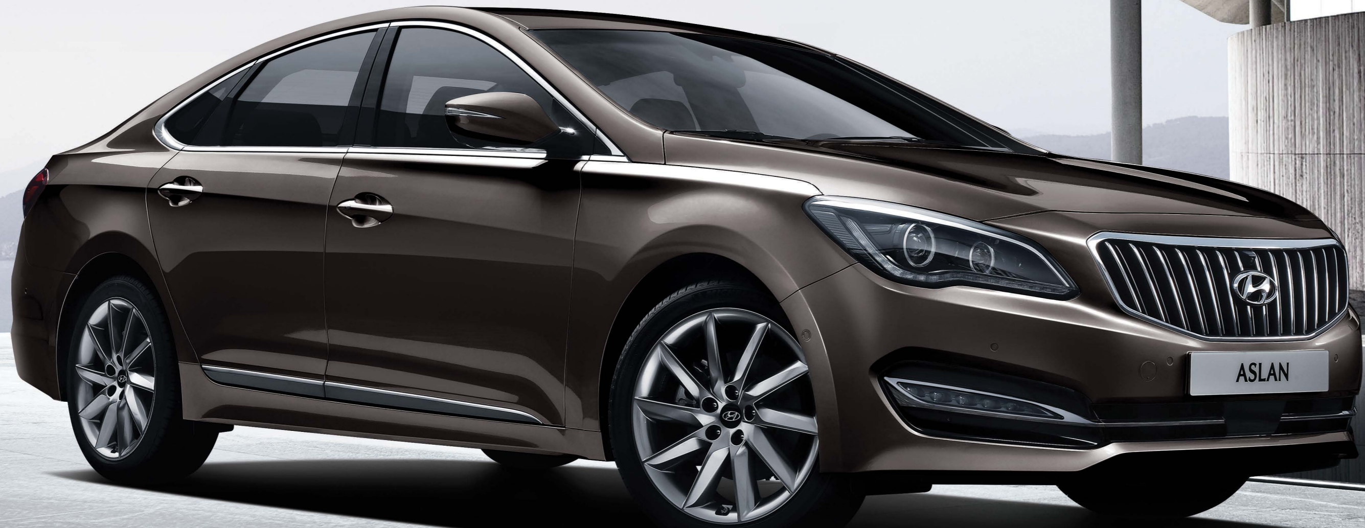
G330 익스클루시브_이지파크 패키지, 드라이빙 어시스트 패키지2 선택 시 [다크호스]