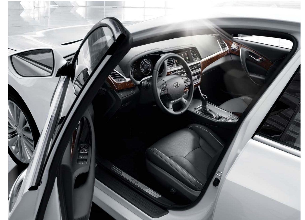
G300 모던_프리미엄 패키지 선택 시 [아이스화이트 / 블랙모노 인테리어]

편안하고 안정적인 주행감과 최상의 정숙함을 동시에 누리는 즐거움, 컴포트 드라이빙을 재정의하다.