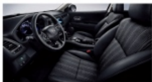
组合黑(豪华版、精英版)