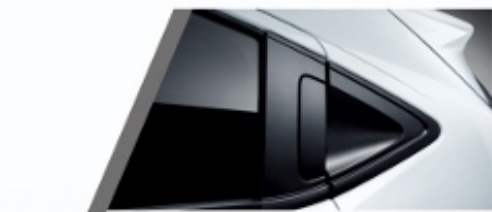
隐藏式后门外拉手