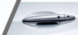
质感奢华的前门外拉手