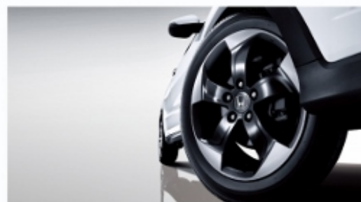
锋芒硬朗的17寸切削熏黑轮毂