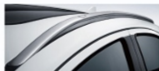
彰显速度美感的车顶行李架