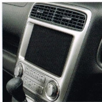
Dark Tone Interior Items