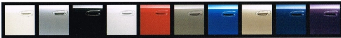
プレミアムホワイトパール ※ アラバスターシルバーメタリック ナイトホークブラックパール タフタフホワイト ミラノレッド キャラクーングレーメタリック ビビッドブルーパール ショアラインベージュメタリック ロイヤルブルーパール ミスティパープルパール