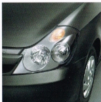
Dark Tone Exterior Items