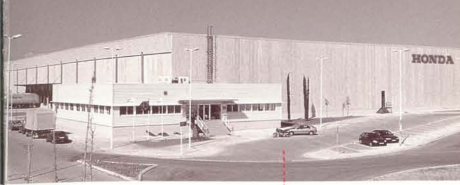
Centro regulador de recambios en Barcelona.