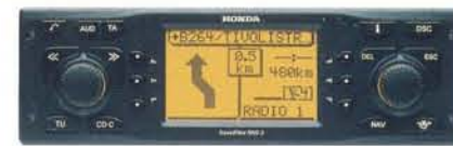
Radio CD Navegador RNS-3