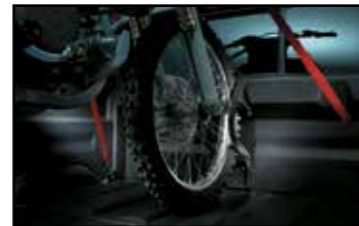
Soporte para rueda de motocicleta