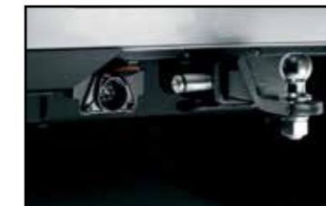
Bola de arrastre/seguro de enganche de remolque