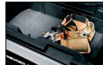
Tapete para compartimento de carga