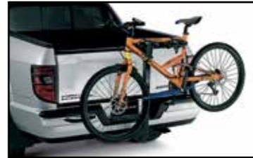
Aditamento posterior para bicicleta