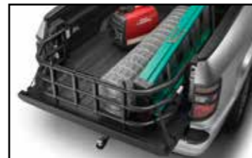
Extensión metálica para caja