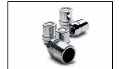
Birlos de seguridad