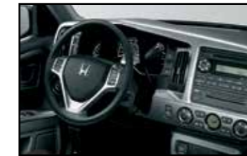
Kit de paneles color plata