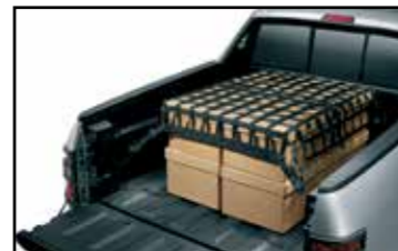
Red de carga para caja