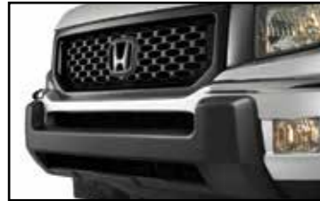
Extensión de defensa delantera