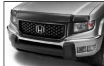
Deflector de aire frontal