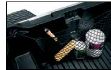
Red de carga