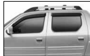
Deflector de aire para puertas