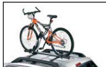
Aditamento superior para bicicleta