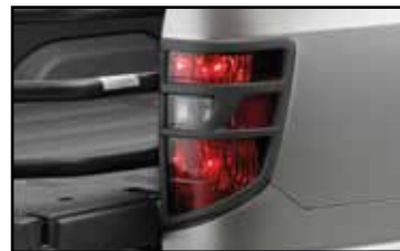
Adorno de direccionales traseras