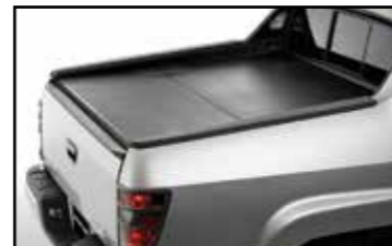
Cubierta dura para caja trasera