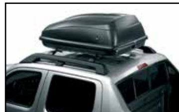
Caja portaequipaje (corta)