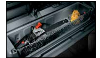
Compartimento de carga en asiento trasero