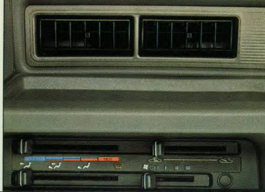
Verwarming/ventilatie met 3 standen aanjager. Aanvoer van verse lucht of circulatie van bestaande lucht in de auto.