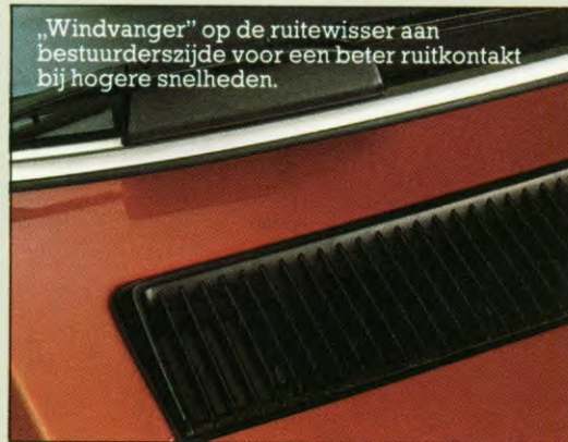
„Windvanger” op de ruitwischer aan bestuurderszijde voor een beter ruitcontact bij hogere snelheden.