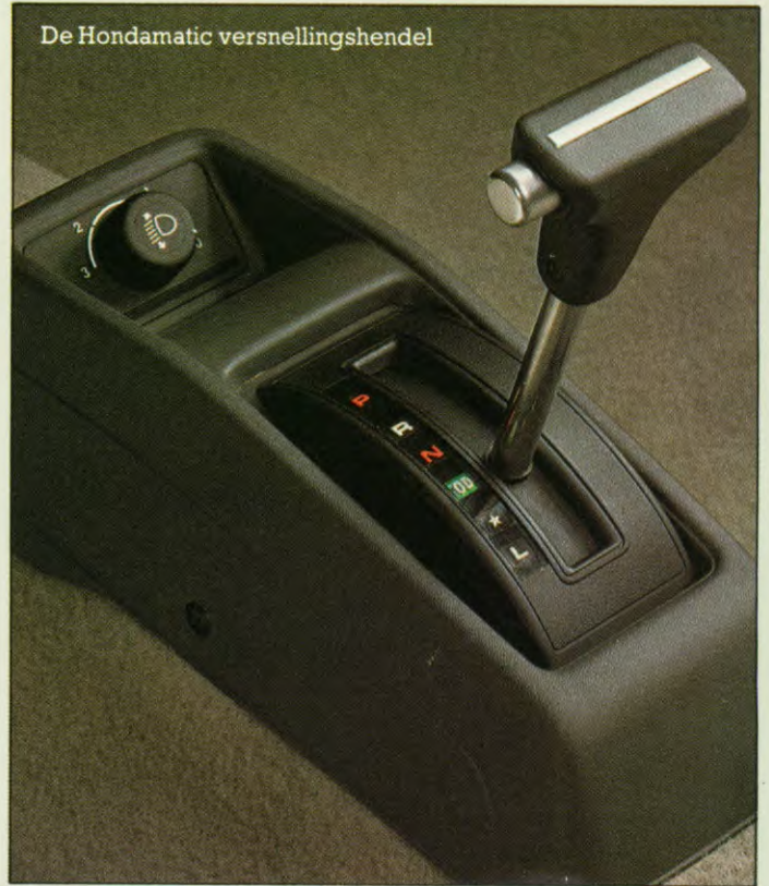
De Hondamatic versnellingshendel