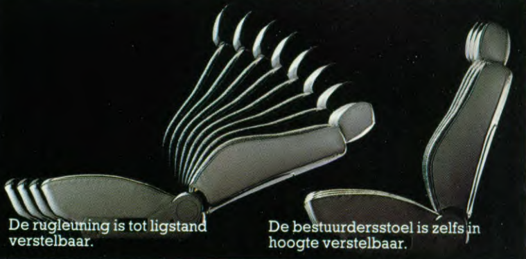
De rugleuning is tot ligstand verstelbaar.