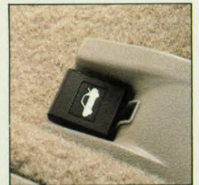
De 5e deur is vanaf de bestuurdersplaats te ontgrendelen.