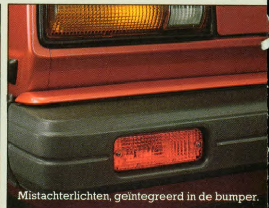
Mistachterlichten, geïntegreerd in de bumper.