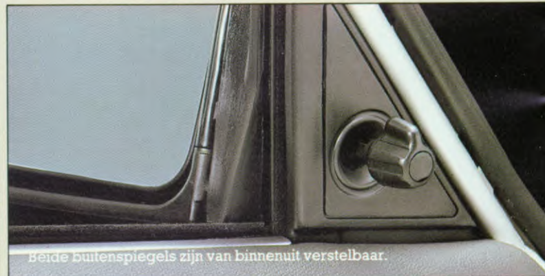
Beide buitenspiegels zijn van binnenuit verstelbaar.