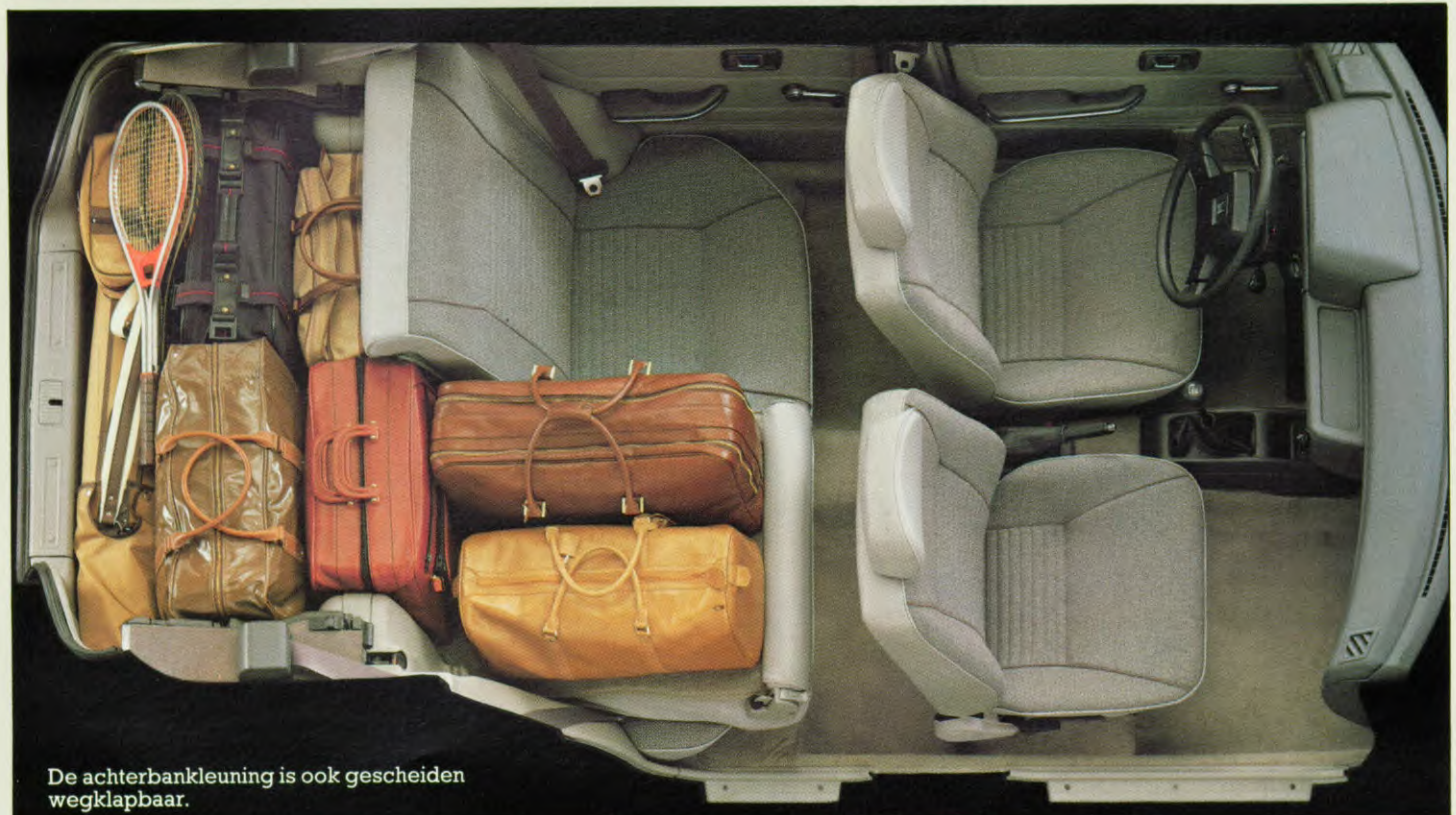
De achterbankleuning is ook gescheiden wegklapbaar.