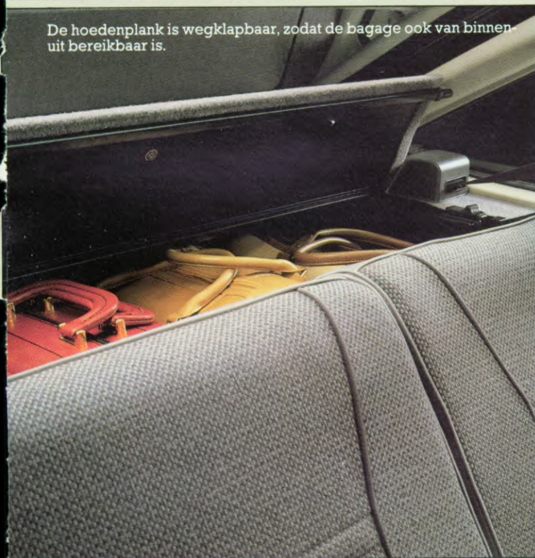
De hoedenplank is wegklapbaar, zodat de bagage ook van binnen uit bereikbaar is.