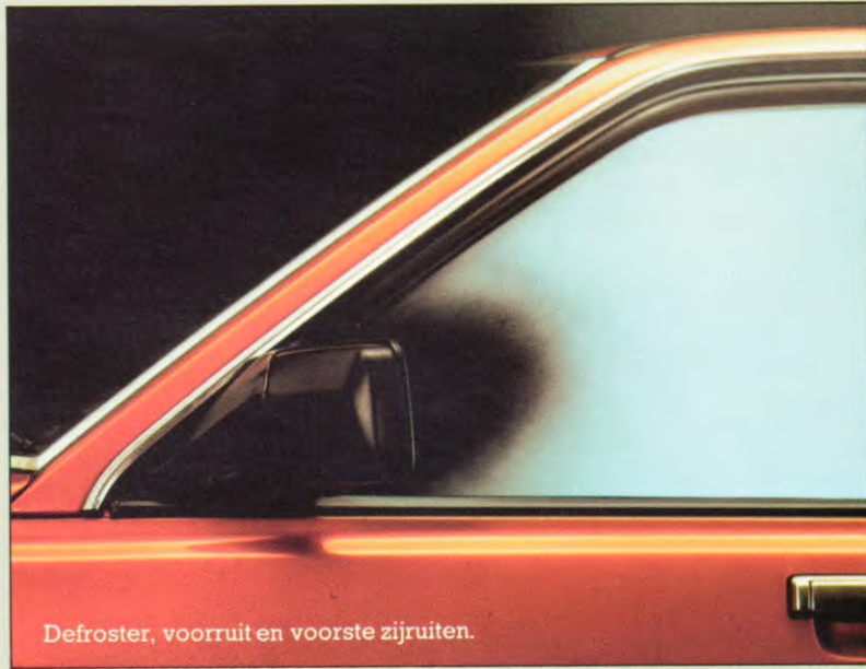
Defroster, voorruit en voorste zijruiten.