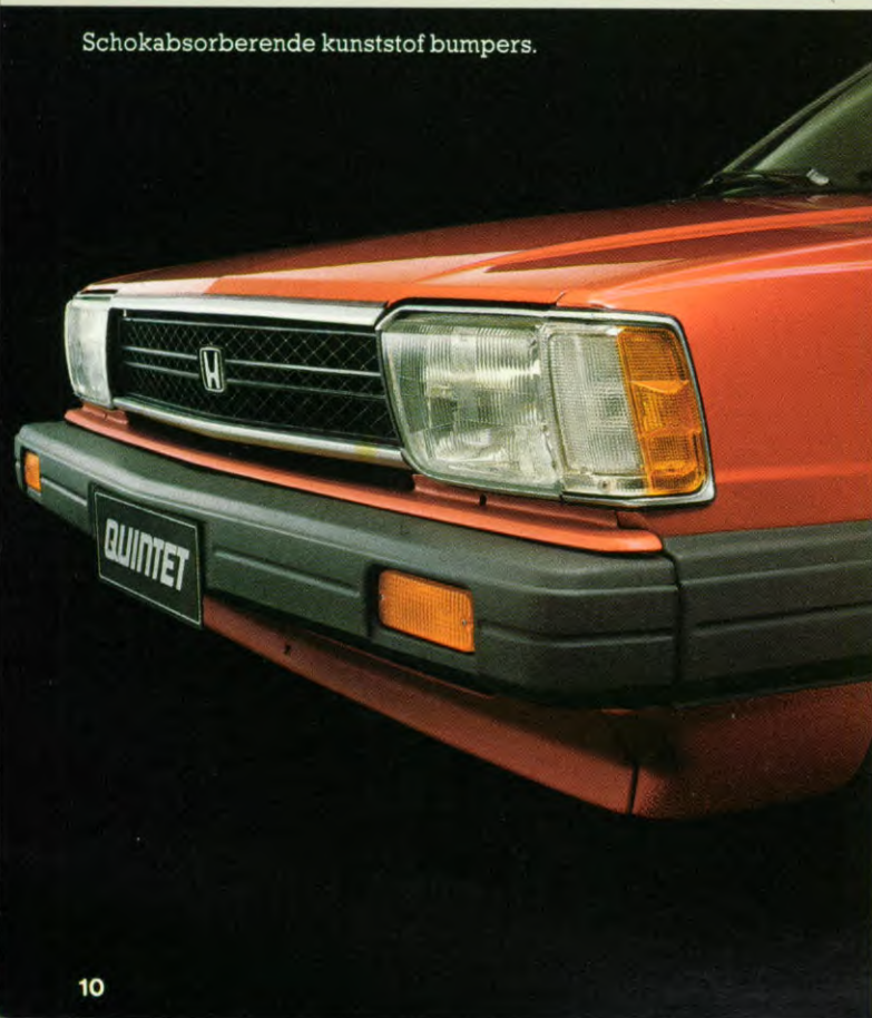
Schokabsorberende kunststof bumpers.