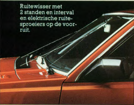
Ruitwischer met 2 standen en interval en elektrische ruitersproeiers op de voorruit.