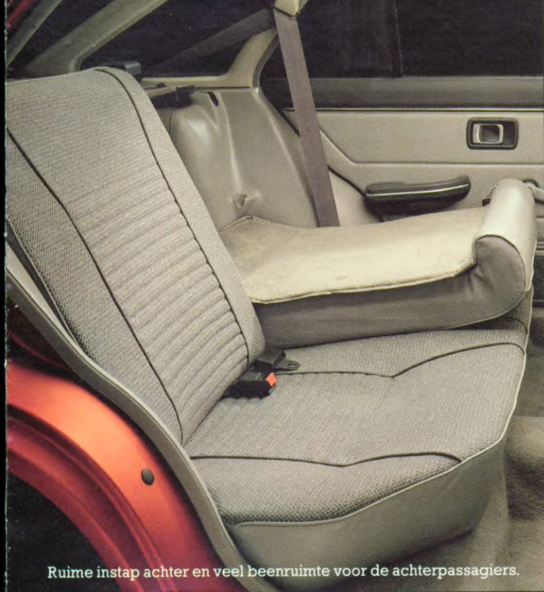
Ruime instap achter en veel beenruimte voor de achterpassagiers.