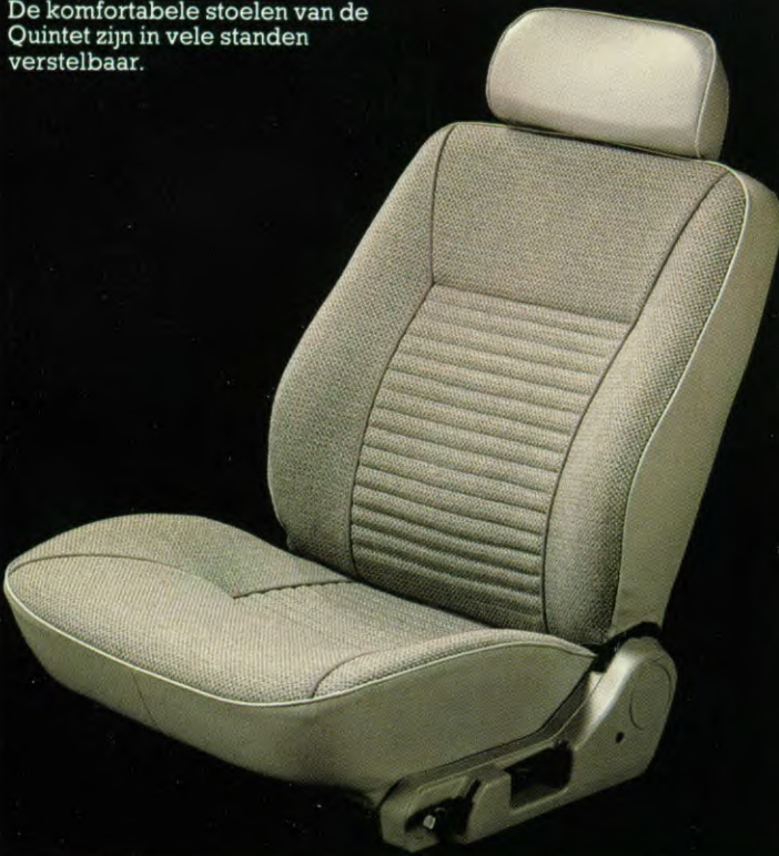
De comfortabele stoelen van de Quintet zijn in vele standen verstelbaar.