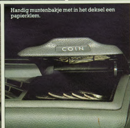
Handig muntenbakje met in het deksel een papierklem.