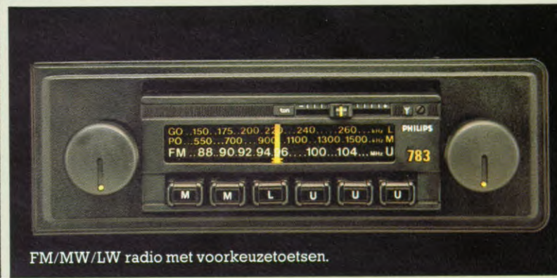
FM/MW/LW radio met voorkeuzetoetsen.