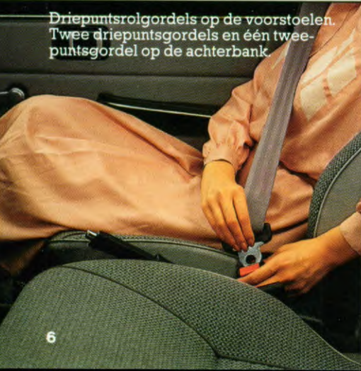
Driepuntsrolgordels op de voorstoelen. Twee driepuntsgordels en één tweepuntsgordel op de achterbank.