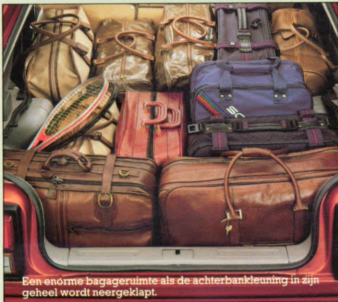
Een enorme bagageruimte als de achterbankleuning in zijn geheel wordt neergeklapt.

Een zeer belangrijke eigenschap van de Quintet: veel ruimte binnenin. Vijf mensen vinden een comfortabele plaats in de Quintet. Door de dwars voorin geplaatste motor is er veel beenruimte voor bestuurder en voorste passagier, zodat de voorstoelen niet ver naar achteren geschoven hoeven te worden. Dit betekent dat ook de achterpassagiers meer ruimte krijgen. Soms zou u een bestelwagen moeten hebben. In zo'n geval klapt u gewoon de achterbankleuning neer en heeft u een mooie vlakke laadvloer, wagenbreed gestoffeerd. Slimmigheidje: de rugleuning van de achterbank is ook in twee delen neerklapbaar. Zo kunt u zelfs èn een achterpassagier èn een aantal grote stukken bagage meenemen. De achterklep, die vanaf de bestuurdersplaats te openen is, noemen we de vijfde deur, omdat 'ie zo groot is. De breedte is bijna gelijk aan die van de auto en omdat 'ie bijna tot onderaan doorloopt kunt u alle bagage gemakkelijk op de vlakke laadvloer leggen.