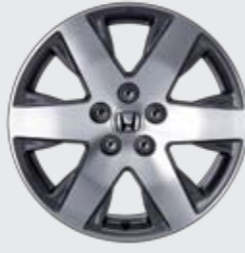
알로이 휠 (18인치)