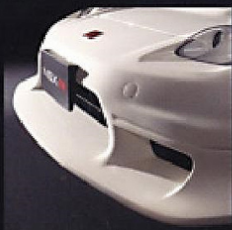
Carbon Fiber Front Bumper