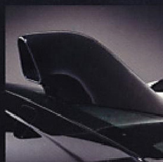
Rear Hatch Garnish