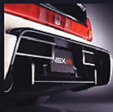
Carbon Fiber Rear Bumper