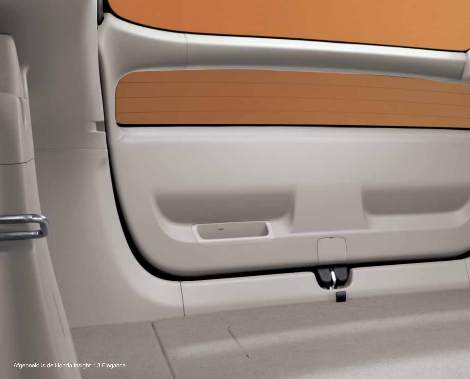
Afgebeeld is de Honda Insight 1.3 Elegance.