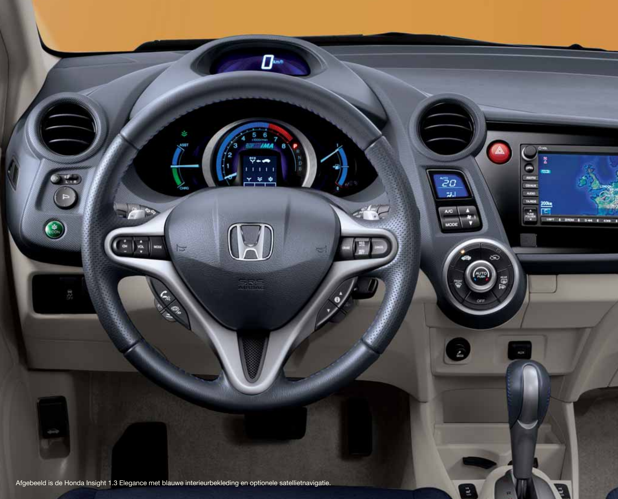
Afgebeeld is de Honda Insight 1.3 Elegance met blauwe interieurbekleding en optionele satellietnavigatie.