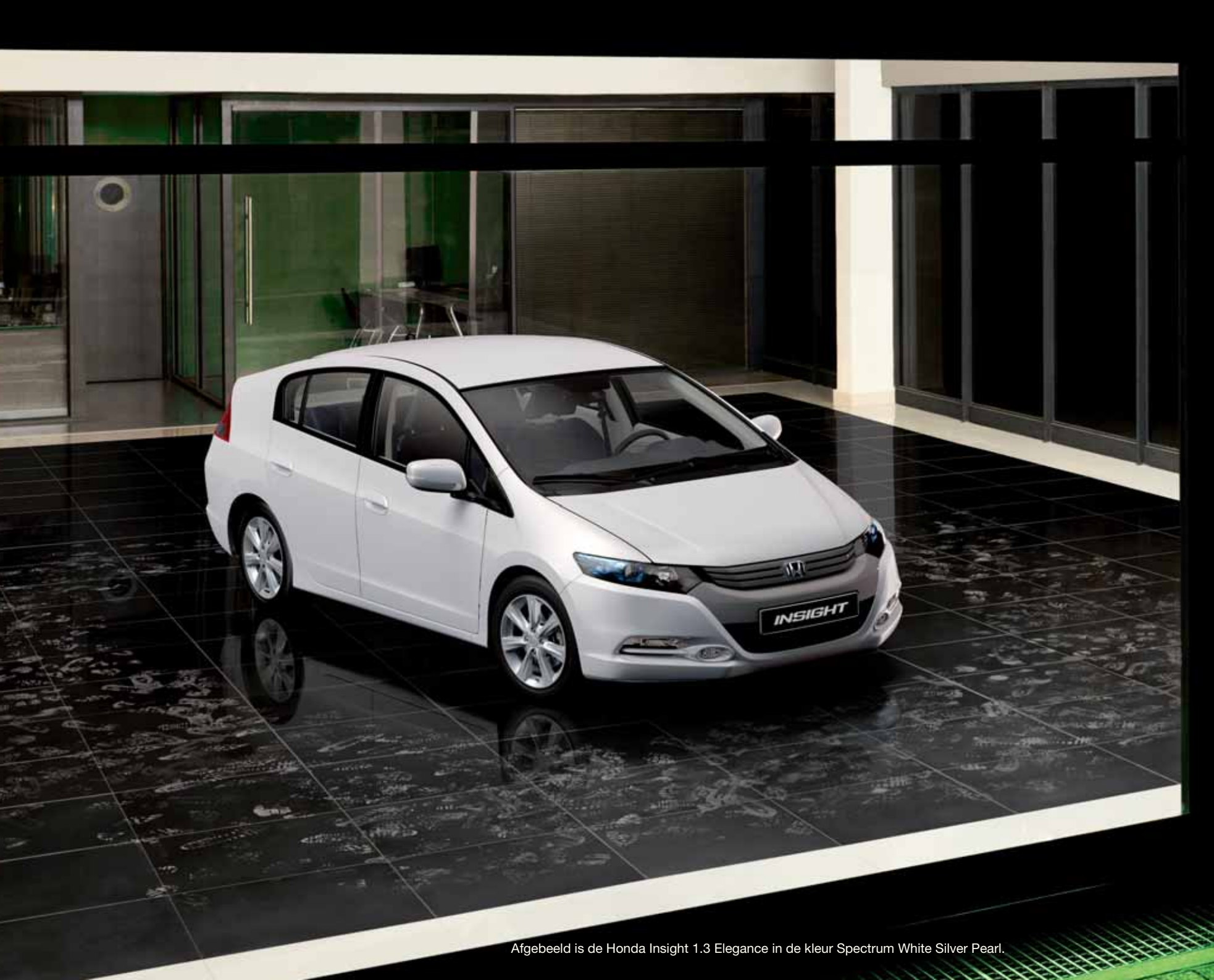
Afgebeeld is de Honda Insight 1.3 Elegance in de kleur Spectrum White Silver Pearl.