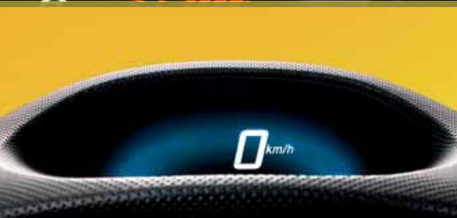
De meter licht blauw op bij ruw rijden of plotseling hard remmen..