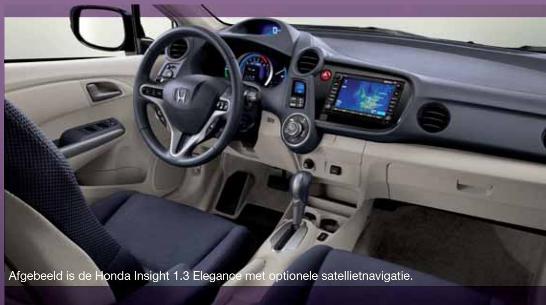
Afgebeeld is de Honda Insight 1.3 Elegance met optionele satellietnavigatie.