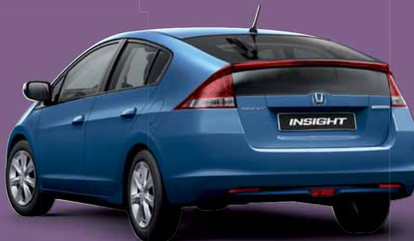
NEUTRON BLUE METALLIC (beschikbaar met lichtgrijs interieur)