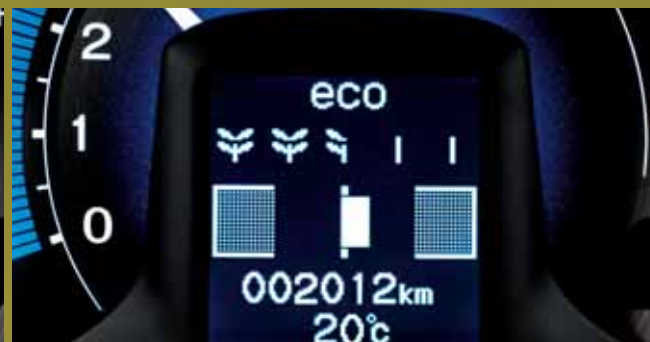
Hoe efficiënter u rijdt, hoe meer blaadjes er aan het steeltje verschijnen.