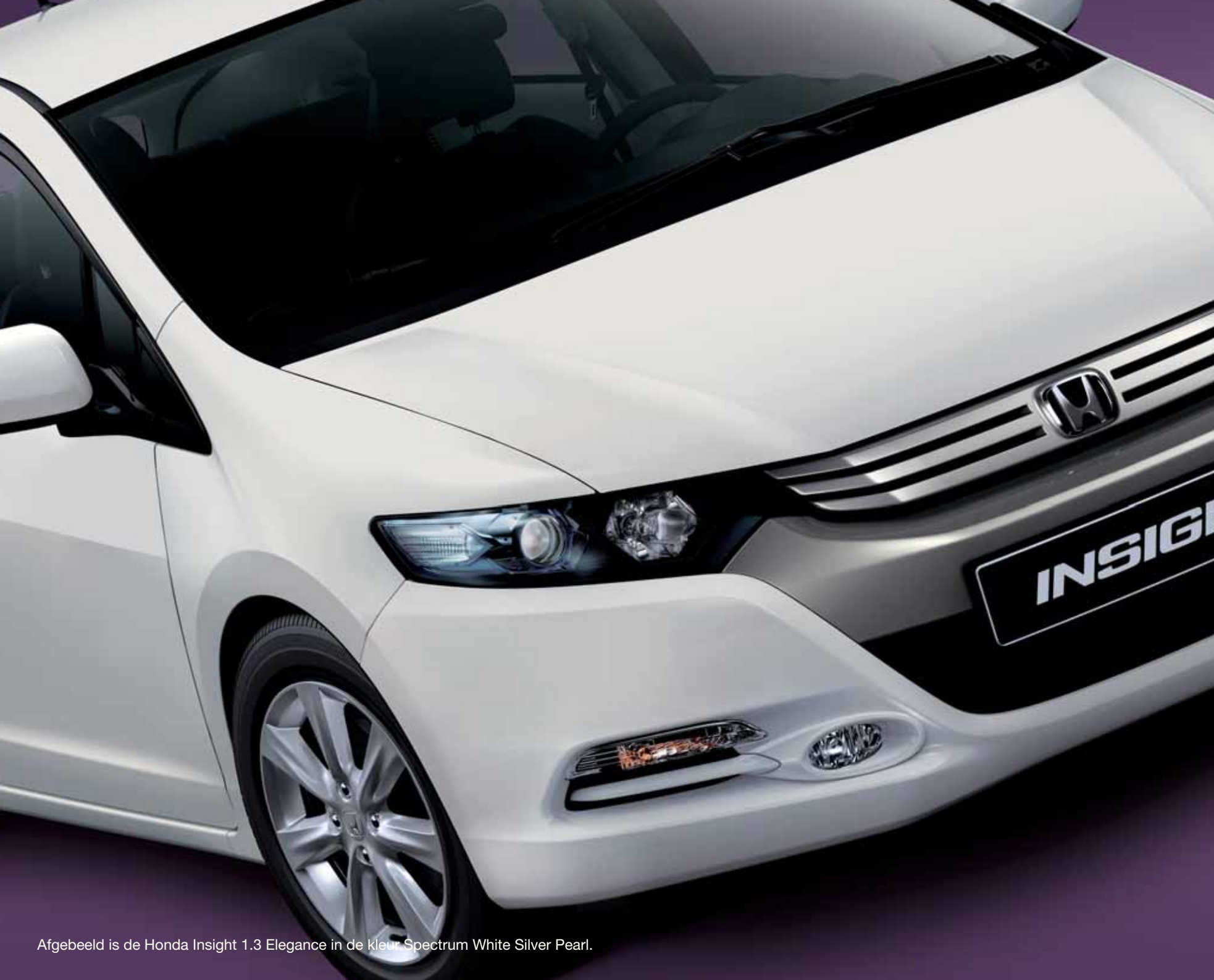
Afgebeeld is de Honda Insight 1.3 Elegance in de kleur Spectrum White Silver Pearl.