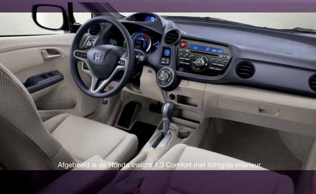
Afgebeeld is de Honda Insight 1.3 Comfort met lichtgrijs interieur.

Buitenspiegels met geïntegreerde LED-knipperlichten Middenarmsteun, voor Multifunctioneel stuurwiel Kaartleeslampjes, voor Buitenspiegels, elektrisch verstelbaar, verwarmbaar en inklapbaar Make-up spiegel, voor bestuurder en voorpassagier Lectuurtas aan de rugleuning passagierstoel Hoedenplank Verlichting in de bagageruimte Radio met CD-speler (MP3-mogelijkheid) Aansluitpoort externe audiobronnen AUX-IN Luidsprekers, voor (2) / achter (2) Elektrisch bedienbare ruiten voor, met comfortschakeling 15" Lichtmetalen velgen Ruitenwisser achter