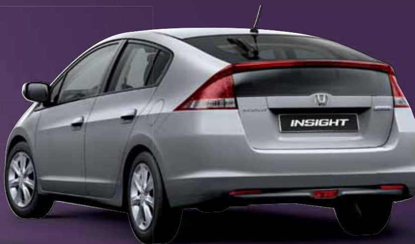
ALABASTER SILVER METALLIC (beschikbaar met blauw interieur)