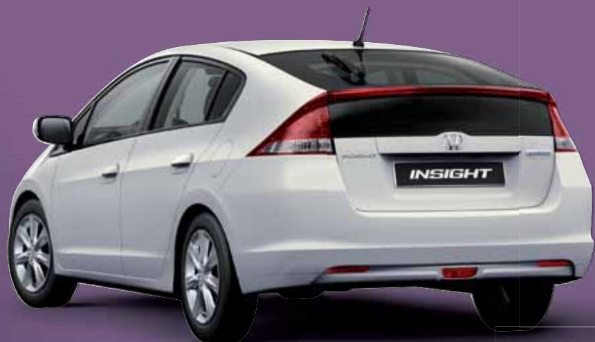
SPECTRUM WHITE PEARL (beschikbaar met blauw interieur)