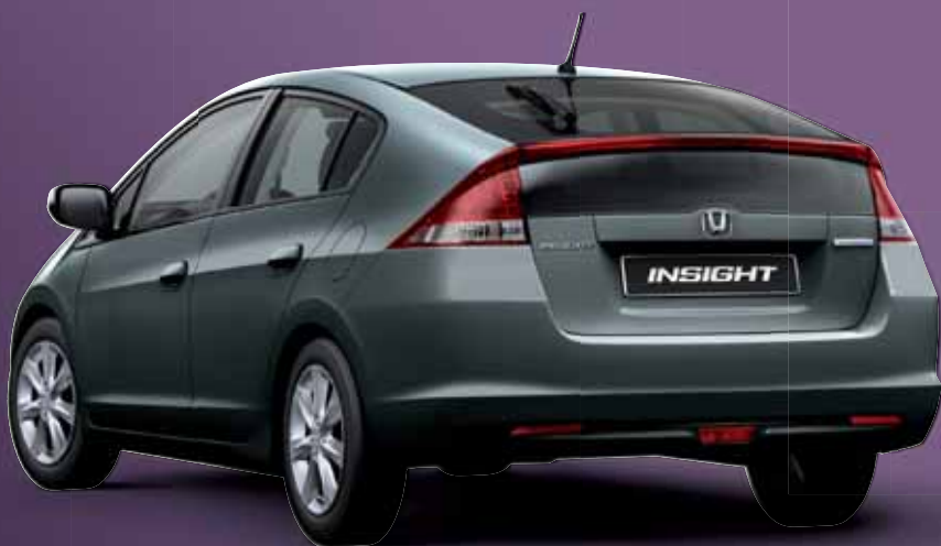
POLISHED METAL METALLIC (beschikbaar met lichtgrijs of blauw interieur)