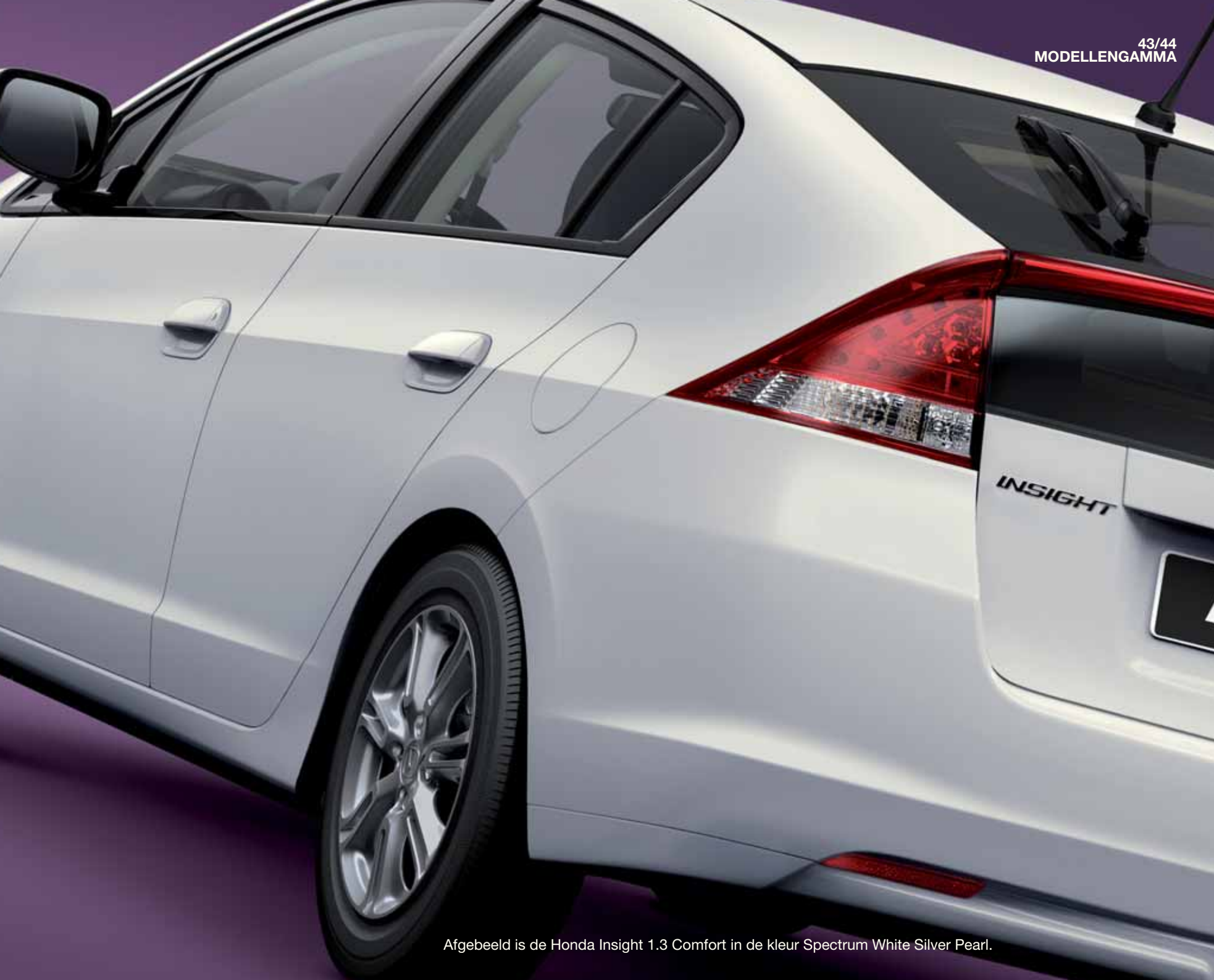
Afgebeeld is de Honda Insight 1.3 Comfort in de kleur Spectrum White Silver Pearl.