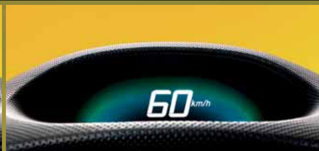
Rustig accelereren of remmen zorgt voor een blauwgroene kleur.