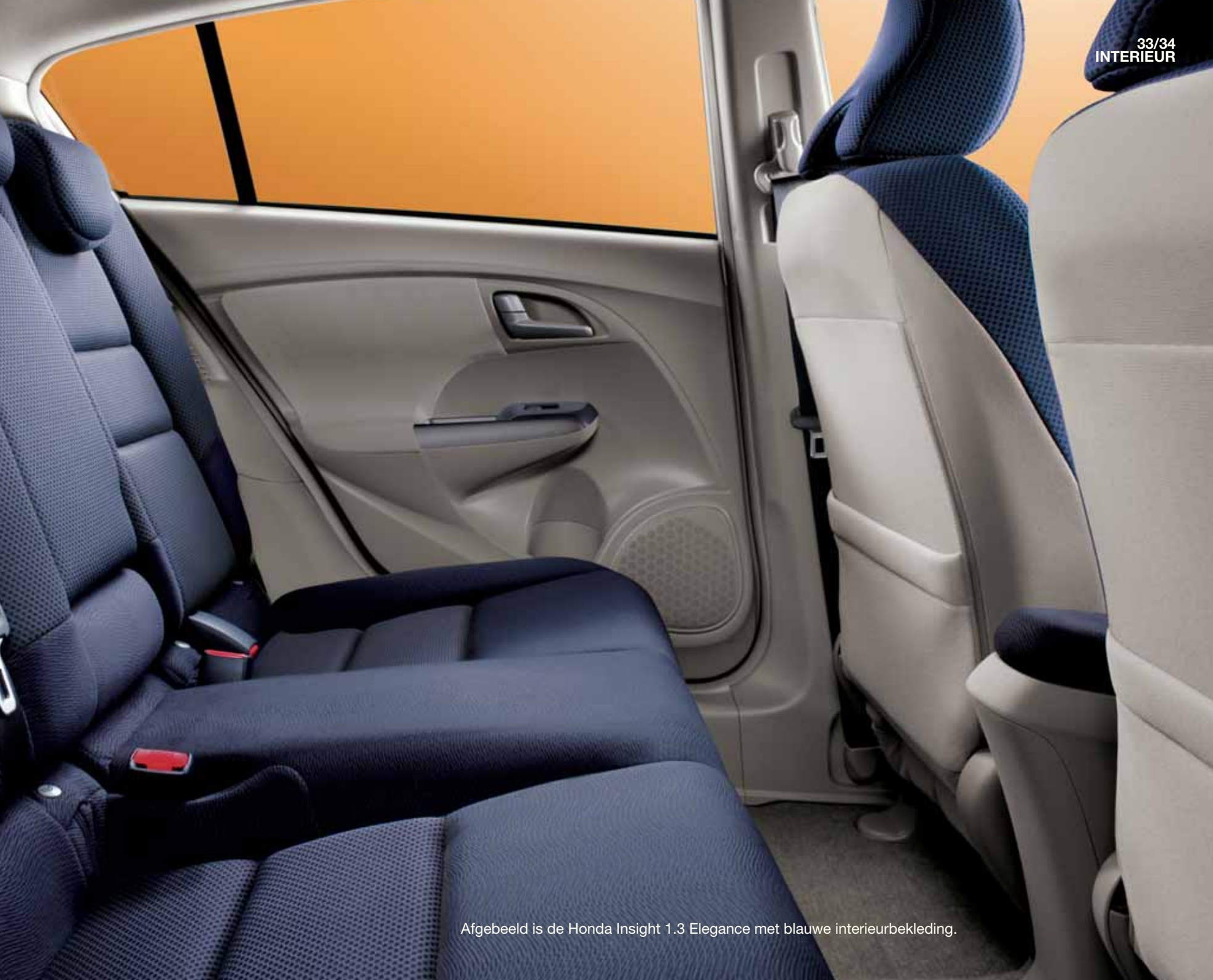
Afgebeeld is de Honda Insight 1.3 Elegance met blauwe interieurbekleding.