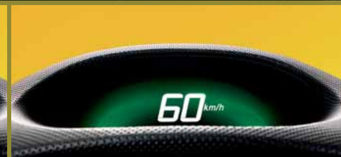
Optimaal rijden en remmen resulteert in een groene kleur.