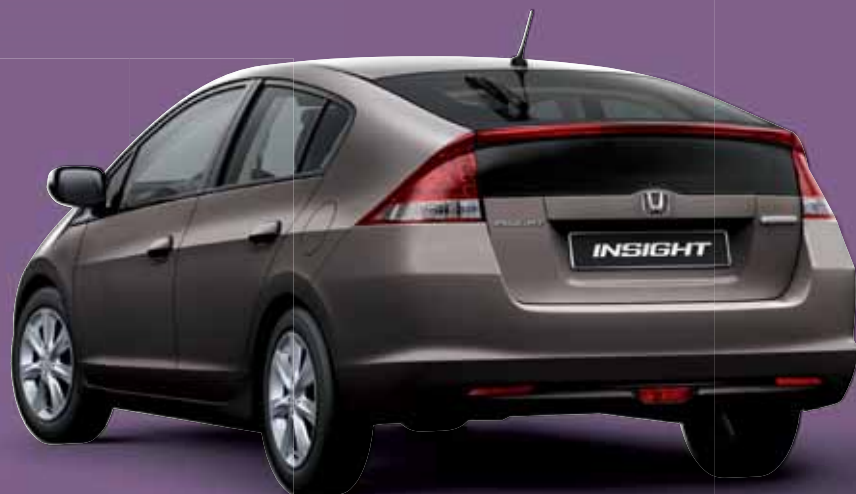
URBAN TITANIUM METALLIC (beschikbaar met lichtgrijs interieur)