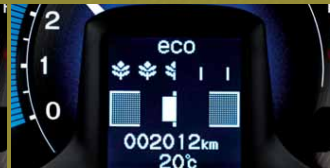
Perfect rijden wordt beloond met een volgroeide bloem.