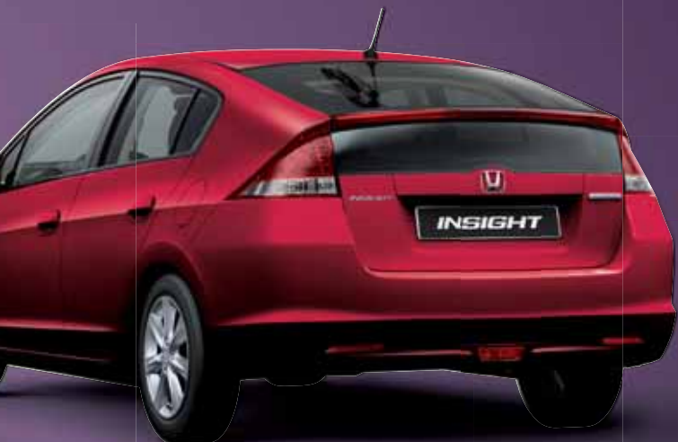
MILANO RED (beschikbaar met lichtgrijs of blauw interieur)