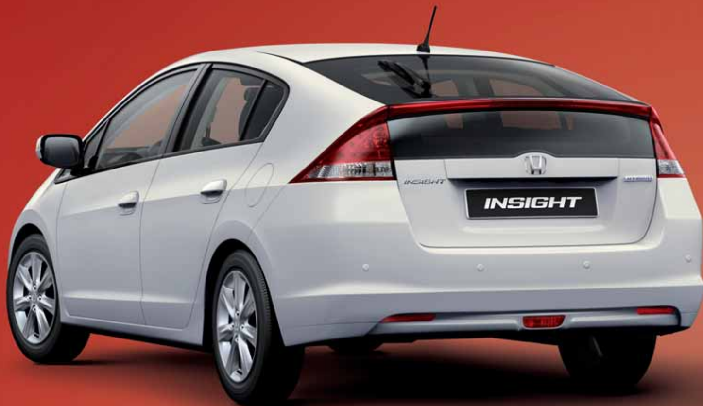
Afgebeeld is de Honda Insight 1.3 Elegance in de kleur Spectrum White Silver Pearl .