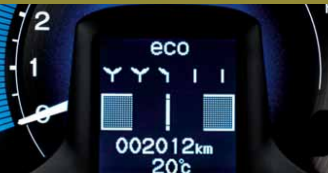
Gedurende elke rit begint de bloem te groeien.