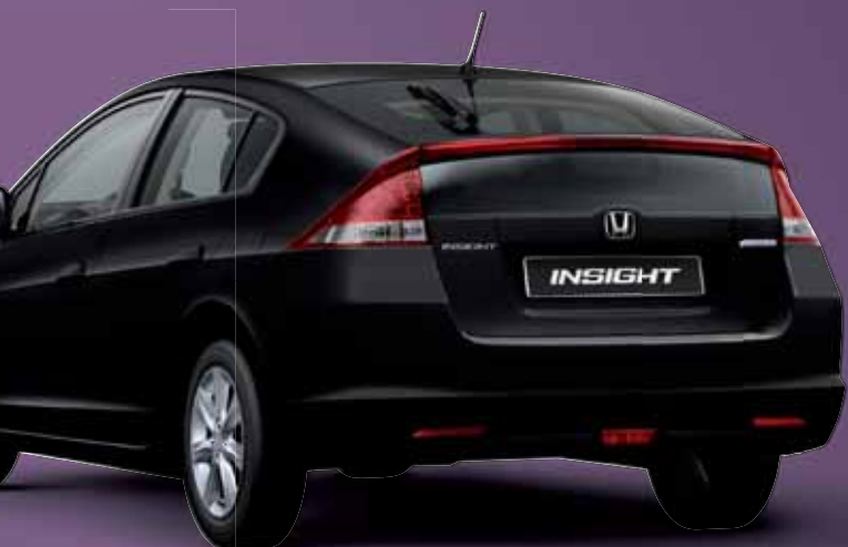
CRYSTAL BLACK PEARL (beschikbaar met lichtgrijs interieur)