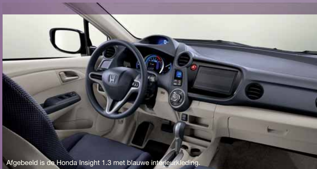
Afgebeeld is de Honda Insight 1.3 met blauwe interieurkleding.