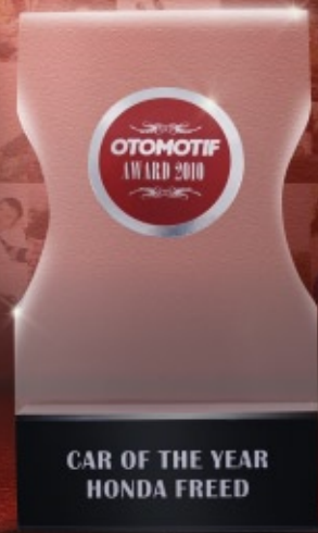
Car of The Year 2010 (Otomotif Award 2010)