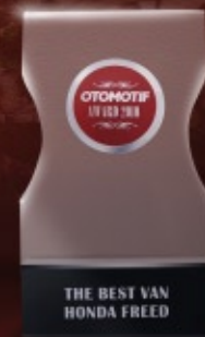
Best Van (Otomotif Award 2010)