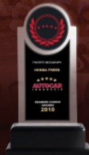
Favorite Medium MPV (AutoCar Reader's Choice Award 2010)