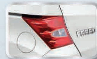
ไฟท้าย LED สปอร์ตใหม่