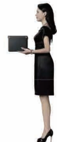
Woman + Baggage