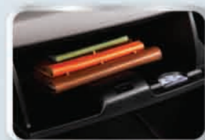
กล่องเก็บของด้านหน้า พร้อมช่องเสียบบัตร