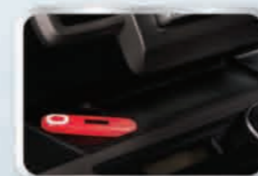
ถาดวางของบริเวณคอนโซลหน้า