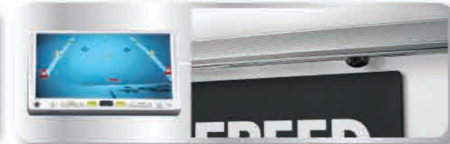
ชุดเครื่องเล่นดีวีดี / ซีดี 1 แผ่น / MP3 พร้อมกล่องต่อหลัง 3