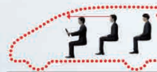
เบาะนั่งแถวที่ 2 แบบ Captain Seat เพื่อความรู้สึกสบายตลอดการเดินทาง