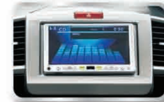
ชุดเครื่องเล่นดีวีดี / ซีดี 1 แผ่น / MP3 3 (ยกเว้นรุ่น E-Navi Sport)