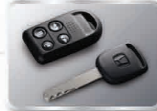
กุญแจพร้อมรีโมทควบคุมการเปิด-ปิด ประตูหน้าและข้างแบบสโตนีไฟฟ้