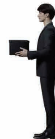
Man + Baggage