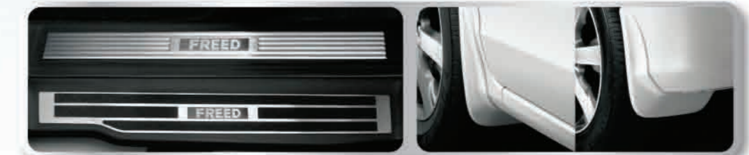
คิ้วกันโคลนเตลหน้า / หลัง 2