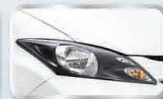
ไฟหน้า LED ฮิวาไดร์