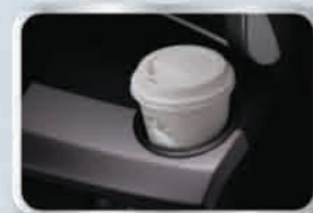
ที่วางแก้วน้ำบริเวณคอนโซลหน้า