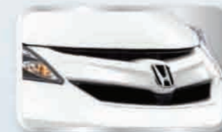
กระจังหน้าแบบสปอร์ต