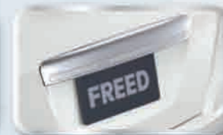
ตัวพาดประตูกันรอยครีเมียม