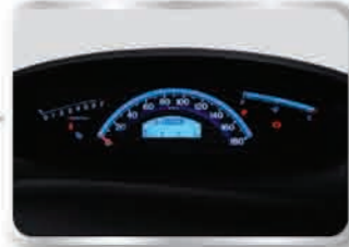
มาตรวัดเรืองแสง