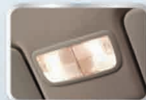
ไฟอ่านหนังสือด้านหน้า