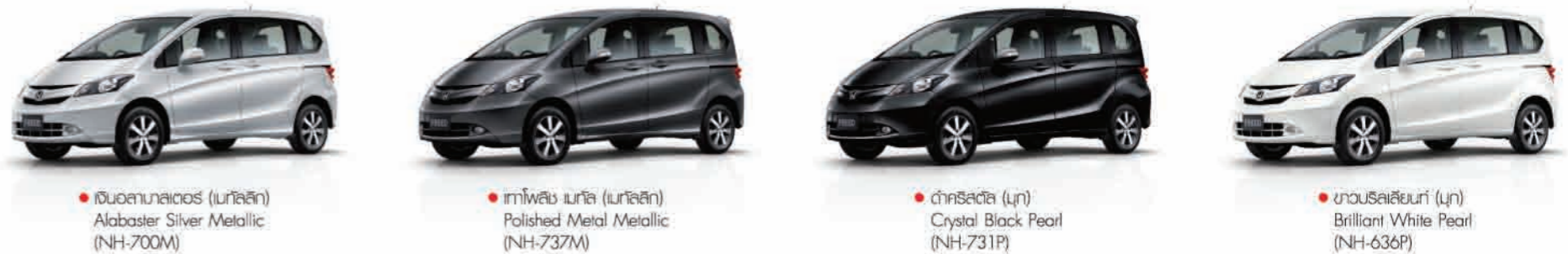
• เงินอลาบาสเตอร์ (เมทัลลิก) Alabaster Silver Metallic (NH-700M) • เทปโพลิช เมทัล (เมทัลลิก) Polished Metal Metallic (NH-737M) • ดำคริสตัล (เมท) Crystal Black Pearl (NH-731P) • ขาวบริลลิเอนท์ (เมท) Brilliant White Pearl (NH-636P)