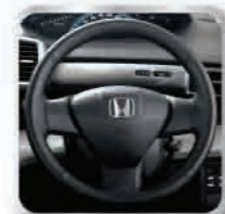
ชุดตกแต่งหนังหุ้มพวงมาลัย 3