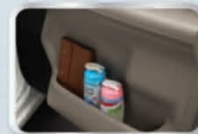
ช่องเก็บของบริเวณแผงข้างประตู