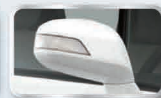
กระจกมองข้างพร้อมไฟเลี้ยวในตัว ปรับและพับไฟฟ้า