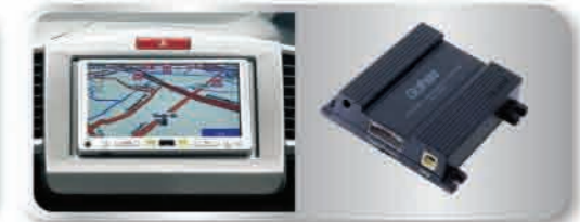
ชุดเครื่องเล่นดีวีดี / ซีดี 1 แผ่น / MP3 พร้อมกล่องรับสัญญาณระบบนำทางเบรกิตอร์ (ยกเว้นรุ่น E-Navi Sport)