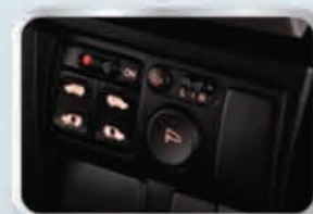
สวิตช์ควบคุมประตูข้างแบบสไลด์