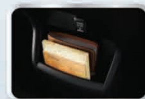
ช่องเก็บของด้านหน้า