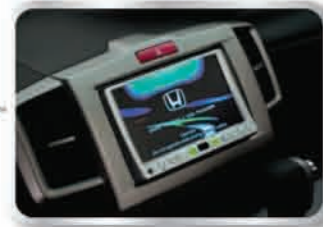
ระบบนำทางเนวิเกเตอร์ พร้อมเครื่องเล่นดีวีดี