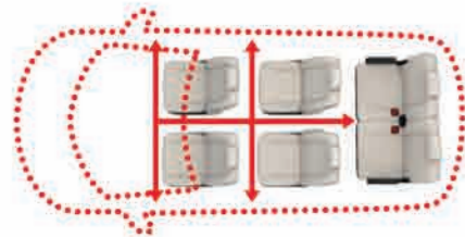
พื้นที่ห้องโดยสารแบบเบาะราบ เพื่อการเคลื่อนที่อิสระ