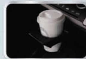
ที่วางแก้วน้ำแบบพับเก็บได้