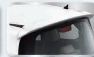
สเปกเซอร์หลัง