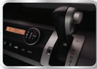
ระบบเกียร์อัตโนมัติ 5 สปีด