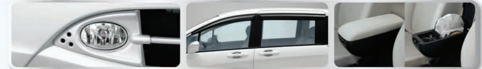
ไฟตัดหมอก 2