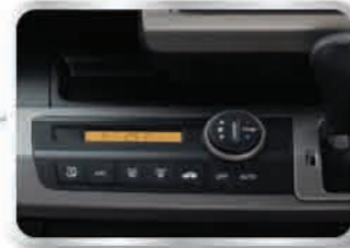
ระบบปรับอากาศอัตโนมัติ