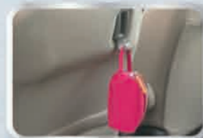
ตะขอแขวนสัมภาระ