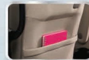
ช่องเก็บของหลังเบาะนั่ง พนักโดยสารตอนหน้า