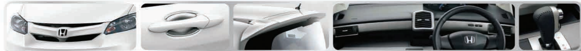
กระจังหน้า 2