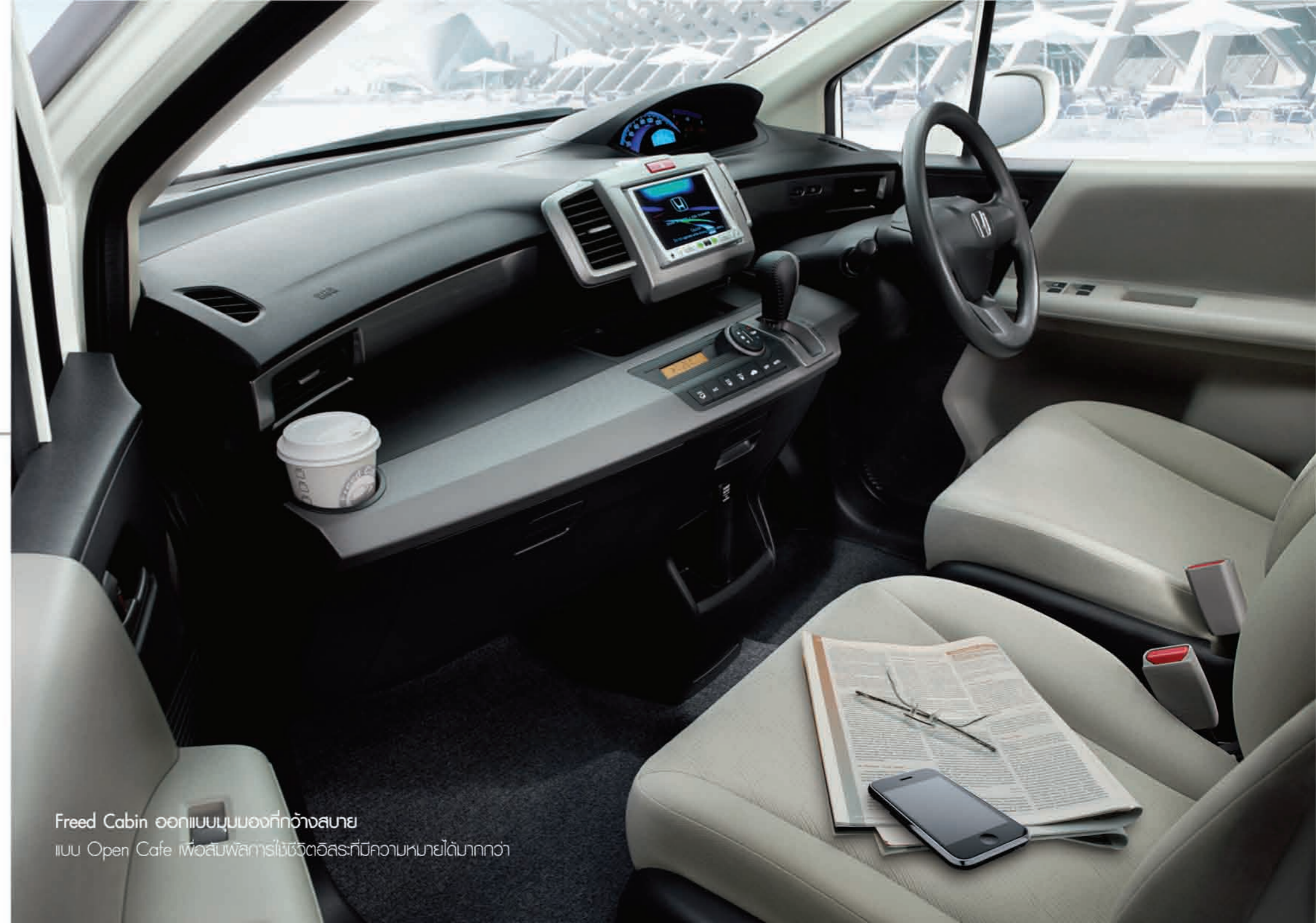
Freed Cabin ออกแบบมุมมองที่กว้างสบาย แบบ Open Cafe เพื่อสัมผัสการขับขี่ที่อิสระที่มีความหมายได้มากกว่า